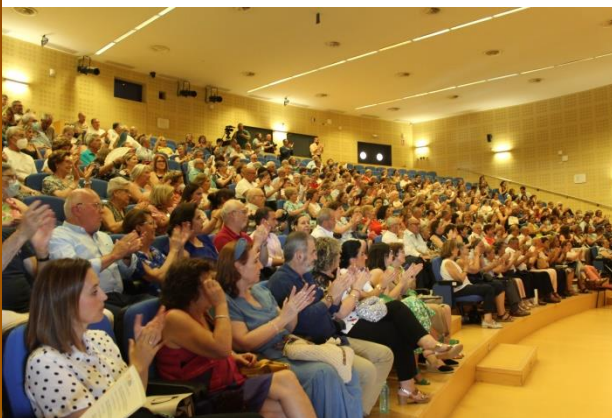
Actos de Clausura del curso 2021/2022 del Aula Abierta de Mayores

Más información sobre los Actos de Clausura en: