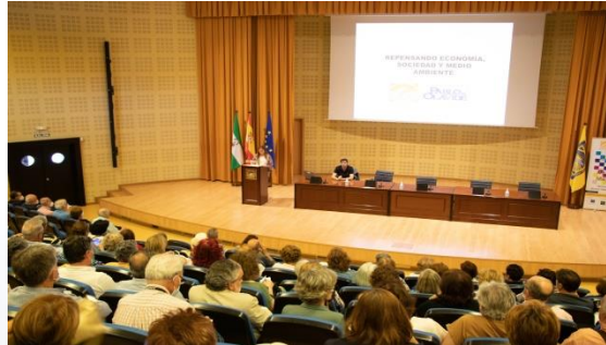
Seminarios Académicos del Aula Abierta de Mayores