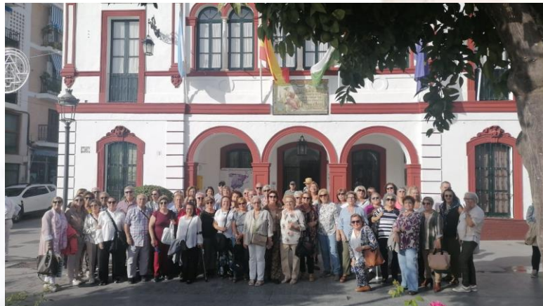
Alumnado de La Algaba visita al grupo de Lebrija en una actividad por el V centenario de Antonio de Nebrija