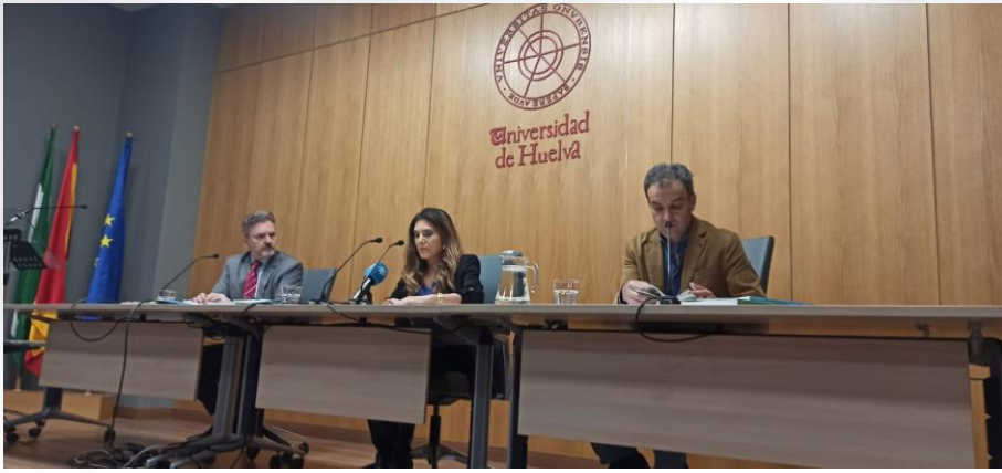
Acto de clausura del Taller Mayores con WIFI, celebrado en la Universidad de Huelva