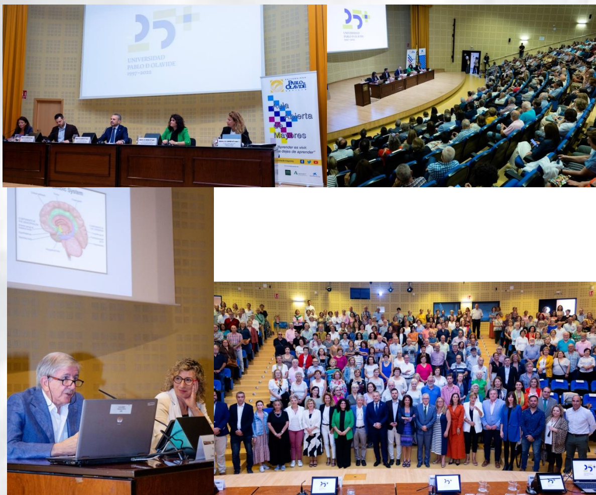
Acto de Inauguración del curso 2022/2023 del Aula Abierta de Mayores