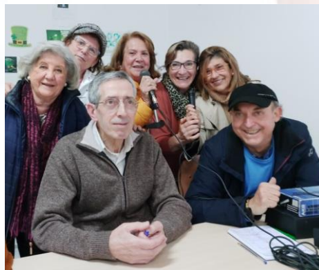
Alumnado de la sede del AAM en La Puebla del Río, realizando el programa "La Puebla del Río al habla" en RadiOlavide ( https://www.upo.es/diario/comunidad/2022/07/radiolavide-estrena-el-programa-la-puebla-del-rio-al-habla-un-podcast-especial-del-alumnado-del-aula-abierta-de-mayores/ )