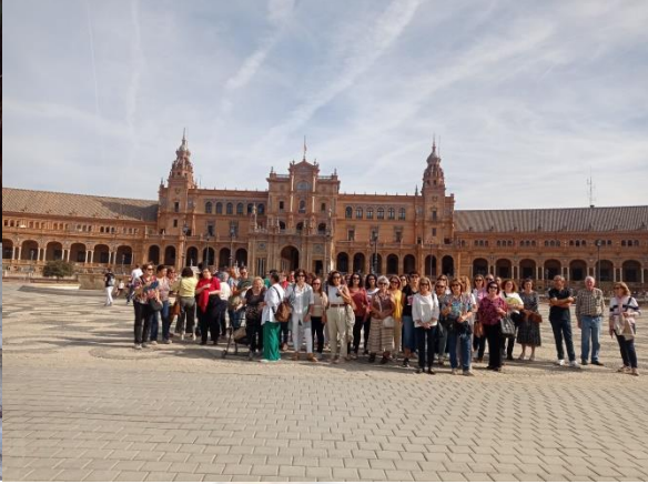
El alumnado de Gerena visita el Museo Militar, la Plaza de España, el Parque de María Luisa y la glorieta de Bécquer