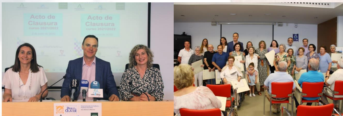
Acto de clausura en el municipio del AAM en Lebrija

En la recta final del curso académico 2021/2022 (de abril a julio de 2022), se ha desarrollado una amplia variedad de actividades en el marco del Aula Abierta de Mayores. Entre dichas acciones podemos encontrar docencia impartida por profesorado universitario y local en las sedes del Programa, así como otras actividades socioculturales que complementan la actividad formativa en clase. Presentamos a continuación una recopilación de las actividades más destacadas en este periodo.