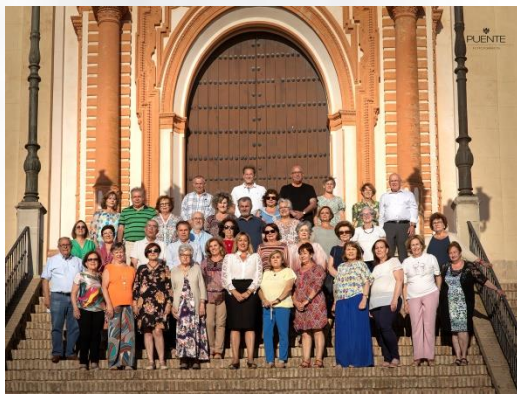
Actividad del alumnado del AAM de Las Cabezas de San Juan