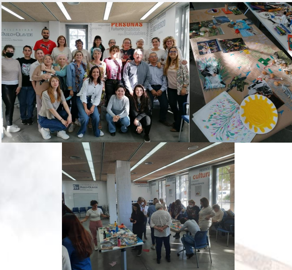
Alumnado del Aula Abierta de Mayores en La Algaba y estudiantes de la Residencia Flora Tristán participando en el taller de arteterapia