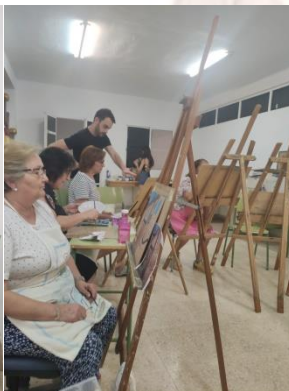
Alumnado de Herrera en clases en la sede