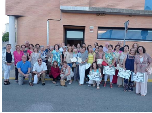
Alumnado de Gerena en clases en la sede, actividades socioculturales y acto de clausura en el municipio