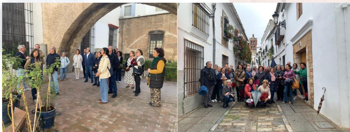
Alumnado de Tomares en visitas a la Iglesia de la Caridad de Sevilla y a Zafrá