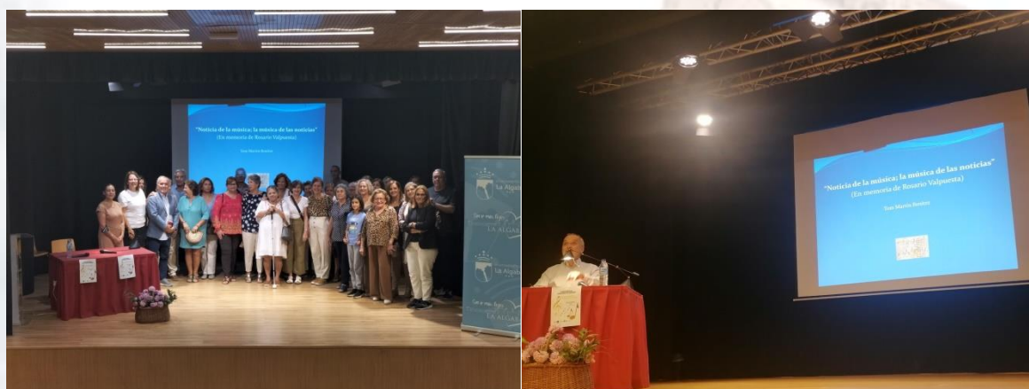
Acto de inauguración de las clases en el municipio de La Algaba