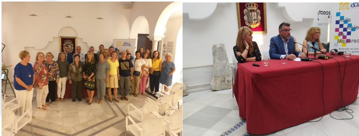
Acto de inauguración de las clases en el municipio de Salteras

Desde octubre a diciembre de 2022 en las diferentes sedes se han venido desarrollando diferentes actividades docentes y socioculturales en el marco del Aula Abierta de Mayores. A continuación presentamos algunas actividades destacadas.