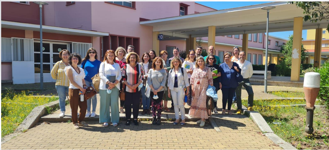
Reunión de coordinación entre el equipo de coordinación de la Universidad Pablo de Olavide y las personas responsables de la coordinación en las sedes locales del Aula Abierta de Mayores

El 30 de marzo de 2022, de forma paralela a la reunión de coordinación, también se llevó a cabo una reunión de evaluación del Aula Abierta de Mayores entre el equipo de coordinación de la UPO y representantes de grupos de alumnado de las diferentes sedes. Se trataron temas de interés para el alumnado del Programa, que reflejaron el punto de vista de los/as estudiantes acerca de las debilidades y fortalezas para la mejora del Aula Abierta de Mayores.