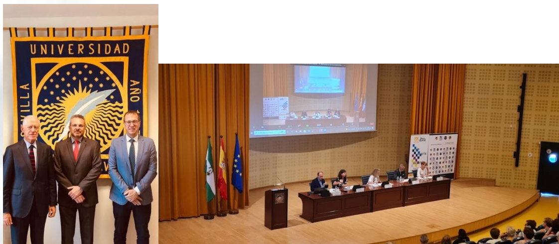
IV Jornadas contra la Desinformación

Este proyecto formativo ha consistido en la organización de cinco jornadas a lo largo del año en las que han participado estudiantes de los programas universitarios para personas mayores de Madrid (Universitas Senioribus CEU), Universitat Politècnica de València (Universidad Senior), Universidad de Deusto (DeustoBide de la Escuela de Ciudadanía) y Universitat de Barcelona (Universitat de l'Experiència) y la Universidad Pablo de Olavide (Aula Abierta de Mayores).