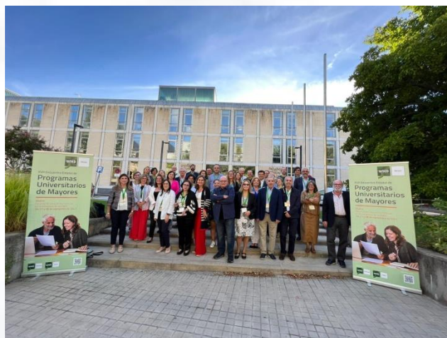
XVII Encuentro Estatal de Programas Universitarios de Mayores

éxitos de la implantación de programas para mayores en aquellos municipios con menos población y más alejados de las capitales de provincia.