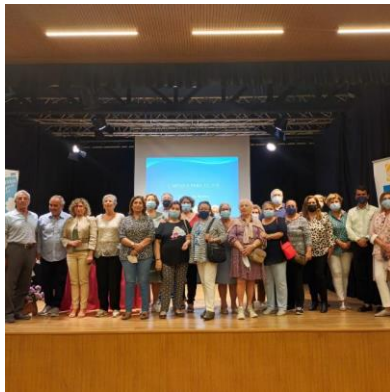
Acto de clausura en el municipio del AAM en La Algaba