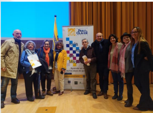
Alumnado de la Sede de La Puebla del Río, tras la exposición de su trabajo.