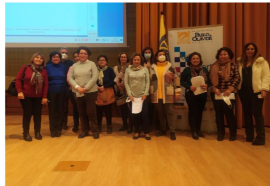
Alumnado de la Sede de Tomares, tras la exposición de su trabajo con el título "Tomares, ayer y hoy".