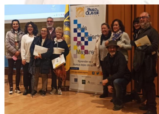
Nos acompañaron desde el Viso del Alcor un grupo de futuros estudiantes y sus coordinadores/a.