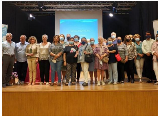
Acto de Inauguración del AAM en el municipio de LA Algaba.