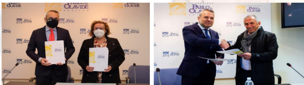
Imagen institucional de firma de convenios del Aula Abierta de Mayores.