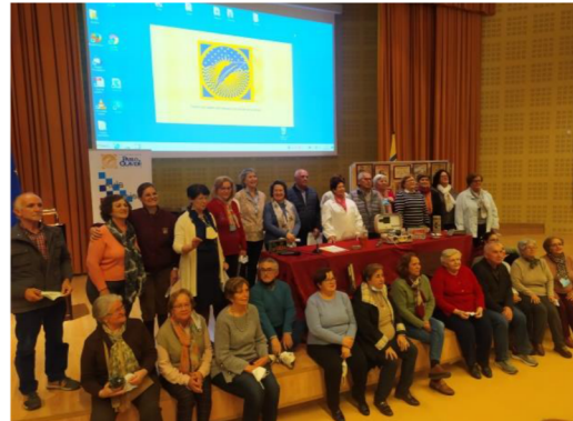
Alumnado de la Sede de Herrera, exponiendo su trabajo con el título "El arte de curar: Un viaje en el tiempo desde el museo de Medicina Antigua de Herrera".