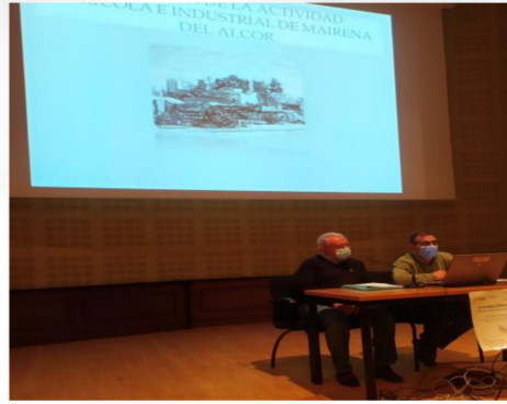
Alumnado de la Sede de Mairena del Alcor, exponiendo su trabajo con el título "Mairena del Alcor, ayer y hoy (S.XX-S.XXI)".