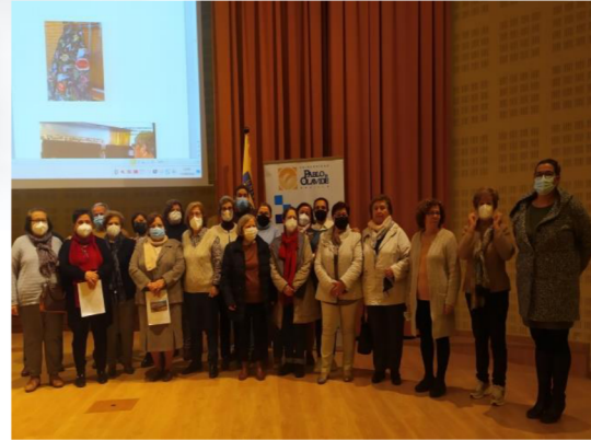
Alumnado de la Sede de Aznalcóllar, tras la exposición de su trabajo con el título "Aznalcóllar, un pasado y un presente. Mirando hacia el futuro".