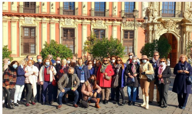
Alumnado del AAM de Tomares.