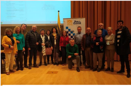
Alumnado de la Sede de Dos Hermanas, tras la exposición de su trabajo con el título "Dos Hermanas, de Villa a Gran Ciudad".