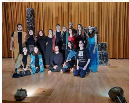
Obra de Teatro: "Andrómaca". Compañía Teatral: Furor Bacchicus. Grupo de Teatro Grecolatino de la Facultad de Humanidades de la Universidad Pablo de Olavide.