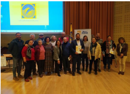
Alumnado de la Sede de Gines, tras la exposición de su trabajo con el título "Hacienda el Santo Ángel, pasado y presente en la Villa de Gines".