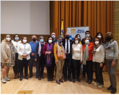
Alumnado de la Sede de Bormujos, tras la exposición de su trabajo con el título "Un amojonamiento de Bormujos en el Siglo XVII".