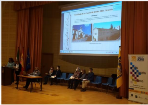
Alumnado de la Sede de Castilleja de la Cuesta exponiendo su trabajo con el título "Castilleja de la Cuesta de 1940 a 2020. Su evolución".