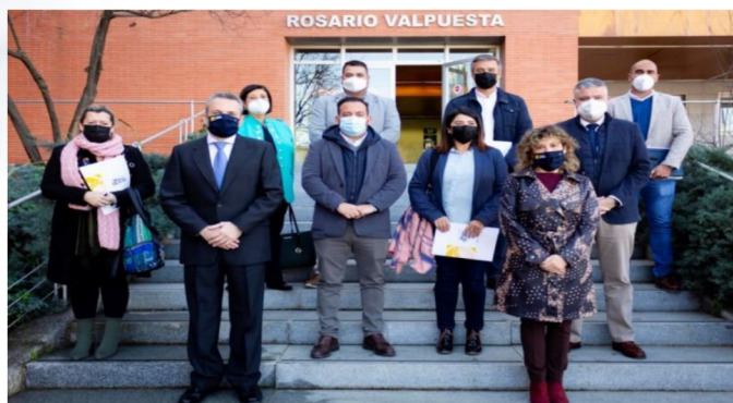
Imagen institucional de firma de convenios del Aula Abierta de Mayores.