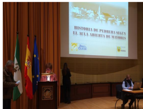
Alumnado de la Sede de Pedrera, exponiendo su trabajo con el título "Historia de Pedrera según el Aula Abierta de Mayores".