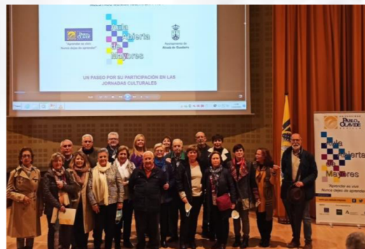
Alumnado de la Sede de Alcalá de Guadaíra.