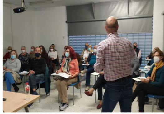
Alumnado del AAM de Castilleja de la Cuesta.