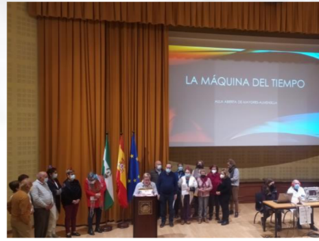
Alumnado de la Sede de Almensilla, exponiendo su trabajo con el título "La Máquina del Tiempo".