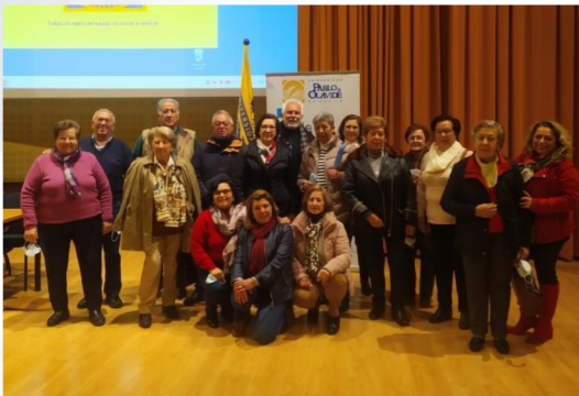
Alumnado de la Sede de Gilena, tras la exposición de su trabajo con el título "Gilena, Ayer y Hoy".