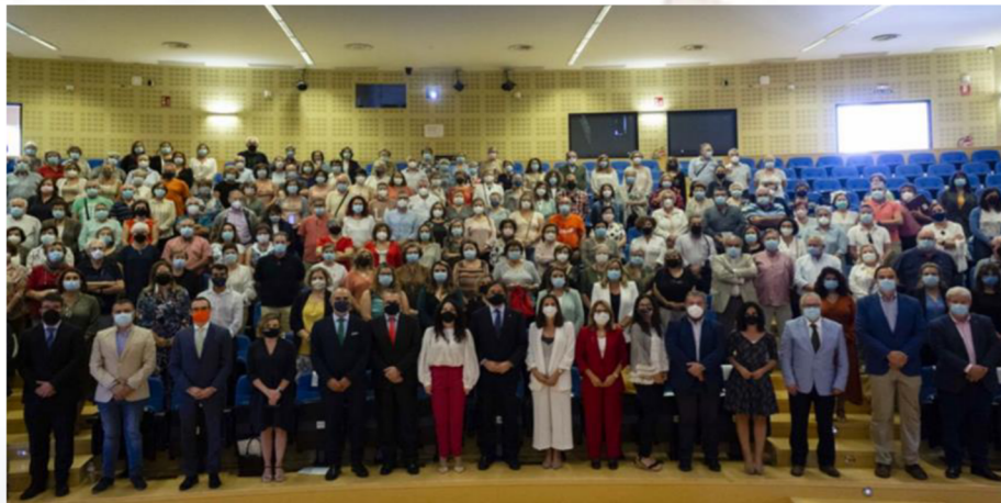
Acto de inauguración del curso 21/22 del AAM.

El Aula vuelve a la máxima presencialidad con clases en todas sus sedes, la organización de actividades formativas y culturales en el campus universitario como la lección inaugural, seminarios académicos, jornadas culturales y actos de graduación, así como el encuentro provincial, que facilita la interrelación y cohesión del alumnado de las distintas sedes que no pudieron realizarse con motivo de la pandemia.