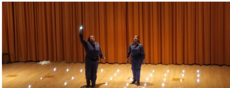
Obra de Teatro: "Niña dá la luh". Compañía Teatral: Salamandra Cia Teatro Social.