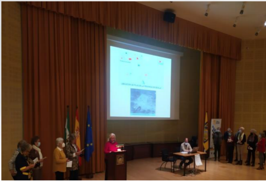
Alumnado de la Sede de Pilas, exponiendo su trabajo con el título "Pilás, un pueblo con historia y sabiduría".