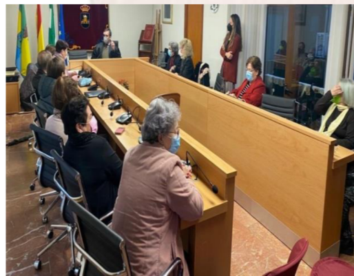
Alumnado del AAM de Aznalcóllar.