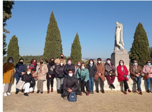
Alumnado del AAM de la sede de Gerena.