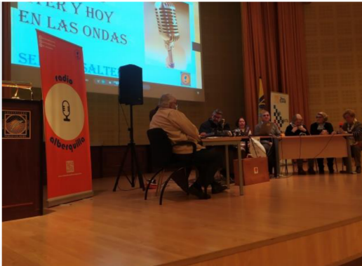
Alumnado de la Sede de Salteras, exponiendo su trabajo con el título "Nuestro Municipios, ayer y hoy en las ondas".