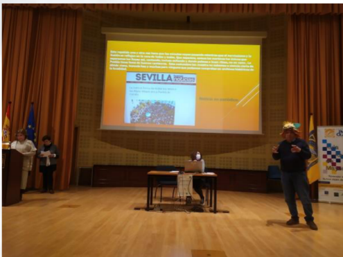
Alumnado de la Sede de La Puebla de Cazalla, exponiendo su trabajo con el título "Nuestros Municipios, ayer y hoy: Tradiciones y Fiestas Moriscas".