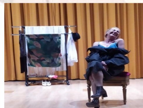
"Mata Hari. La última mentira". Compañía teatral: La turista.