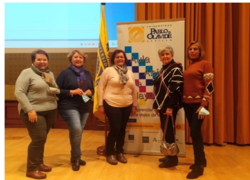
Alumnado de la Sede de Santiponce.