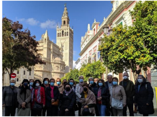
Alumnado del AAM de Pilas.