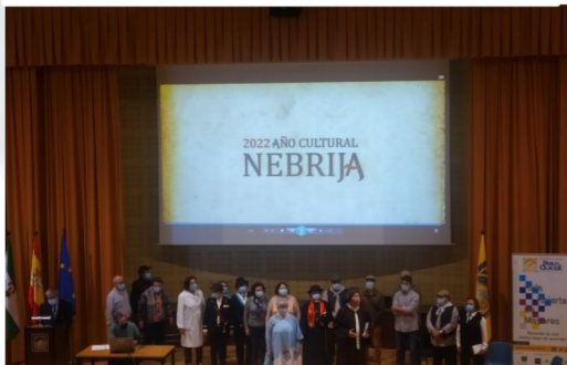
Alumnado de la Sede de Lebrija exponiendo su trabajo con el título "Con los ojos de Elio Antonio: Lebrija ayer, hoy y siempre".