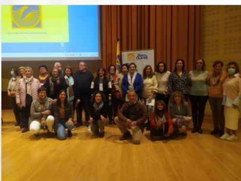
Alumnado de la Sede de Gerena, exponiendo su trabajo con el título "Gerena, ayer y hoy".