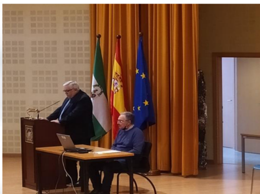
Alumnado de la Sede de La Algaba, exponiendo su trabajo con el título "Érase una vez La Algaba".