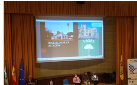
Alumnado de la Sede de Bollullos de la Mitación exponiendo su trabajo con el título "CuatroVitas y Bollullos de la Mitación".