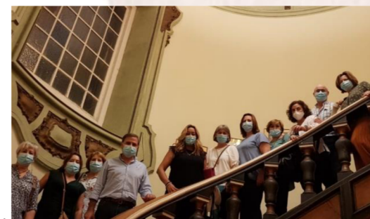
Alumnado del AAM de Las Cabezas de San Juan.