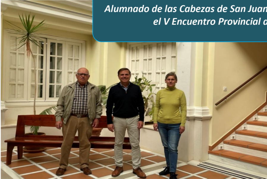
Alumnado de las Cabezas de San Juan, Sede Anfitriona en el V Encuentro Provincial del AAM"