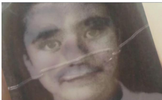
Yo el tiempo, una búsqueda de identidad (2016-2018).