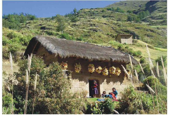
Perú, Huánuco, Dos de Mayo