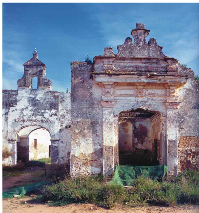
España, Sevilla, Hacienda La Mejorada Baja