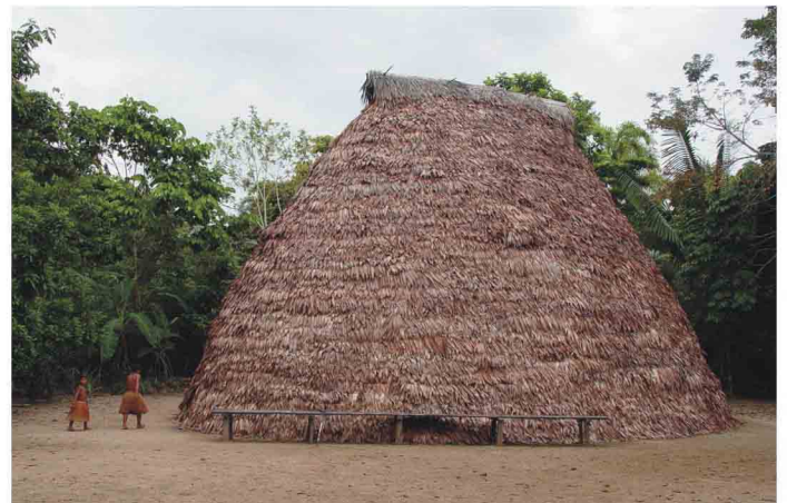
Perú, Iquitos, comunidad nativa Yagua