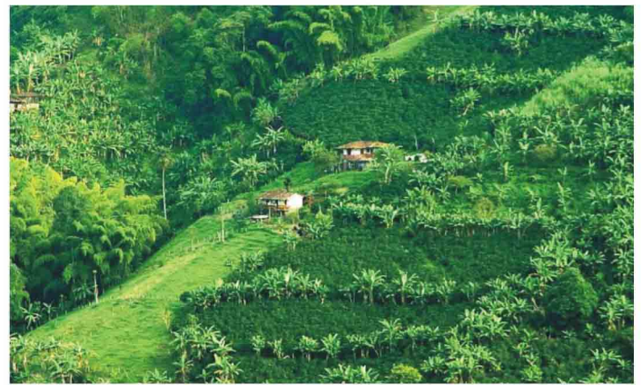
Colombia, paisaje cafetero