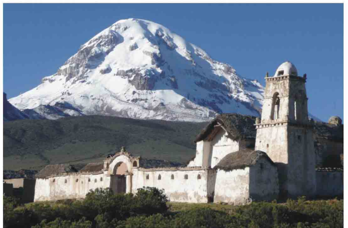
Bolivia, Oruro, iglesia de Sajama