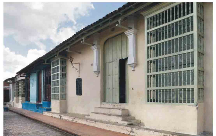
Cuba, vivienda en Camagüey