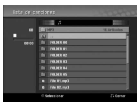
Menú MP3/WMA CD