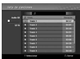
Menú AUDIO CD

El menú AUDIO CD o MP3/WMA CD aparecerá en la pantalla del televisor.