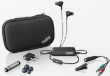
Auriculares con función de cancelación de ruido para ThinkPad® (0B47313)