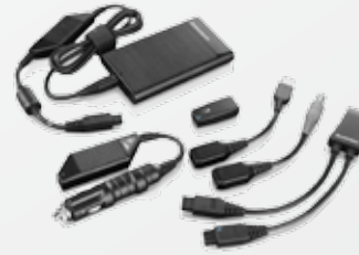
Adaptador ultraplano combinado de CA/CC de 90 vatios de Lenovo® con clavija de alimentación compacta de Lenovo® (41R44xx)