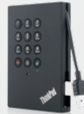
Unidad de disco duro ThinkPad® USB 3.0 segura portátil: 500 GB (0A65619), 750 GB (0A65616), 1 TB (0A65621)