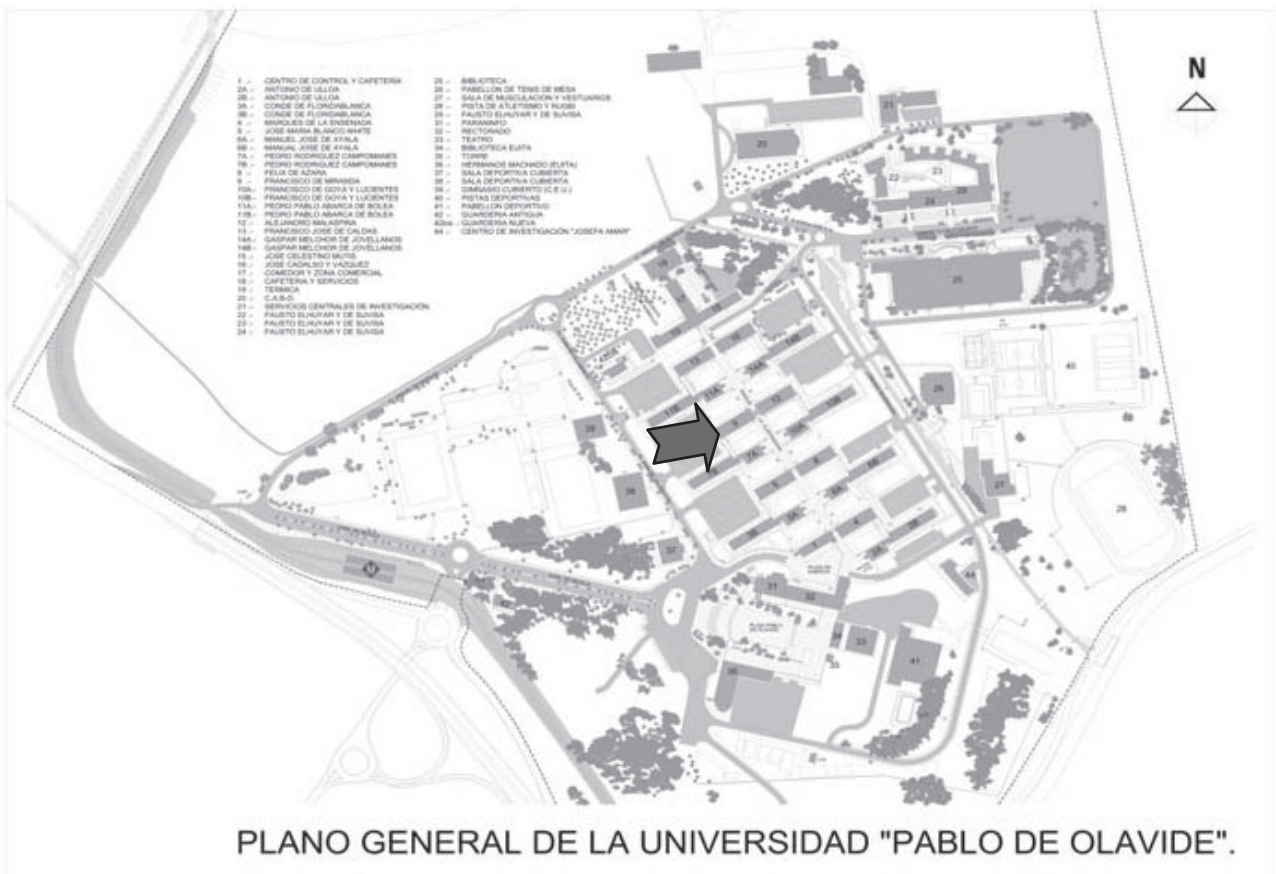
PLANO GENERAL DE LA UNIVERSIDAD "PABLO DE OLAVIDE".