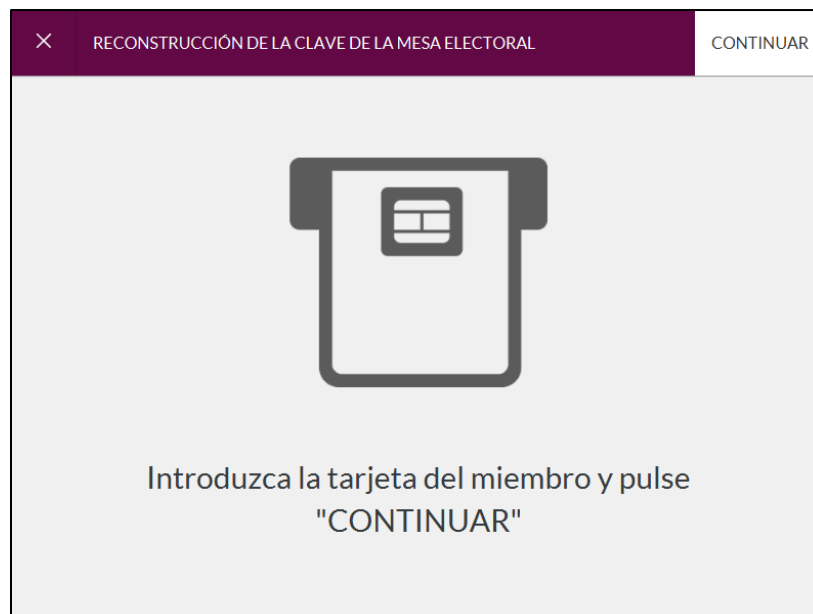
Imagen 1: Lectura de tarjeta para Mixing