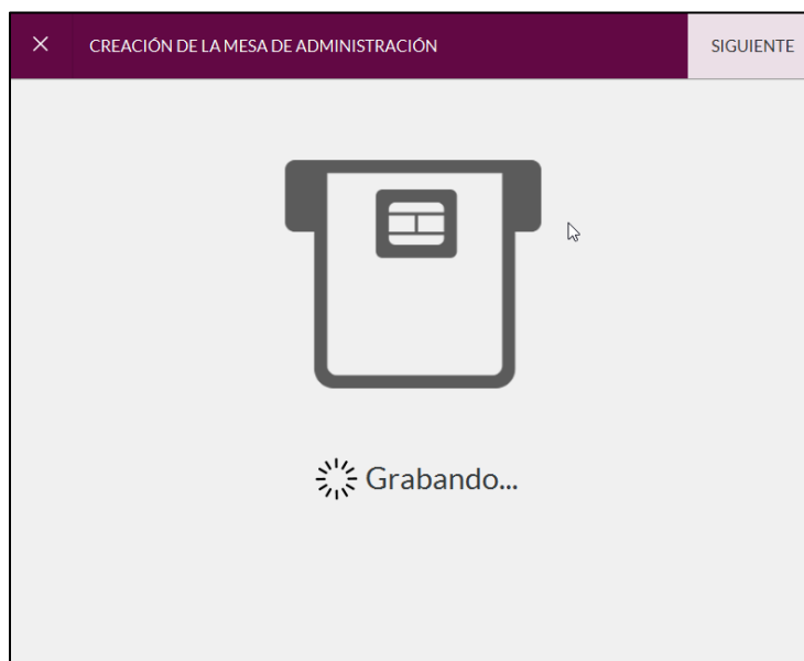
Imagen 5: Grabación tarjeta de Mesa de Administración

17. Repita los pasos 15 y 16 para cada miembro de la Mesa de Administración.