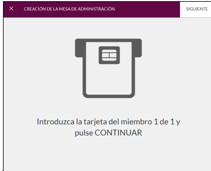
Imagen 3: Creación Mesa de Administración Ventana Emergente