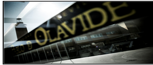
Investigación y Transferencia de Tecnología