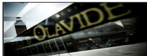
Relaciones con la Sociedad

de gestión en la que las prácticas para titulados se han consolidado entre los jóvenes universitarios y el tejido empresarial de Sevilla y su provincia.