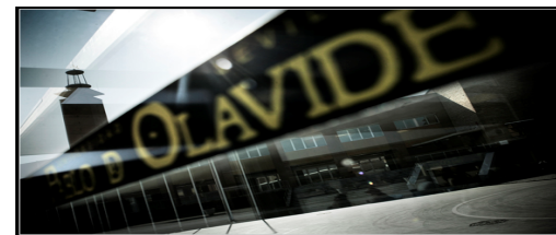
Relaciones con la Sociedad