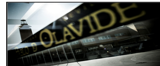
Relaciones con la Sociedad

Como seña de identidad, se sigue apostando por una programación que contenga acciones de marcado compromiso social y formativo y apostando por la intervención socio-comunitaria, propiciando y fortaleciendo la incidencia en nuestro entorno.