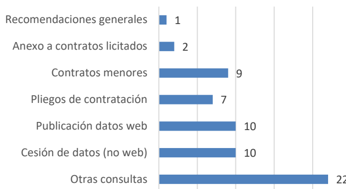
Consultas e informes 2018-2019

En materia de contratación, se han revisado 18 borradores, bien de pliegos de contratación o bien de contratos menores.