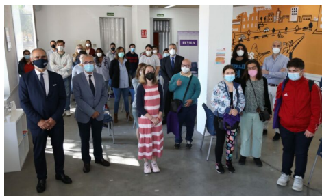
Bienvenida estudiantes del Título propio FEVIDA

Las personas colaboradoras, con la supervisión y asesoramiento del equipo de la R.U. Flora Tristán, no solo intervienen de forma directa dentro de las entidades durante todo el curso académico, sino que, además, fomentan el desarrollo de actividades que cohesionan y coordinan a estas entidades entre sí, consiguiendo un mayor valor añadido en lo que se refiere al posible impacto social de su presencia.