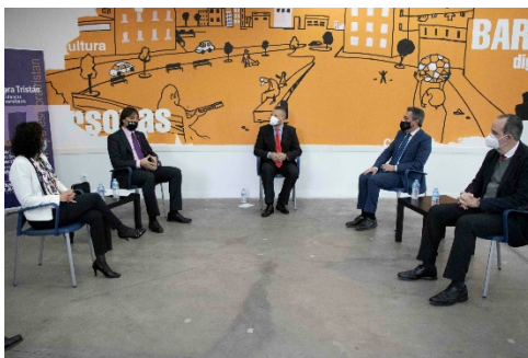
Diálogo del XVII Aniversario de la R. U. Flora Tristán

También es importante resaltar los actos en torno al XVII Aniversario de la Residencia, donde se ha vuelto a dar un impulso importante a su visibilización en la ciudad, gracias a la presencia del Alcalde de Sevilla, el Rector de la Universidad Pablo de Olavide, el Vicerrector de Cultura y Políticas Sociales, la Viceconsejera de Igualdad y Políticas Sociales y Conciliación de la Junta de Andalucía, y el Comisionado para el Polígono Sur.