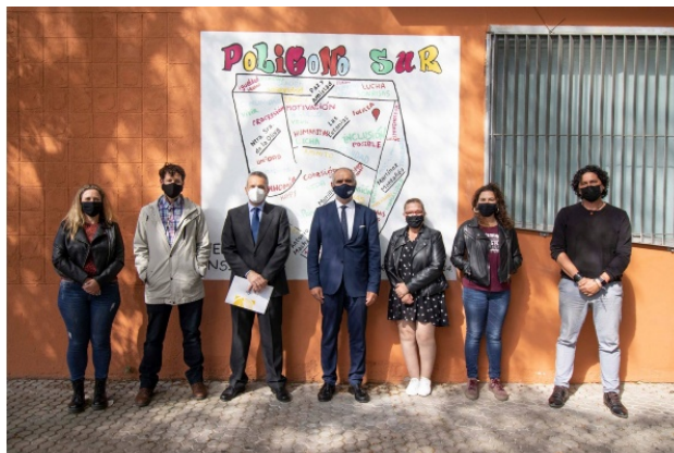
Equipo del Vicerrectorado en la Residencia Universitaria Flora Tristán.