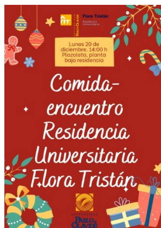
Acto de inauguración del XVIII Aniversario de la Residencia Universitaria Flora Tristán.