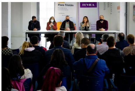
Inauguración proyecto INCLOUT a cargo del Vicerrector de Cultura y Políticas Sociales

En el curso 2021/2022 se ha recuperado, tras dos años de pandemia, la vida interna de la residencia de forma presencial, retomando actividades que se desarrollaban en anteriores cursos como el cineforum, deporte, acogida floreña (residentes atienden a nuevos residentes con diversas necesidades), ajedrez, comida intercultural de navidad, etc. Por otro lado, se han realizado nuevas actividades como intercambio de idiomas respondiendo a la gran diversidad de población extranjera que convive en la residencia, charlas de divulgación científica y movilidad, que ha tratado de conectar a personas residentes para compartir transporte.