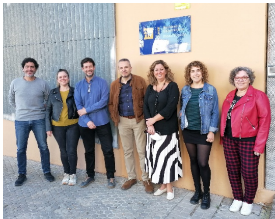
Equipo del Vicerectorado en la Residencia Universitaria Flora Tristán.

El Observatorio de empleo de Polígono Sur , desarrollado desde la Residencia, ha sido un elemento fundamental no sólo en la relación con entidades, sino también en la obtención de datos. Estos datos, que están en fase de tratamiento, recogerán las principales aportaciones e hitos más importantes en la relación con las acciones de empleabilidad y formatos de intervención.