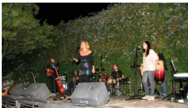
Actuación del grupo musical La Isla de Bécquer

Exposición de fotografías y carteles "Homenaje a Mario Maya" (del 18 de junio al 4 de septiembre de 2011), con la colaboración de la Fundación Mario Maya.