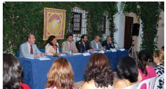
Acto de clausura del primer curso académico de la EAGPA.