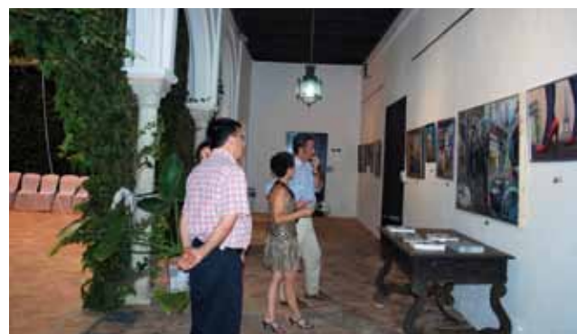
Visitantes contemplan la exposición de pintura "Aquel París".