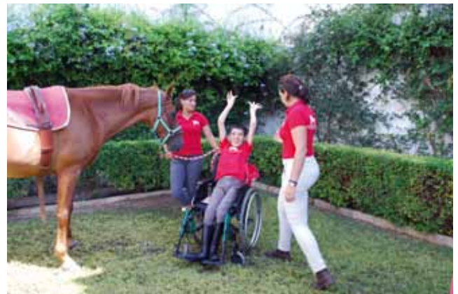
Un paciente de terapias ecuestres acudió al Centro Olavide en Carmona para realizar una de sus sesiones prácticas.