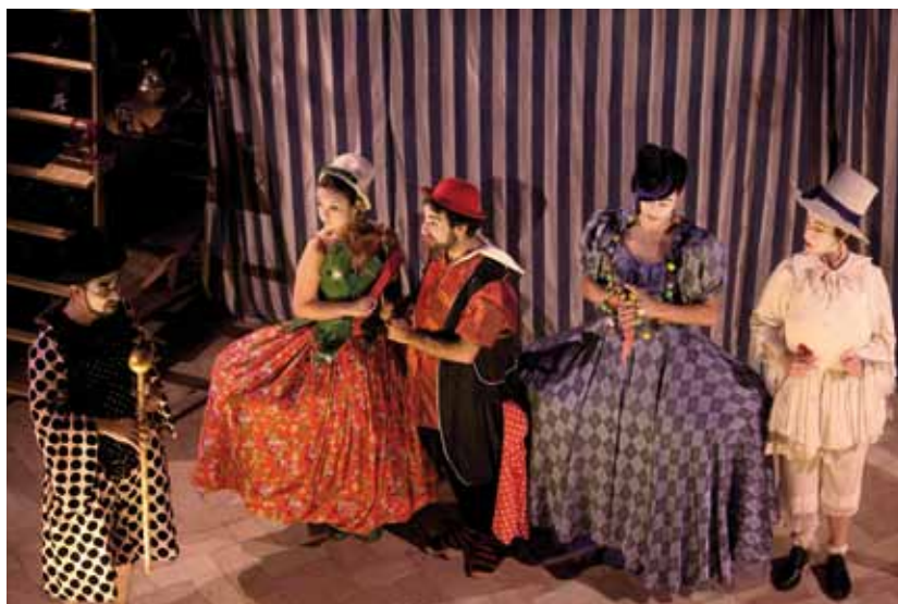
Momento de la representación de la compañía de teatro Escena Erasmus que interpretaron "El maravilloso retablo de las maravillas europeas"

Actuación de la compañía de teatro Escena Erasmus , de la Universidad de Valencia, que puso en escena el pasado 27 de julio "El maravilloso retablo de las maravillas europeas". Este espectáculo está producido por Acción Cultural Española en el marco de la iniciativa Las Huellas de la Barraca, que parte del entremés cervantino de "El Retablo de las Maravillas".