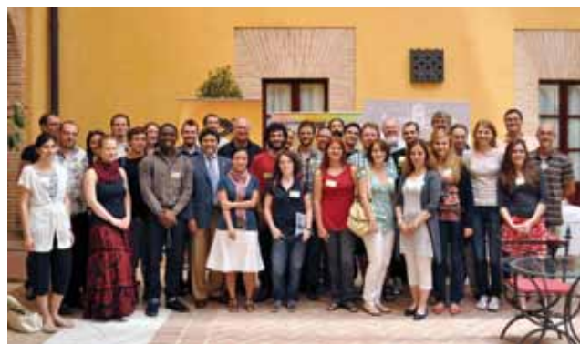
Más de 50 expertos de diferentes países asistieron al "Europe iGEM Teachers' Workshop 2011".

El Centro Olavide en Carmona mantiene su actividad académica a lo largo de todo el año, acogiendo diversas actividades formativas, como congresos, reuniones, coloquios, conferencias, seminarios, cursos de formación..., que nos indican el grado de implicación, compromiso y confianza que los miembros de la comunidad universitaria y la sociedad, en general, vienen depositando en este proyecto, que constituye una plataforma idónea para el desarrollo de actividades académicas, formativas y de extensión. De entre ellas, destacamos las siguientes: