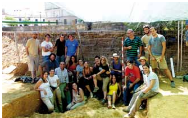
Estudiantes del seminario de excavaciones arqueológicas, en la zona de tumbas romanas próxima a la necrópolis de Carmona.

En relación a los contenidos, los alumnos/as otorgaron una valoración global de 4,19 sobre 5. Dentro de este apartado, la calidad de los participantes y docentes alcanzó la mayor puntuación, con un 4,31, seguido del interés de los temas tratados.