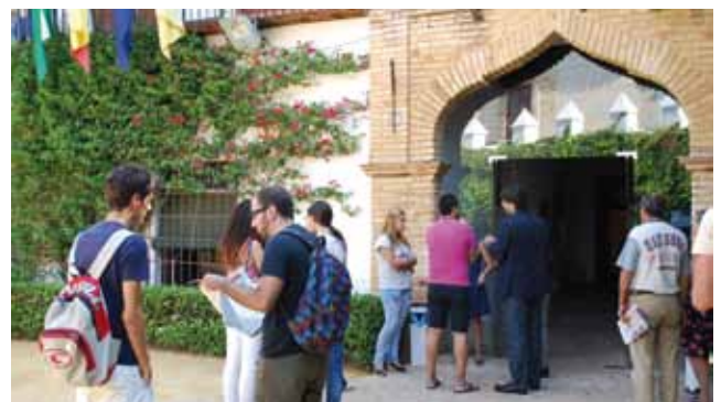
Estudiantes de los cursos de verano hacen un receso en el patio de entrada de la Casa Palacio de los Briones.