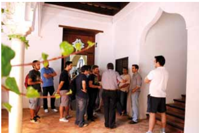
Estudiantes y responsables del curso de Alternativas a los planes de ajuste neoliberal en España y Europa.

Un total de 135 estudiantes han recibido becas oficiales de matrícula en el total de los 25 cursos celebrados. Además, a través de los diversos acuerdos y colaboraciones establecidos con las instituciones y entidades colaboradoras del programa 2011, otros 65 estudiantes se han beneficiado de matrículas gratuitas para participar en los mismos. Esto supera el porcentaje establecido por Ley, de un 10%. El porcentaje de estudiantes con beca en los cursos de verano 2011 ha superado el 27%.