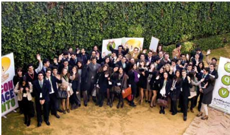
Participantes en la III Edición del Torneo Andaluz de Debate Guadalquivir.

Por otra parte, 'Olavide en Carmona' es garantía de calidad en todas las actuaciones que lleva a cabo, gracias a la implantación de sistemas y metodologías de calidad que garantizan que todas las actividades llevadas a cabo en el ámbito del mismo se realizan de acuerdo con los objetivos del Plan Estratégico de la Universidad Pablo de