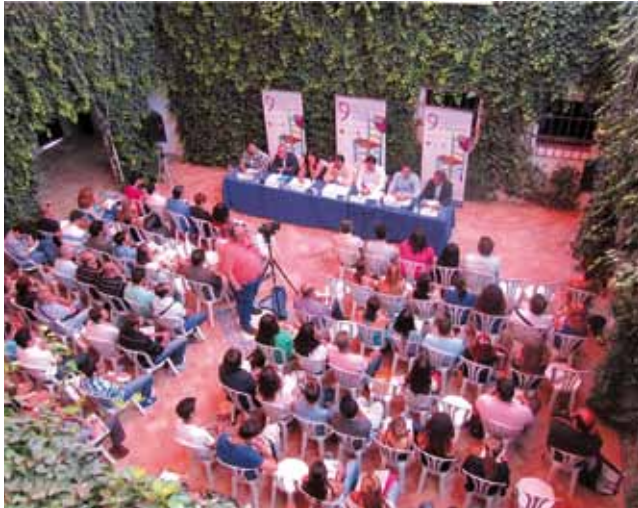
Los cursos de verano ofrecen una excelente oferta formativa.

El programa estival de la Universidad Pablo de Olavide está experimentando un proceso gradual de profesionalización, lo que está llevando a concentrar y seleccionar aún más la oferta formativa para que pueda satisfacer en su totalidad las expectativas del alumnado, cada vez más especializado. Un año más, los cursos de verano, organizados conjuntamente por la Universidad Pablo Olavide de Sevilla y el Ayuntamiento de Carmona, han ofrecido un excelente programa para los estudiantes, con unos parámetros de máxima calidad y nivel.