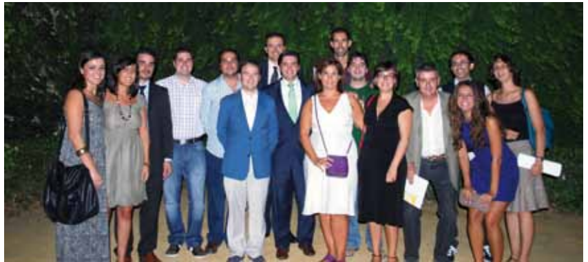
Egresados del curso de Gestión de Redes Sociales.

La EAGPA es un proyecto formativo pionero en Andalucía cuyo objetivo es dar respuesta a la demanda de formación por parte de gestores y altos directivos de organismos públicos y cargos electos que, inmersos en un mundo globalizado y cambiante, necesitan dar respuesta a los nuevos retos que aparecen en su ámbito de actuación, especialmente en el ámbito municipal.