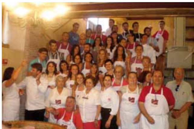
Los participantes del seminario de tapas tuvieron la oportunidad de realizar numerosas prácticas entre fogones.

La Unidad de Gestión del Centro 'Olavide en Carmona' desarrolló por séptimo año consecutivo las encuestas de evaluación de los cursos de verano 2011, con el objetivo de seguir mejorando en la calidad del servicio ofrecido a estudiantes y profesorado. En esta ocasión, el índice de participación ha sido bastante elevado, de un 75,20%, por lo que los resultados que se desprenden de su estudio y análisis son fiables y objetivos. Así, los estudiantes calificaron con su respuesta tanto la gestión como el contenido de las actividades. Asimismo, la encuesta permitió conocer el perfil de los estudiantes que se inscribieron.