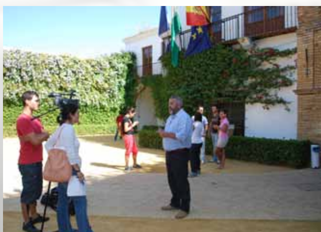
Fueron numerosos los medios de comunicación que acudieron a Olavide en Carmona durante los cursos de verano.

Los cursos de verano 2011 han estado ampliamente presentes en los medios de comunicación a través de prensa, radio y televisión locales, provinciales, autonómicos y nacionales, así como en Internet.