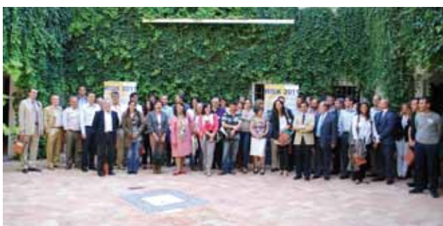
Mas de 80 profesionales de Europa y América acudieron al RISK 2011.