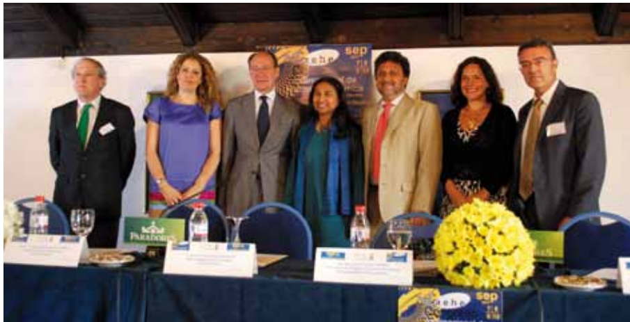
El consejero de Medio Ambiente de la Junta de Andalucía asistió a la inauguración del X Congreso Internacional de Historia Económica.

• 4 y 5 de febrero de 2011. III Reunión del Grupo de Endocrinología de la Sociedad Andaluza de Endocrinología y Nutrición (SAEN). • 14 y 15 de diciembre de 2011. Reunión preparatoria para el Congreso de la ICCN (International Conference on Cognitive Neurodynamics), que se celebrará en Carmona el próximo mes de septiembre.