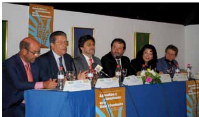
Federico Mayor Zaragoza inauguró los VIII Encuentros Sostenibles, junto al rector de la UPO y el alcalde de Carmona.