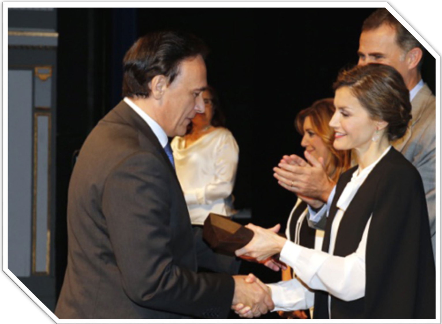
Premio Nacional de Innovación y Diseño 2015