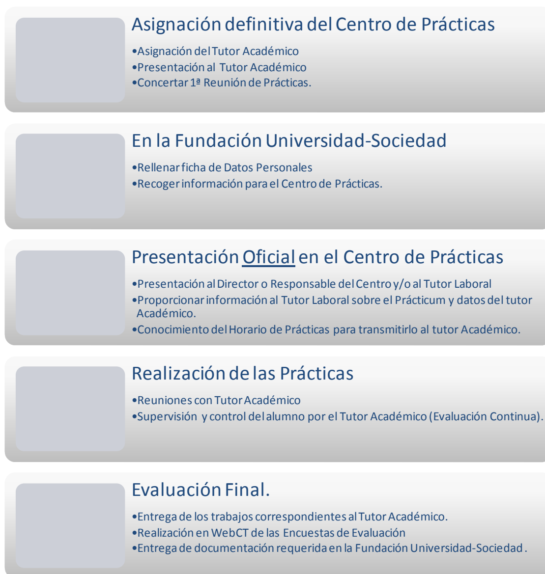
Figura 1. Esquema de la secuenciación de la actuación del alumno en el Prácticum.

Sólo una vez hayas cumplimentado estos pasos, podrás empezar tus prácticas.