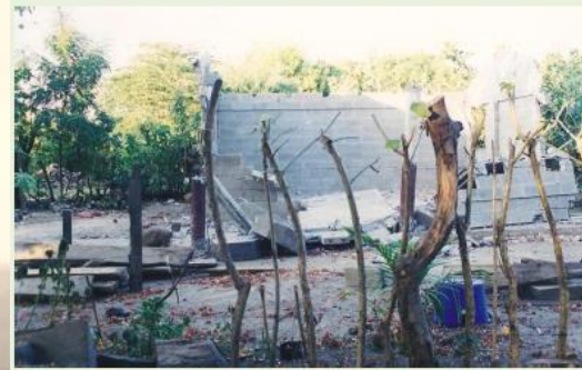
Foto II.1.1. Vivienda colapsada durante el terremoto del 13 de Enero de 2001 en el valle del Río Lempa. El Salvador.