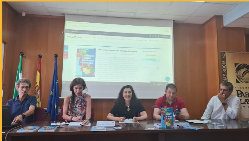
Foto: Presentación del libro "Innovación docente en tiempos de cambio"