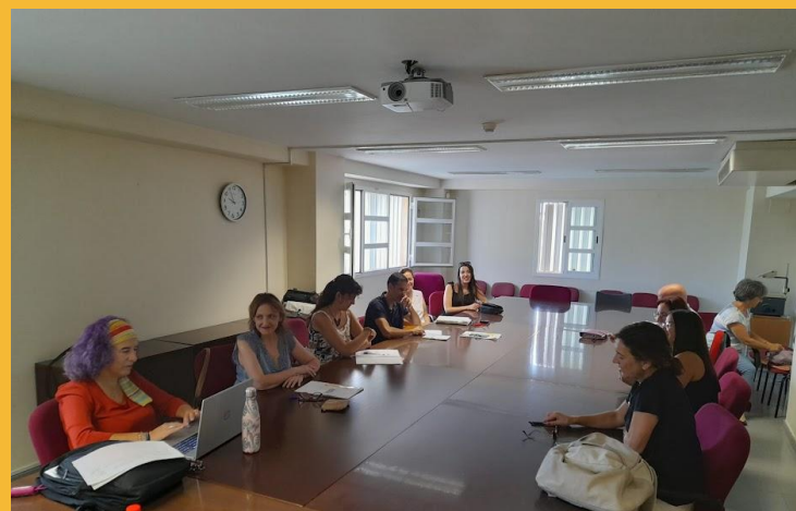
Fotos: Reuniones de coordinación docente de las titulaciones de la Facultad