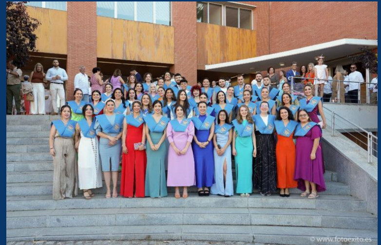
7 JUNIO 2022. Promoción 2018/2022 del Grado en Educación Social.