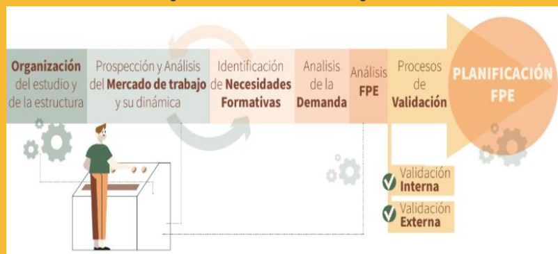
Figura 1. Secuencia metodología.

Finalmente, al objeto de integrar todos los factores clave del ámbito de estudio, se efectuó un análisis de la demanda de formación , un aspecto clave para facilitar la planificación de la formación profesional para el empleo, con una consulta a personal experto en orientación de entidades colaboradoras del SAE, del propio SAE y de centros y entidades de formación. El proceso finalizó con una doble validación, interna por parte de los equipos provinciales –en los que forman parte como miembros los agentes sociales- y otra externa con personas expertas.