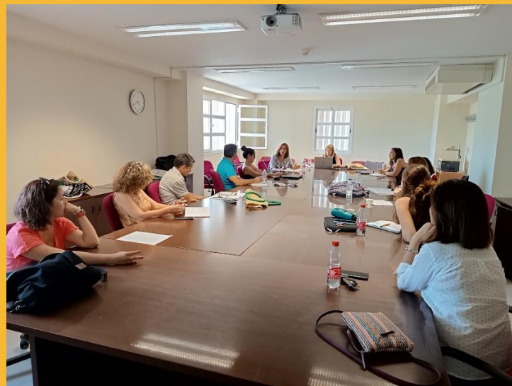
Fotos: Reuniones de coordinación docente de las titulaciones de la Facultad