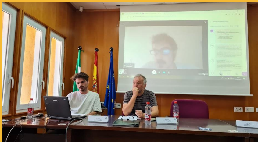
Foto: Presentación del Informe sobre presencialidad en las aulas