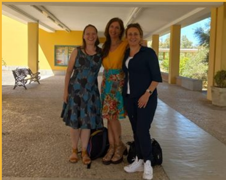
Foto tomada por estudiante anónima: profesoras de la HAN University y Vicedecana de Género, Innovación e Internacionalización.