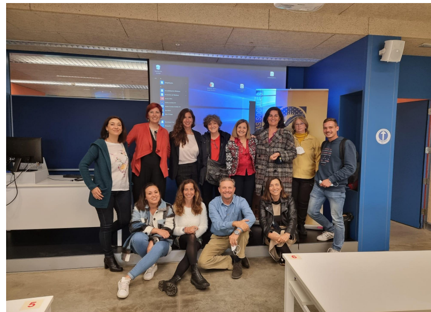
Grupo de asistentes a las VII JID de la FCCSS.

https://eventos.upo.es/78395/detail/vii-jornadas-de-innovacion-docente-2022-entrenando-la-mirada-analitica-para-la-intervencion-social.html