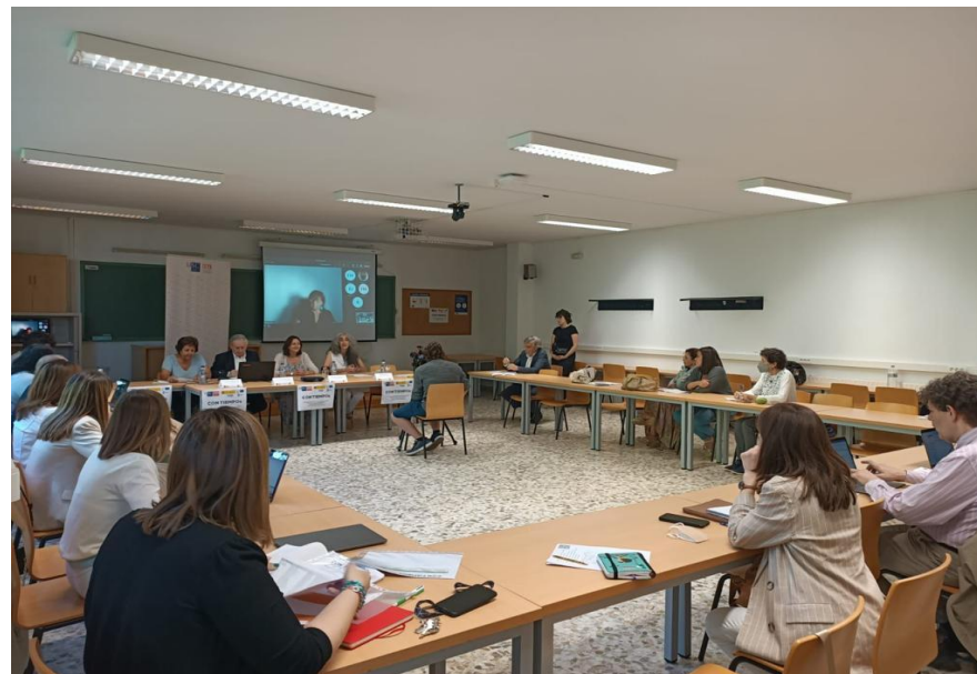
Personas investigadoras de la Red OcioGune en la reunión celebrada en la Universidad de Santiago de Compostela

Más información sobre la Red OcioGune en https://ociogune.unirioja.es/