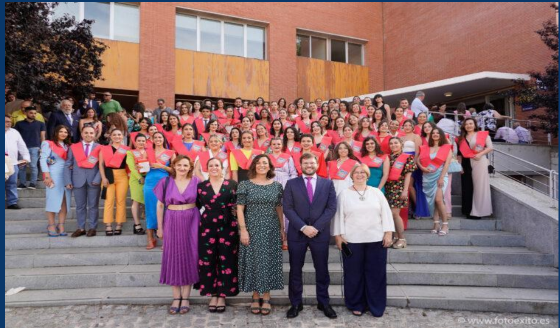
18 MAYO 2022. Promoción 2018/22 del Grado en Trabajo Social (Línea 1).

“esta crisis podrá ser un tiempo de aprendizaje y también de resolución” Martha Nussbaum