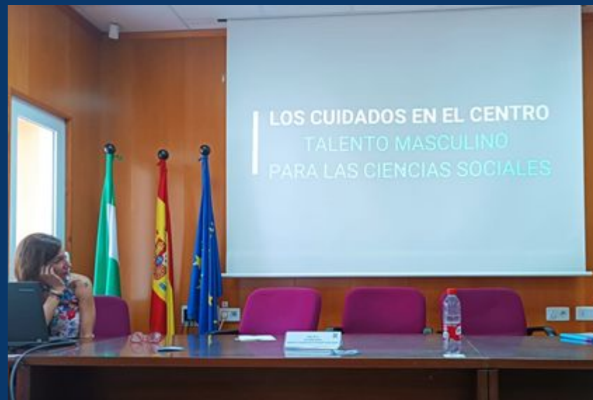
Teresa Terrón (Facultad de Ciencias Sociales)

https://upotv.upo.es/video/61bf6b69abe3c614858b456e