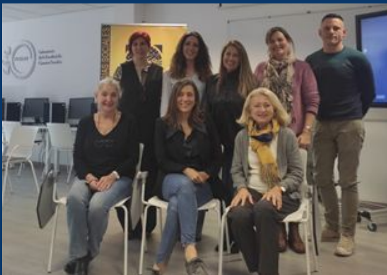
Acto de presentación Vídeo sobre mujeres investigadoras en Ciencias Sociales, 16 de febrero 2022, FCSLAB.

Con ello queremos reconocer la labor pasada e inspirar los caminos futuros.