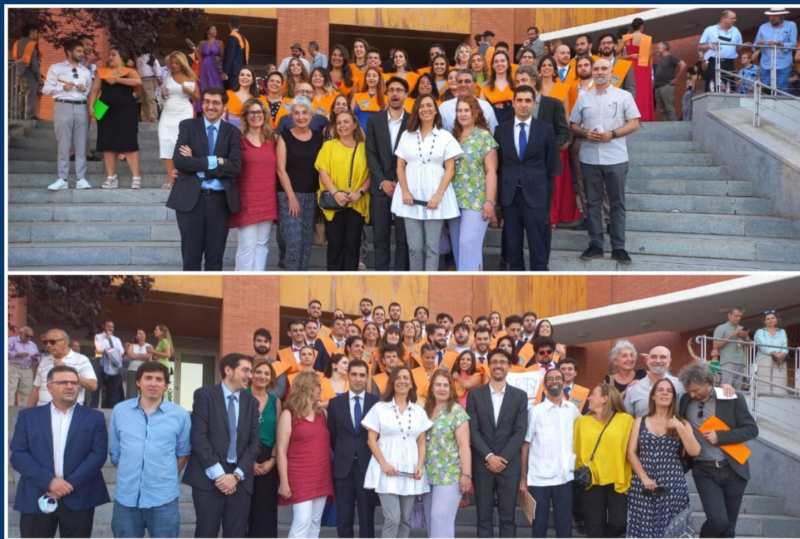
9 DE JUNIO 2022. Promoción 2018/2022 de Sociología y la promoción 2017/2022 del Doble Grado en Sociología y Ciencias Políticas y de la Administración.

Egresados y egresadas, mantened vivas vuestras ideas.