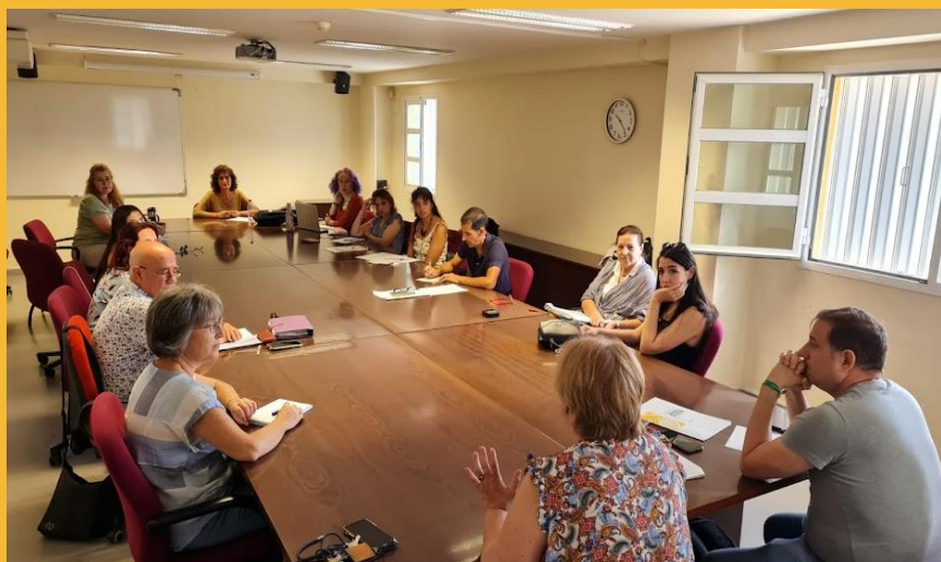
Fotos: Sesiones de diálogo y debate