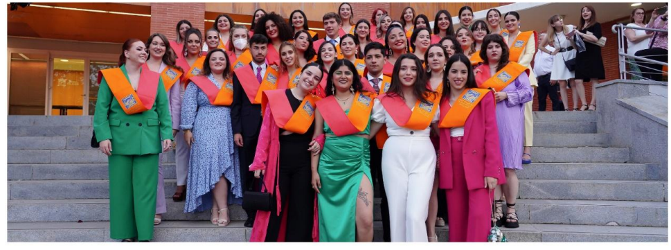
13 MAYO 2022. Promoción 2017/22 de los Doble Grados en Trabajo Social y Educación Social y en Trabajo Social y Sociología.