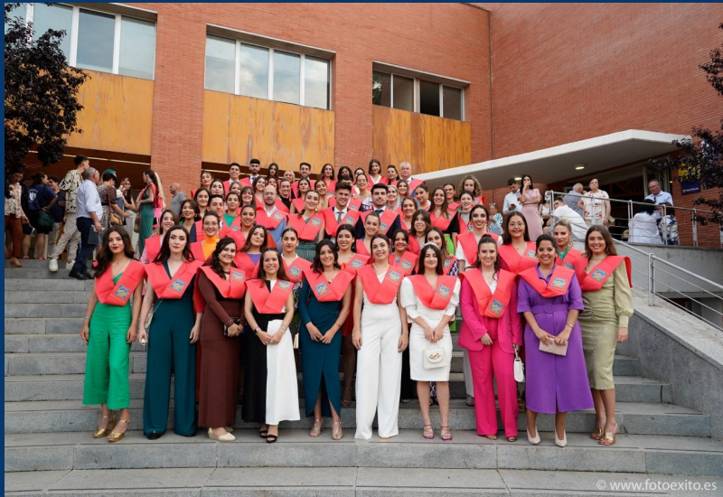
18 MAYO 2022. Promoción 2018/22 del Grado en Trabajo Social (Líneas 2 y 3).