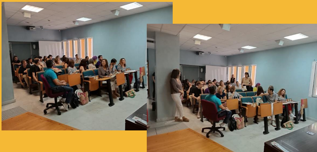
Fotos: Sesiones de diálogo y debate