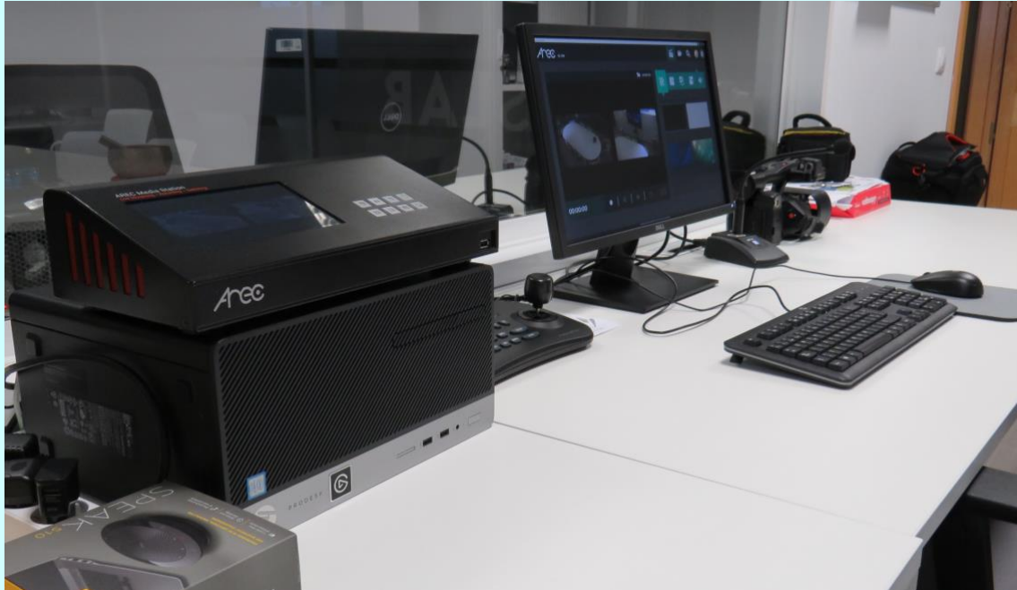
Equipo profesional de grabación y edición audiovisual.

En general, esta iniciativa puede ser de interés para todo/a estudiante que curse sus estudios en alguna de las titulaciones de la Facultad de Ciencias Sociales. El FCS-LAB cuenta con un gran potencial para la realización de tareas prácticas de curso, Trabajos Fin de Grado, propuestas de Prácticas de Campo o Externas u otros proyectos formativos asociados a la investigación e intervención social. Además, la producción de datos primarios adquiere un nivel alto de calidad gracias a los dispositivos para la recogida de audio y vídeo que se encuentran instalados en las diferentes salas, lo que facilita su posterior tratamiento analítico.