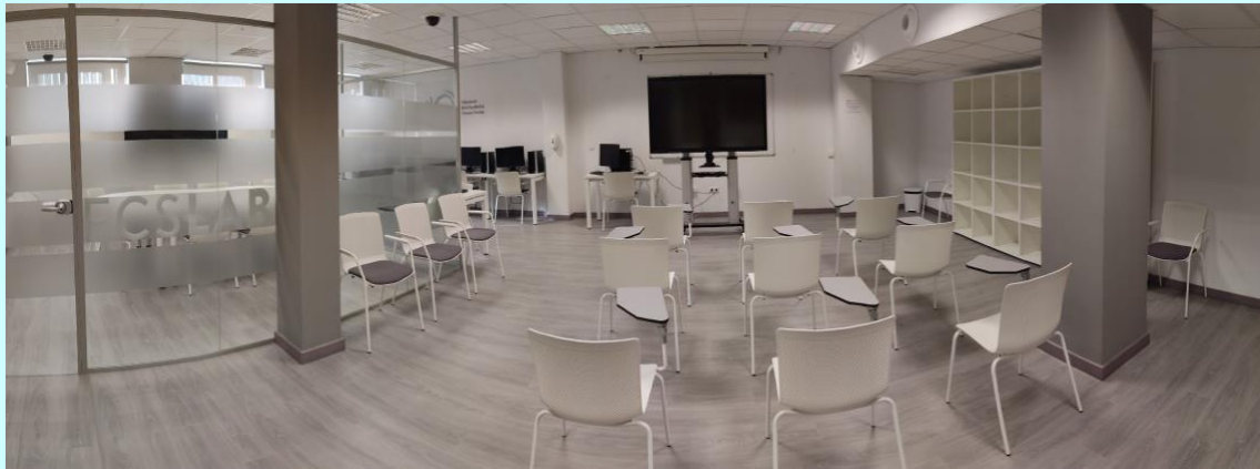
Panorámica de la Sala de Aprendizaje para la Intervención y la Investigación.