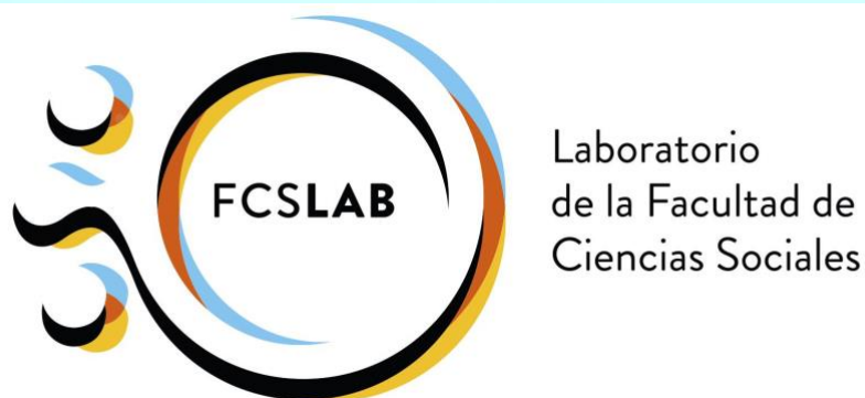
Logo oficial del Laboratorio de la Facultad de Ciencias Sociales.

La Facultad de Ciencias Sociales de la Universidad Pablo de Olavide tiene el honor de inaugurar en este curso académico tan diferente un nuevo proyecto: el Laboratorio de la Facultad de Ciencias Sociales (FCS-LAB) , situado en el edificio 24 (S.01). Primando la innovación tecnológica y académica, el laboratorio está destinado a favorecer tanto la investigación como la intervención social. De hecho, nos encontramos ante un espacio polivalente y pionero en Andalucía, ideado para la experimentalidad, el análisis de datos y la formación académica en Ciencias Sociales.