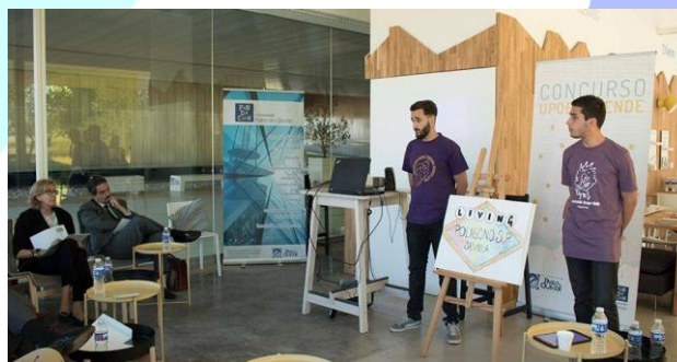
Los ganadores del concurso UPOEMPRENDE, con el proyecto "Living Polígono Sur".

También nuestro estudiantado ha destacado en el Concurso Ideas Factory en el que tres de los cuatro proyectos finalistas en la modalidad de Innovación Social contaban con participación de personal (estudiantado, egresados/as o profesorado) de la Facultad de Ciencias Sociales. El proyecto ganador, Living Polígono Sur, plantea una intervención social con jóvenes del vecindario a través de la música. Cooperativa musical dentro de los márgenes geográficos del Polígono Sur, cuya intención radica en potenciar las habilidades musicales de los/as jóvenes residentes allí e intervenir socioeducativa y socio laboralmente en ellos/as.