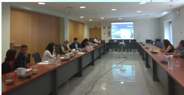
Imagen cedida para el BICEFACS. Reunión de TFG

Este año como novedad metodológica hemos introducido una Sesión Común para todo el profesorado con el objetivo de seguir reflexionando y profundizando en el análisis que hemos comenzado desde la Facultad para estudiar la carga de trabajo que supone la tutorización de TFG en todos los títulos. Dicha sesión tuvo lugar el 21 de mayo de 12:00 a 13:30 horas.