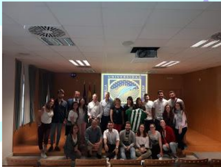
Imagen cedida para BICEFACS

Así mismo, agradecer a los responsables y personal técnico del Laboratorio Multimedia de nuestra universidad que, ante el valor socioeducativo de las imágenes tomadas han aconsejado, acompañado y colaborado en la reedición del documento aportando calidad y rigurosidad al documental.