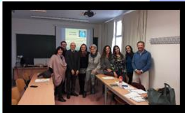
Imagen cedida para el BICEFACS