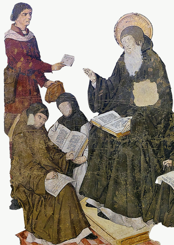
San Jerónimo dictando a las monjes (Monasterio de San Isidoro del Campo, Santiponce)

Público general. Entrada libre hasta completar aforo.