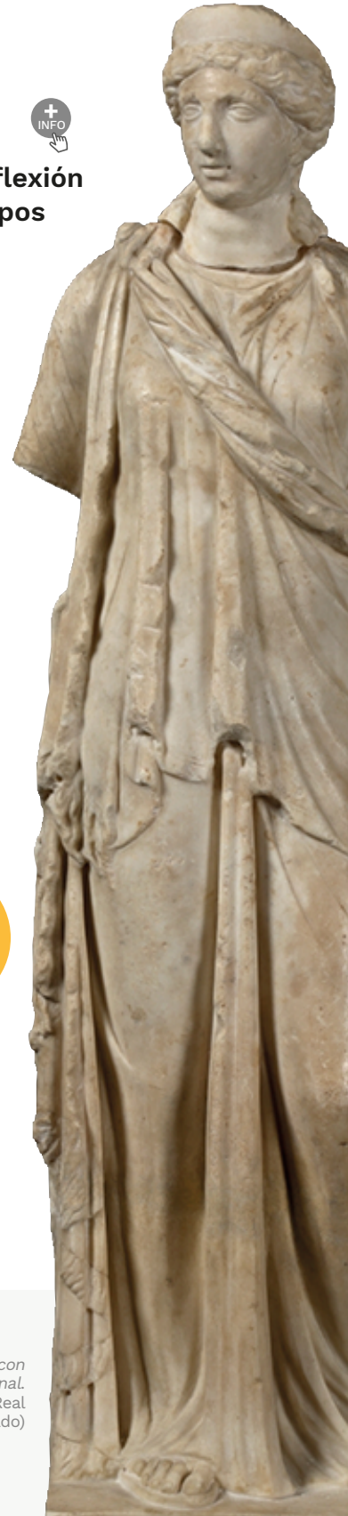
Isis con manto diagonal. Colección Real (Museo del Prado)

Actividad que se celebra en el marco del 25 aniversario de la UPO