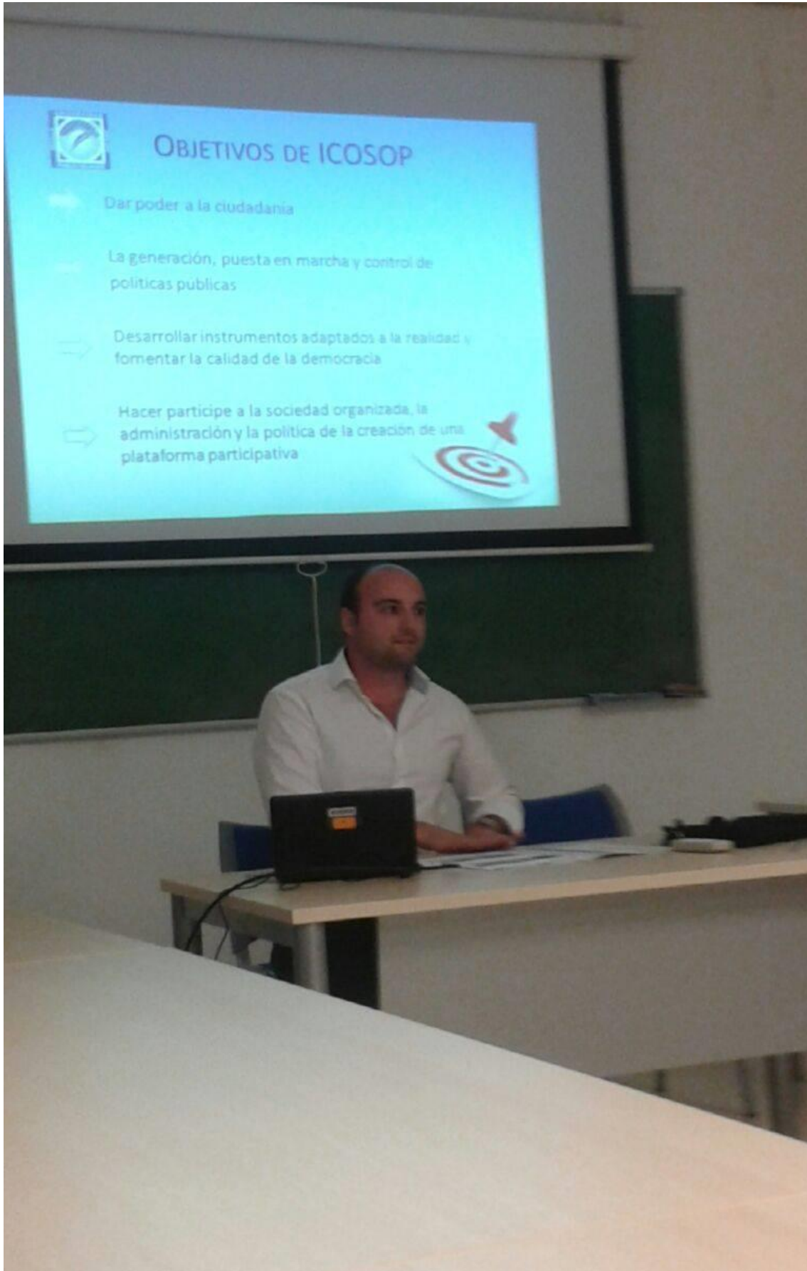
Momento de presentación de la ponencia en el congreso.