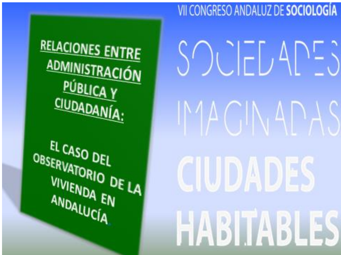
Carátula de presentación de la ponencia.

La ponencia “Relaciones entre administración pública y ciudadanía: el caso del Observatorio de la Vivienda en Andalucía”, que presenta los resultados parciales del trabajo de campo de ICOSOP, fue aceptada e incluida en el programa del congreso, dentro del grupo de trabajo 6: problemas sociales y políticas públicas, cuyo programa completo, incluida la publicación de la ponencia, puede consultarse en http://www.congresosociologiamalaga.com/programa.pdf Una representación del grupo de investigación se desplazó a Málaga entre los días 6 y 8 de noviembre para llevar a cabo la exposición.