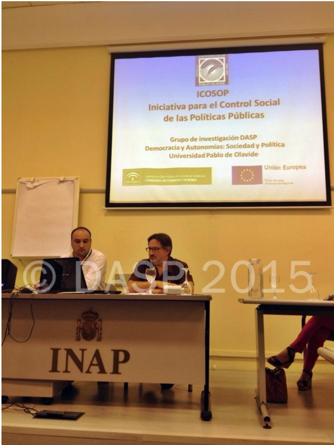
Momento de la presentación de la ponencia en el congreso.