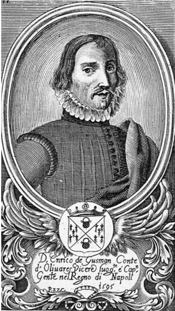
Enrique de Guzmán por Anónimo italiano siglo XVII-Biblioteca Nacional de España licencia bajo CC BY-SA 4.0.

reliquias gracias a sus conexiones con diversos papas. Fue embajador en Roma y Consejero de Estado del rey Felipe II.