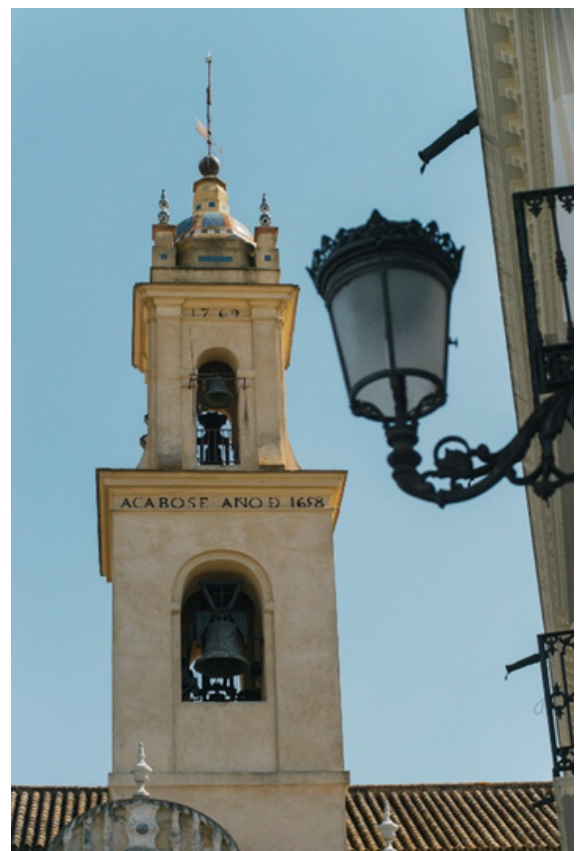
Torre de la Colegiata de Santa María de las Nieves, Prodetur

En primer lugar, destaca la cubierta de la cúpula del crucero, a cuatro aguas, visible desde la calle, además de la torre del campanario, hecha en dos fases distintas. La primera acabada en 1658 y la segunda en 1769, y más tarde reformada tras la declaración de la Colegiata como Monumento Histórico Artístico Nacional. En su exterior se puede ver las inscripciones de cuándo fueron acabadas cada una de estas fases.