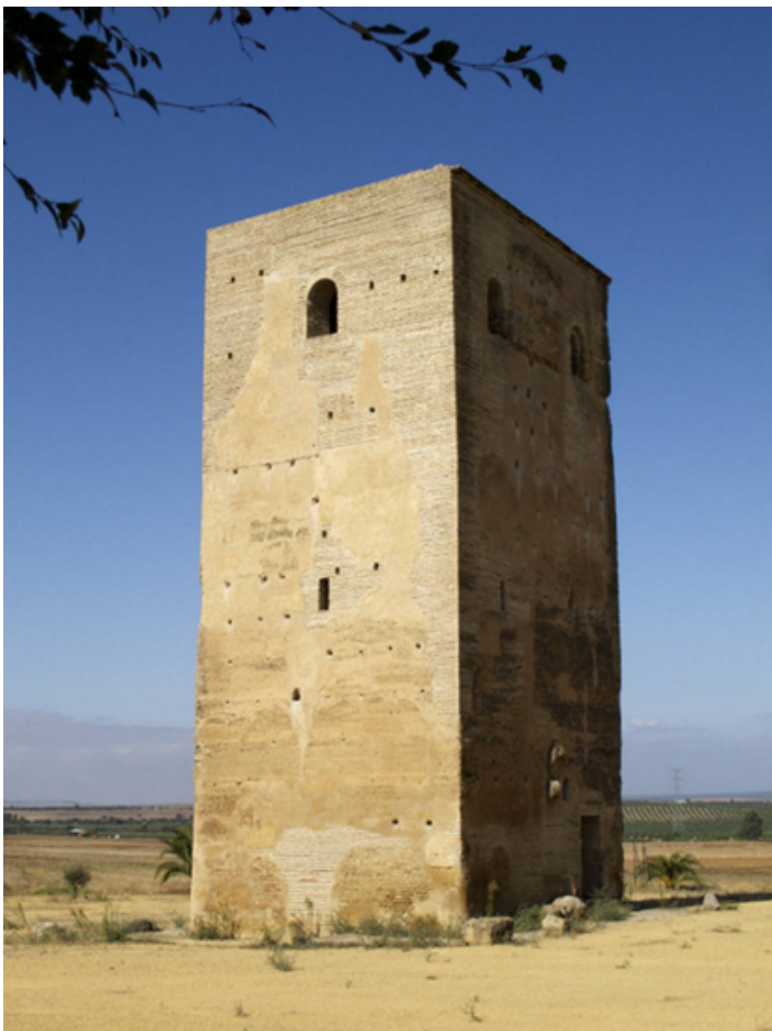
Torre de San Antonio

proveniente de un militar, y que más tarde evolucionaría a Estercolines, al ser el basurero de los pueblos adyacentes. Los primeros registros que se tienen de esta localidad se remontan al año 1294, en un documento de repartimiento de tierras. Antes de eso, estas tierras ya estaban cultivadas sobre todo de olivos, aunque los romanos intensificaron su explotación. El cambio de nombre a Olivares seguramente se debiera a la familia de los Guzmanes, quienes heredaron la tierra y vieron necesario dicha transformación. Más tarde, el pueblo, al igual que el resto de Andalucía, cayó en manos de los musulmanes, de cuya ocupación quedan restos en pie, como la Torre de San Antonio, en la actual carretera Olivares-Gerena, una torre de defensa del siglo XI.