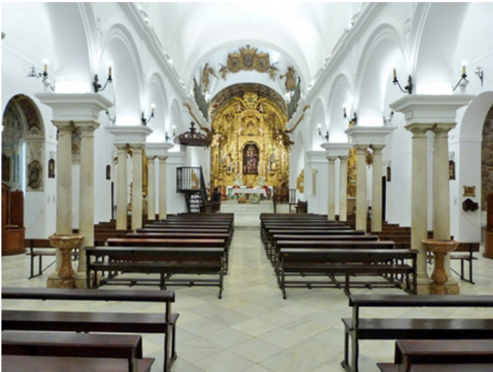
Retablo y altar mayor de la Colegiata de Nuestra Señora de las Nieves de Olivares, Diario de Sevilla

En 1680 se terminó de construir la capilla mayor de la Colegiata, que fue progresivamente ampliada en las capillas del sagrario, el trascoro y la cúpula.