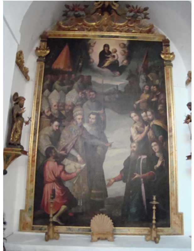
Aparición de la Virgen de las Nieves en el Monte Esquilino, Juan de Roelas

La imagen de la Virgen se usó como reemplazo del lienzo de Juan de Roelas de la Aparición de la Virgen de las Nieves en el Monte Esquilino , que se cambió hacia el siglo XVII. El lienzo fue trasladado a la Capilla de la Santa Vera-Cruz por un tiempo hasta que volvió al altar anterior a la sacristía de la Colegiata. Igualmente, también existe en su interior un retablo con la talla de la antigua Virgen del Álamo, datada del XIV.