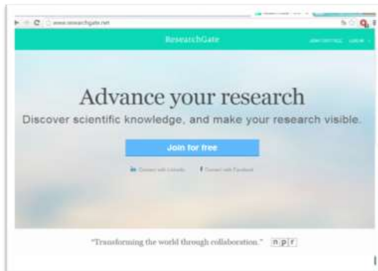
Figura.1. Pantalla Principal de red social científica Researchgate.