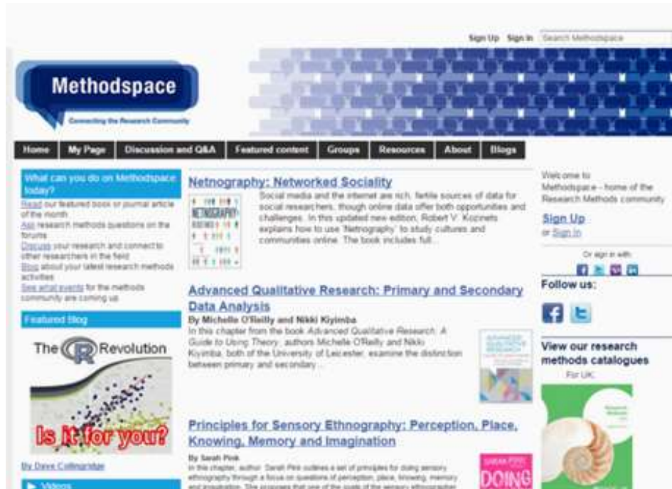
Figura 3. Pantalla principal red social científica Methodspace

Dirección electrónica: http://www.methodspace.com/