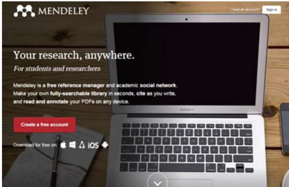
Figura.4. Pantalla principal red social científica Mendeley

Dirección electrónica: https://www.mendeley.com/