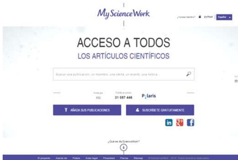
Figura. 6. Pantalla principal red social científica MyScienceWork.

Dirección electrónica: https://www.mysciencework.com/