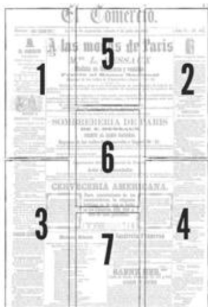
Figura n.º 1. Posiciones en la página de un periódico.