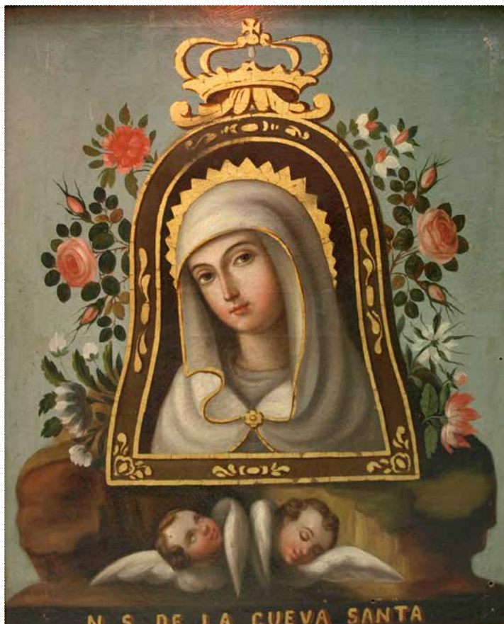
Figura 4. Anónimo: Nuestra Señora de la Cueva Santa (Museo Alberto Mena Caamaño, siglo XIX)