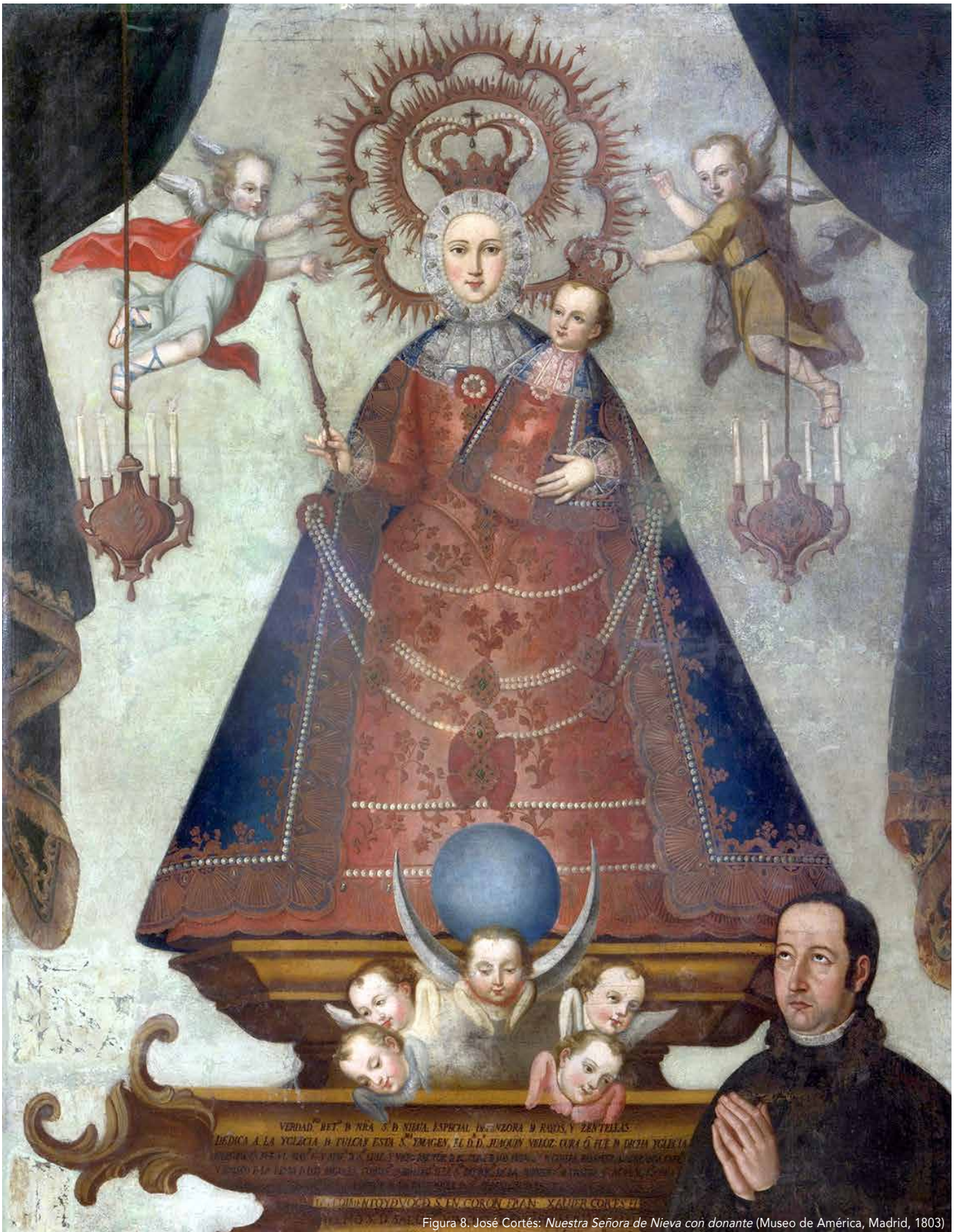
Figura 8. José Cortés: Nuestra Señora de Nieva con donante (Museo de América, Madrid, 1803)