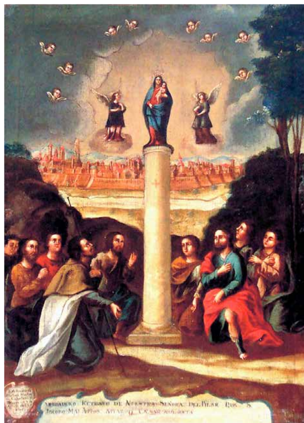
Figuras 1 y 2. Anónimo: Virgen del Pilar (s. XVIII), y Cayetano Toro: Virgen del Pilar (BCE, Guayaquil, 1767)