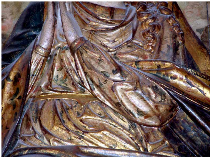
Fig.2. Retablo de la Asunción de la Virgen. Catedral de Sevilla. Rasgos representativos de la policromía de la época: fondos pictóricos, oro molido en cabellos y decoración de los ropajes que imitan el bordado de punto matizado.

que de nuevo se hace y de otros dos retablos de los altares colaterales que arriman al arco toral de la yglesia y las pinturas y dorados y frisos... 17 . Andrés de Ocampo se encargó de las obras de talla y ensamblaje, que debía finalizar en febrero de 1593, mientras que Vázquez concluiría la policromía para el Jueves Santo del mismo año. El documento de condiciones aporta importante información, con una descripción técnica amplia y minuciosa 18 . Así se comprometía “el tal maestro pintor ha de dorar de oro bruñido muy bueno todo el retablo nuevo y lo que fuere talla en el que se hace para el altar mayor [...] y asimismo ha de dorar de muy buen oro bruñido fino todo el sagrario por dentro y fuera y puertas del asimismo por dentro y por fuera el cual sagrario es nuevo”.