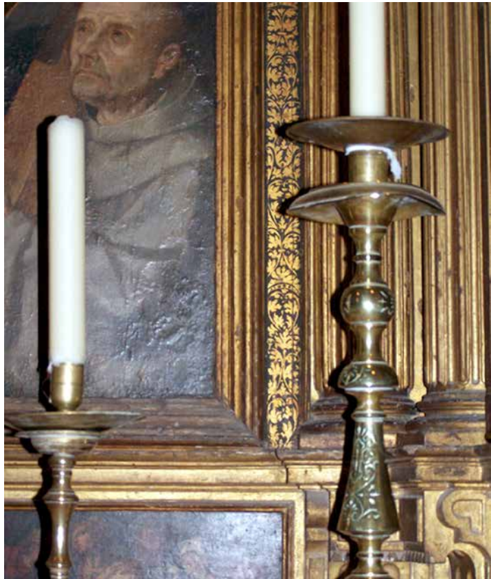
Fig. 1. Retablo de la Asunción de la Virgen. Catedral de Sevilla. Decoración esgrafiada de la arquitectura, característica del último cuarto del s. XVI.

de la Santísima Trinidad del Monasterio de Santas Justa y Rufina de Sevilla, de 1601, se encuentra el color en la arquitectura (que comienza en estos años a eliminarse), y la diferencia del color de las encarnaciones según sexo y edad, anticipo de las características barrocas: “de muy limpio oro fino, lustroso [...] bruñido y sin mancha” ; “(las columnas) an de yr revestidas desde la basa hasta el capitel de varios grutescos” 13 ; “(encarnaciones) al pulimento haciendo las diferencias de carnes conforme a las edades y sujetos de las figuras” 14 . Curiosos son los datos que se recogen en el documento de la “restauración” de la Iglesia Conventual de Santa Paula de 1592, que se comentará más adelante, donde aparecen muy diversas técnicas de decoración pictórica, demostrando la profesionalidad y experiencia del artista. La obra policroma documentada es extensa, aunque se contraponen con el escaso número conservado de las mismas 15 .