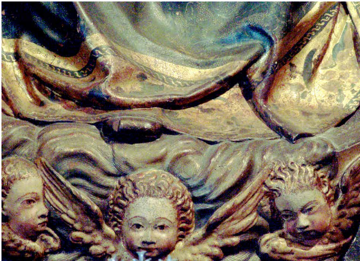
Fig. 6. Relieve de la Asunción de la Virgen. Catedral de Sevilla. La cenefa presenta los mismos elementos decorativos, así como la disposición de ribetes con decoración en "z" y ojeteado menudo, características habituales del artista.

(simulación y destreza) y la "discreción" (moderación en la elección y utilización de la decoración): "todos los ropajes de las historias y de las figuras después de doradas sean estofado sobre el oro grutescos y esgrafiados a punta de garfio [...] que cubran el oro con mucho artificio y discreción" . Se entrevé la decoración ya de comienzos del siglo XVII, en detrimento de los paños mayormente dorados, y con decoración en color sólo en cenefas, de los años finales del XVI. La utilización de modelos reales de textiles para la elaboración de los tejidos policromados, iniciados a mediados del s.XVI y generalizados en el XVII, se hace patente cuando indica "a punta de pincel y descubierto el oro a punta de garfio con diferentes labores y telas que parezcan brocados y telas de oro" .