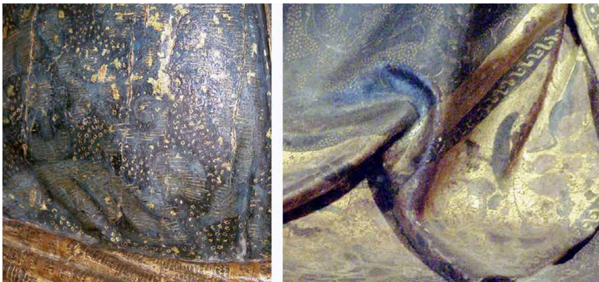
Fig. 4. Derecha. Detalle del ropaje de San Cristóbal. Iglesia Parroquial del Salvador. Sevilla. Izquierda. Detalle del ropaje de la Virgen de la Asunción. Catedral de Sevilla. En ambas obras se aprecia la decoración imitando tela de damasco en tonos azules, incluyendo un ojeteado muy menudo, casi punteado, característico de Alonso Vázquez.

La vocación por la pintura se advierte, asimismo, por la consideración y respeto hacia otros artistas y calidad de las obras. No se ha encontrado, en ningún pintor estudiado hasta el momento, el deferencia hacia una obra ajena (en cuanto a documentación contractual), comprometiéndose también a intervenir en el “un San José durmiendo que es un cuadro de mano de micer jacome que es de gran estima y mano lo ha de limpiar con mucha discreción sin hacer daño a ninguna cosa de él” .