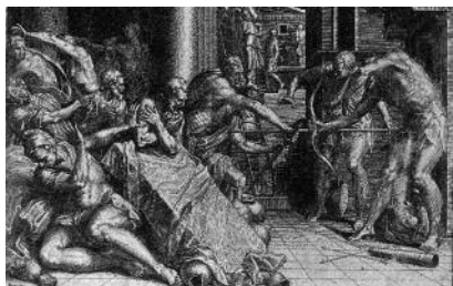
Anónimo según Primaticcio: Ulises disparando a los pretendientes .

tabla pintada por ambas faces también sugiere un tabernáculo con puertas de dimensiones modestas 66 ; por estas razones nos inclinamos a pensar que pudieron formar parte de cualquier otro altar pintado en ese recinto por Antonio de Alfían por las mismas fechas en que trabajaba en el retablo mayor del convento.