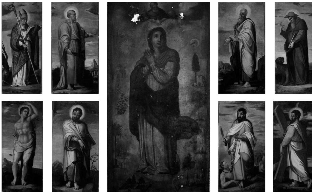
Antonio de Alfián: Inmaculada y santos . Sevilla, Parroquia de Santa Ana.

Quizá el alcance estético de la pintura de Alfián no iguale al de los artistas de primera fila en el panorama pictórico español del Quinientos, y ni siquiera en el hispalense, pero sí representó un papel de gran relevancia en la economía artística y en la producción de imágenes en el ámbito de la ciudad y su extenso arzobispado. Disfrutando de una de las trayectorias vitales más prolongadas entre los pintores de su siglo y una actividad incesante durante 60 años, desde su primera noticia por ahora conocida en 1539 9 hasta 1601, cuando Pacheco y Diego Gómez, que se hacían cargo de una obra concertada por Alfián con anterioridad, lo declaran “tan viejo que ya no pinta” 10 , su nombre es uno de los más recurrentes en los archivos hispalenses de la segunda mitad de la centuria, interviniendo en un sinfín de obras de toda índole: pintura de lienzos y guadamecés, retablos, pintura mural, dorado y policromía de altares e imágenes... En el campo de la retablistica, que constituye la parte del león de su producción, intervino en no menos de cincuenta y cinco retablos o tabernáculos, solo o en colaboración con otros pintores, un número que probablemente no tiene paralelo en ningún otro pintor de su siglo en la ciudad. No hay duda de que, antes de la alusión de Pacheco y Gómez, Antonio de Alfián pintó mucho, e intensivamente, en Sevilla.