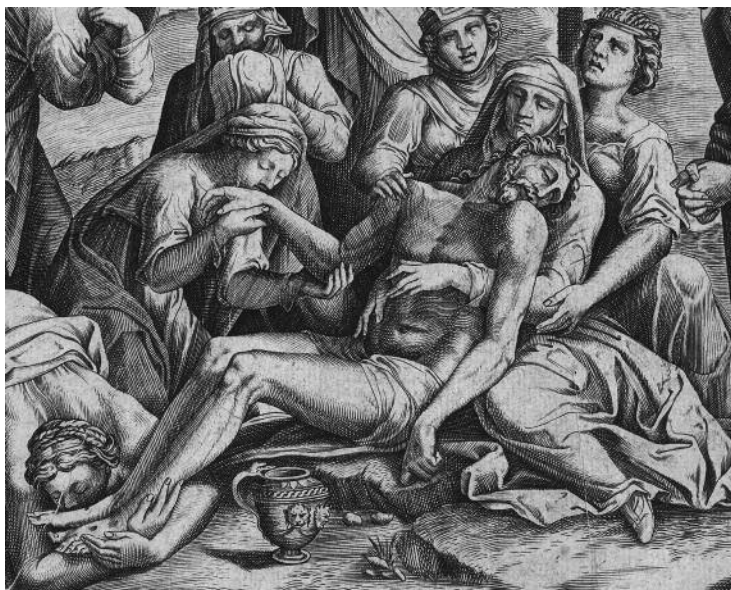
Cornelis Bos según Lambert Lombard: Piedad . (detalle)

para el tablero principal, más un remate posiblemente de medio punto adaptado al arco que debía abrir Cristóbal de Salas, y cuatro calles más estrechas en los laterales, a su vez subdivididas en dos cuerpos, pero desconocemos la tipología de los soportes que, si se pretendió seguir el modelo del retablo de Vega y Esturmio y hacemos caso al testimonio posterior de Matute, que comparó su talla con la del retablo mayor de la iglesia 23 , debieron ser probablemente balaustres o columnas retalladas, en ambos casos elementos arcaizantes en la retablística sevillana del momento. Tampoco podemos estar seguros de la ubicación concreta de cada una de las tablas con santos de las calles laterales, excepto por la dirección del movimiento y las miradas que permiten deducir de una forma general cuales de entre