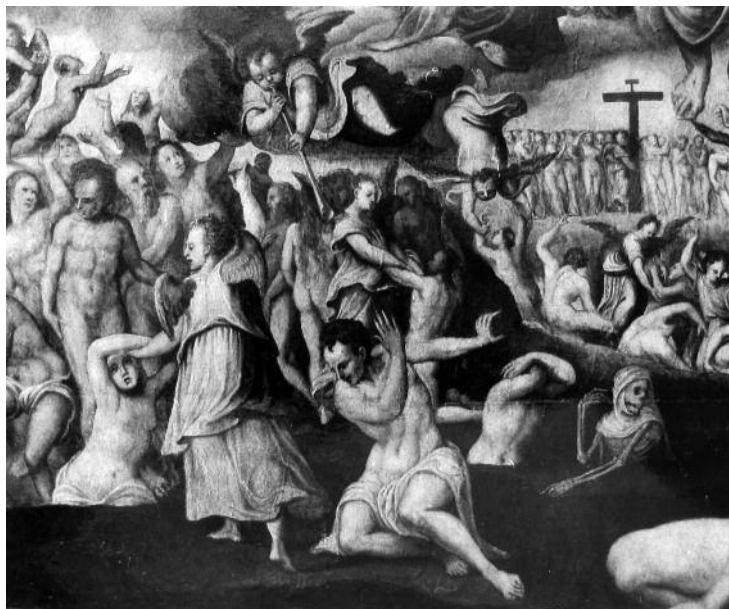
Antonio de Alfían: Juicio Final (detalle), propiedad privada.

De vuelta con Alfían y su Juicio Final , las dimensiones y formato de la pintura permiten deducir que se trata del remate de un retablo de tamaño medio, como ya apuntó Inmaculada Rodríguez Aguilar 69 , similar a la composición que coronaba el que ya pintara el mismo artista en el conjunto concertado el 18 de junio de 1546 junto con Alonso de Solís para la capilla del mercader Francisco de Salamanca en el monasterio de San Francisco de Sevilla 70 . En ambos casos las exigencias del tema le llevarían a enfrentarse con las composiciones más complejas y multitudinarias de toda