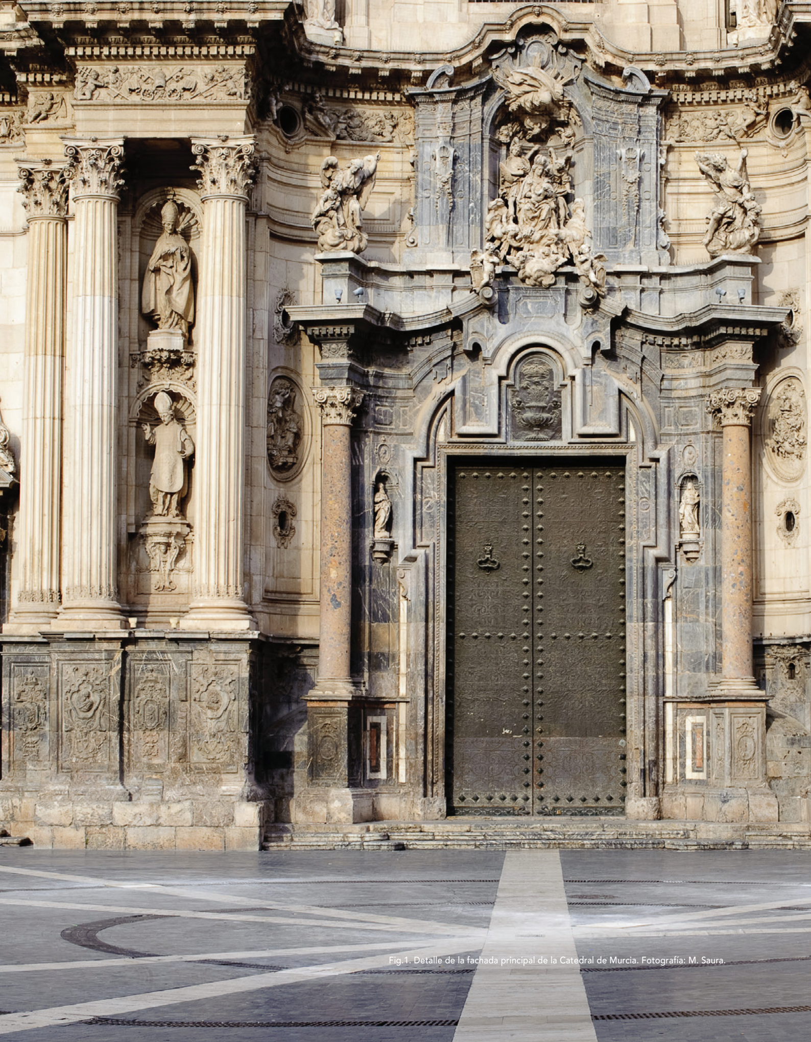
Fig.1. Detalle de la fachada principal de la Catedral de Murcia.