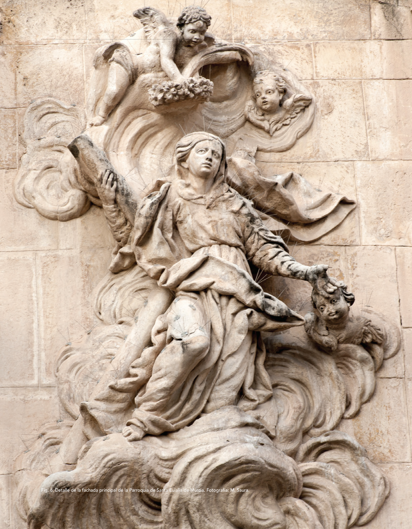
Fig. 6. Detalle de la fachada principal de la Parroquia de Santa Eulalia de Murcia.