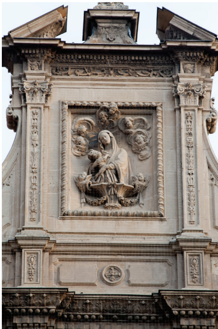
Fig. 5. Relieve de la Virgen de la Leche , Pedro Pérez. Fachada de Cadenas de la Catedral de Murcia.