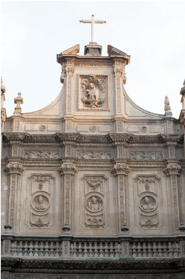
Fig. 4. Detalle de la fachada de Cadenas de la Catedral de Murcia.