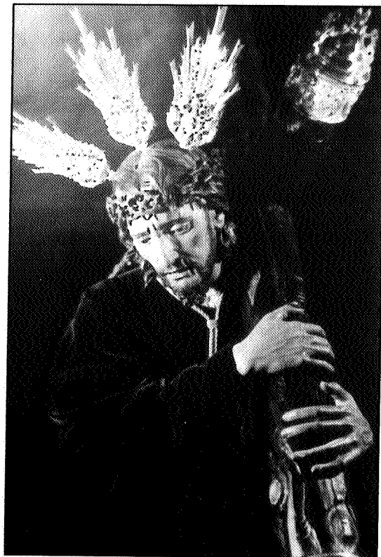
Nuestro Padre Jesús del Gran Poder de la localidad sevillana de Camas. Aspecto original que ofrecía tras su realización en 1.923.

del Nazareno, concretamente al eliminar un mechón de cabello que caía sobre la frente por encima de la corona de espinas tallada, siendo ésta igualmente sustituida por otra de mayor tamaño. También se le suprimió una de las guedejas de cabello de su lado derecho y por último se acentuó la policromía de ojos y pómulos así como también se le aumentó la cantidad de sangre, anteriormente casi inexistente dando un resultado más duro y realista que el de su policromía original de carácter más clasicista y sereno. 23