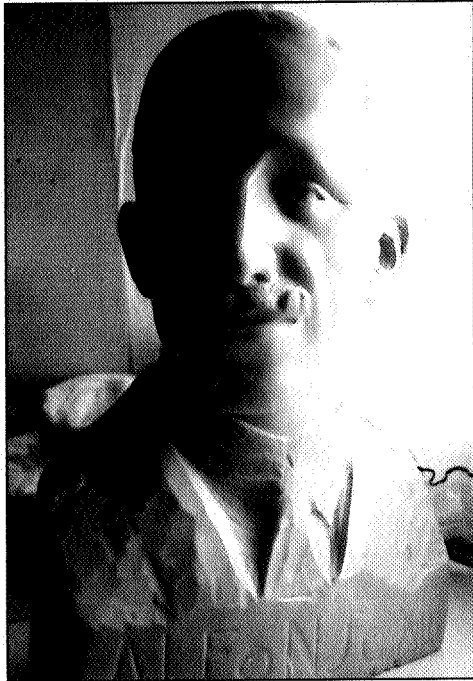
Busto del Rey Alfonso XIII. Obra realizada en 1929

rado de la Universidad hispalense, desconocemos si se realizó, en su origen, para dicha institución o por el contrario fue trasladada posteriormente.