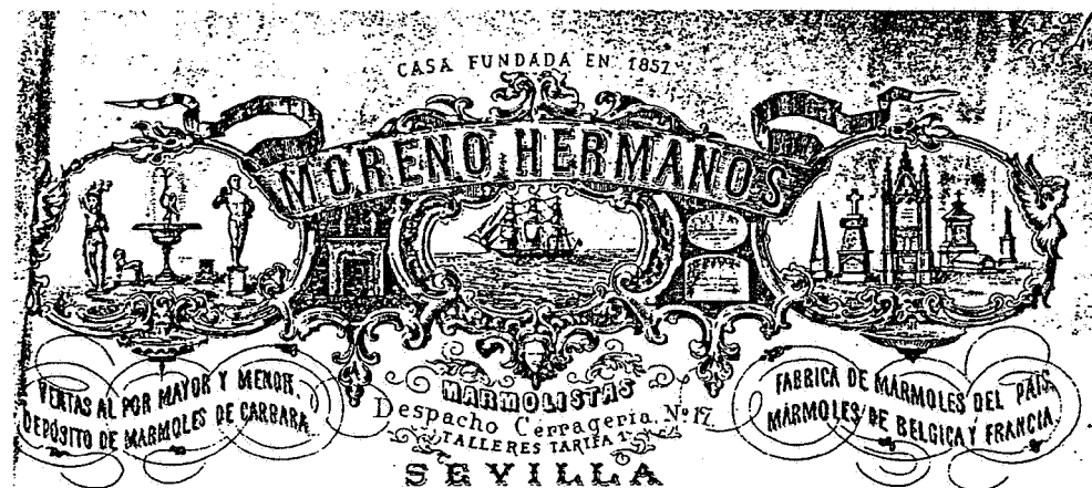
Fig. nº 3

Figuras números 1, 2 y 3: Membretes utilizados en las facturas de diversos talleres que sirvieron a la obra escultórica de la Portada Principal.