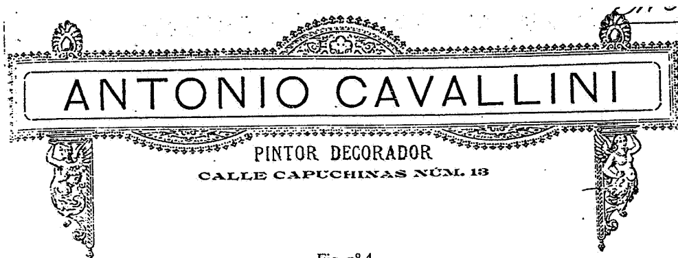
Fig. nº 4