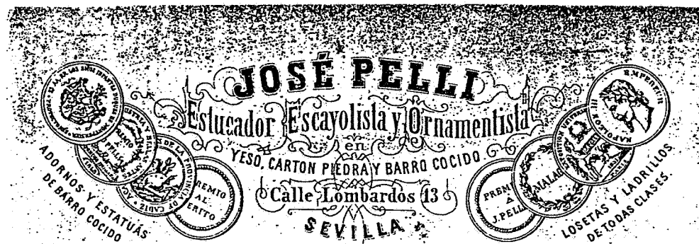
Fig. nº 1