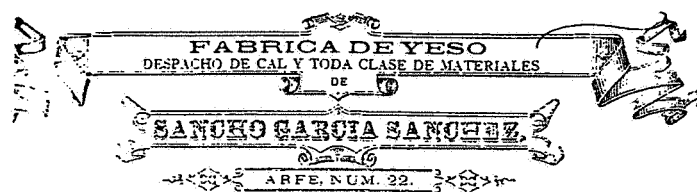
Fig. nº 2