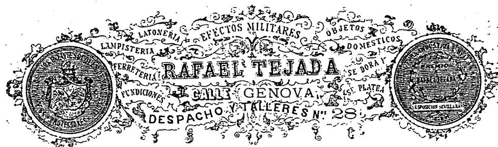
Fig. nº 6

Figuras números 4, 5 y 6: Membretes utilizados en las facturas de diversos talleres que sirvieron a la obra escultórica de la Portada Principal.