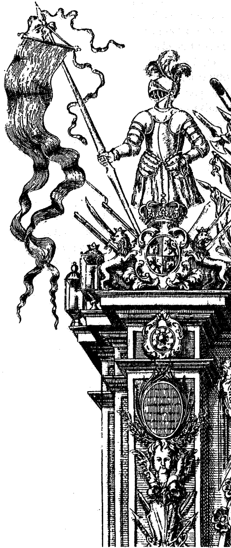
Figura 3. Detalle.

tado, en pinturas, las figuras de dos Infantas que formaban parte del cortejo, junto con dos tarjetas en las que se incluyeron en una,