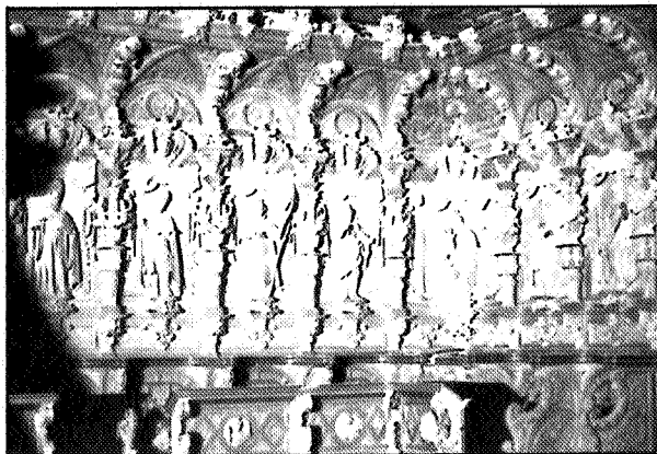
Sillería coral de la Iglesia de San Juan Bautista (Marchena).