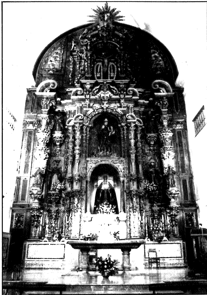
Retablo mayor del Oratorio de San Felipe Neri. Actualmente en la Iglesia de San Antonio de Pauda (Sevilla)