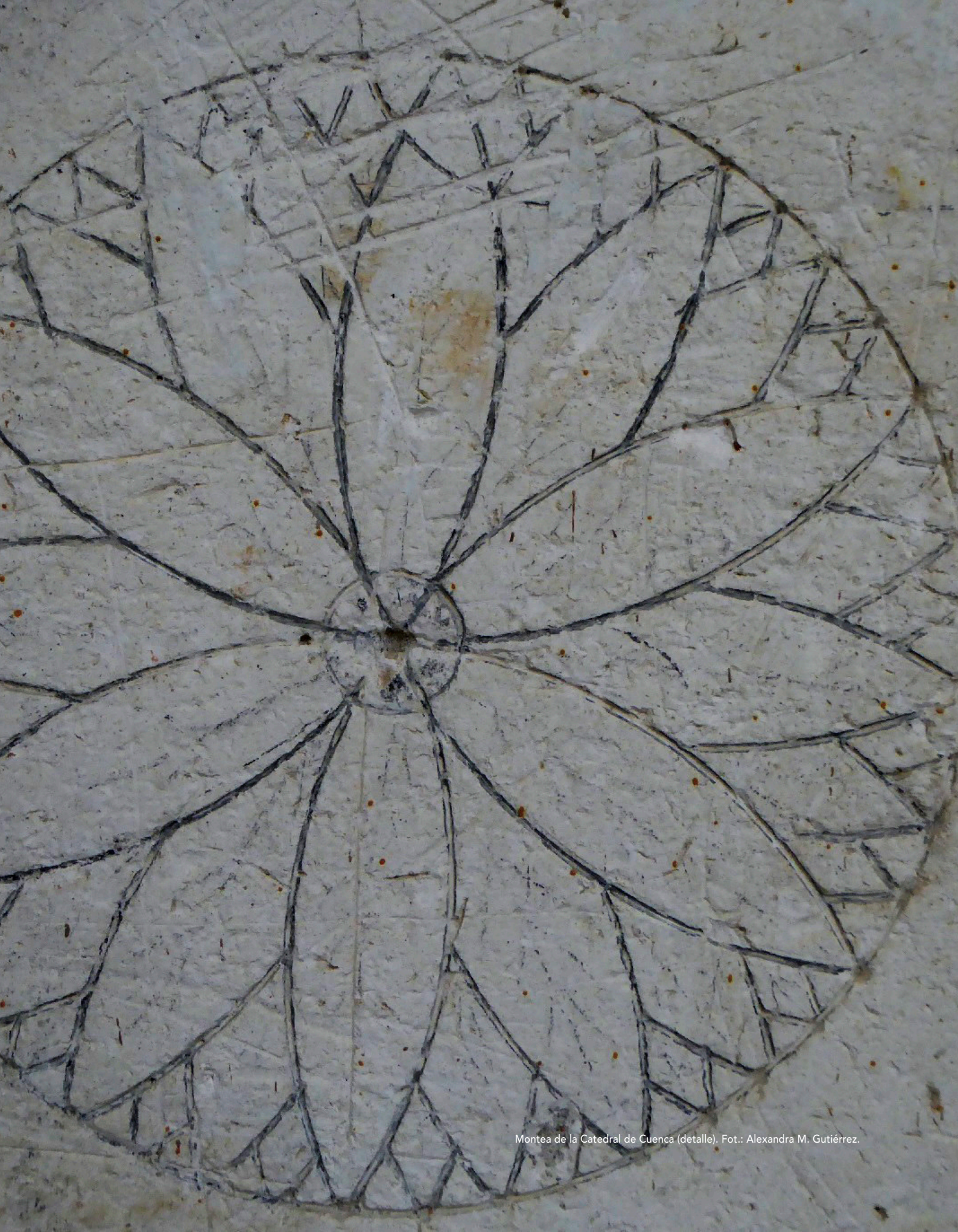
Montea de la Catedral de Cuenca (detalle).