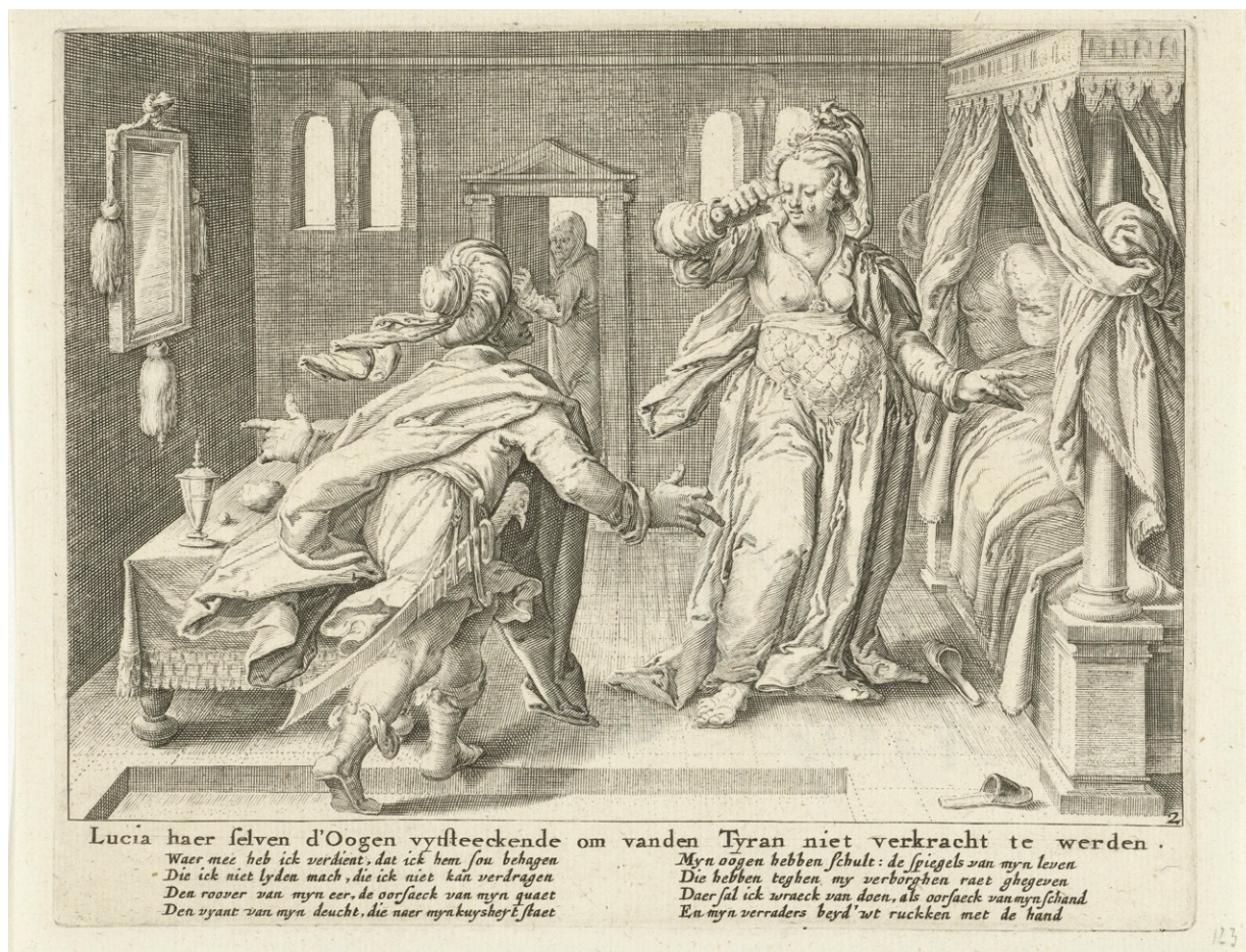
Fig. 10. Zacharias Dolendo a partir de Jacob de Gheyn, Lucia steekt haar ogen uit , Leiden, 1606. Grabado, 142 x 175 mm. Rijksmuseum, Países Bajos.

elaboró? Aunque no es posible dar una respuesta certera a esta cuestión, queda claro que nos encontramos ante un ejemplo único de esta simbiosis iconográfica profundamente arraigada en el imaginario de la vida de la mártir y sus devotos, quizá la única escultura sobreviviente de la censura en territorio novohispano.