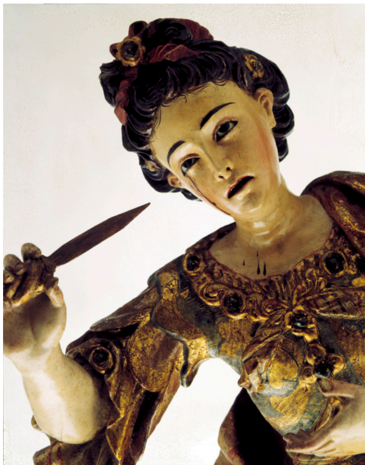
Fig. 3. Autor desconocido, Santa Lucía (detalle) , siglo XVIII. Madera tallada, dorada, policromada y estofada. Colección Museo Franz Mayer, Ciudad de México. (Fotografía del Museo Franz Mayer).

pección física de las obras y la búsqueda de fuentes visuales y escritas para el desarrollo iconográfico de las santas. El punto de partida fueron las fichas catalográficas de control de obra del museo, pues siendo las herramientas de registro de la institución que las resguarda, permitieron conocer de primera mano los datos generales de cada escultura, así como los comentarios realizados por los especialistas involucrados en su catalogación. 6 Por otro lado, aunque las obras no se encuentran en la exposición permanente, sí han sido sujetas de varias menciones en publicaciones impresas, por lo que resultó imperativa la revisión de dichos artículos para conocer las aproximaciones a partir de las cuales se han estudiado. De igual forma, el trabajo directo con una de las tallas fue imprescindible para la identificación de los rasgos relativos a su sistema constructivo, los motivos ornamentales de los estofados y policromías, así como las particularidades iconográficas de su representación.