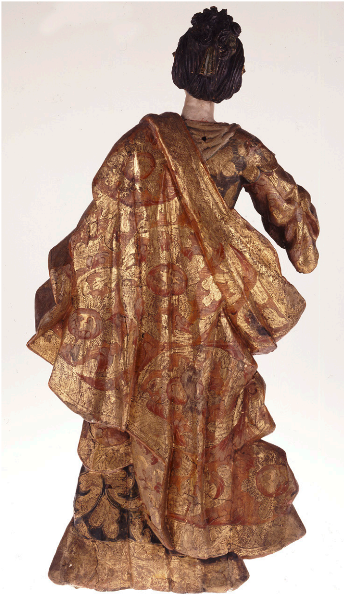
Fig. 6. Autor desconocido, Santa Lucía o santa mártir (detalle del manto), siglo XVIII. Madera tallada, dorada, policromada y estofada. Colección Museo Franz Mayer, Ciudad de México. (Fotografía del Museo Franz Mayer).

dan la apariencia de ser prendas rígidas ya que no revelan ningún pliegue. Si bien los motivos ornamentales son parecidos a los encontrados en las faldas, no presentan picado de lustre, sino punzonados finos en los bordes y líneas horizontales en el interior, complementado por esgrafiado en los fondos de ambos casos. Cada mártir lleva guarniciones diferentes en esta prenda: Lucía porta en el cuello una especie de collar adornado con cinco piedras preciosas, terminado en dos dijes en forma de flor que le cuelgan del pecho y del que se sostiene un fino paño que le envuelve la cintura. Este paño también forma un moño en el pecho, el textil es de fondo blanco con líneas rojas y verdes. La santa mártir porta también una guarnición en el cuello, y paños que sostenidos por un par de broches, uno de ellos cubierto por el manto, cruzan sobre su pecho para unirse en un tercer broche, de donde también se sostiene una tela que le envuelve la cintura.