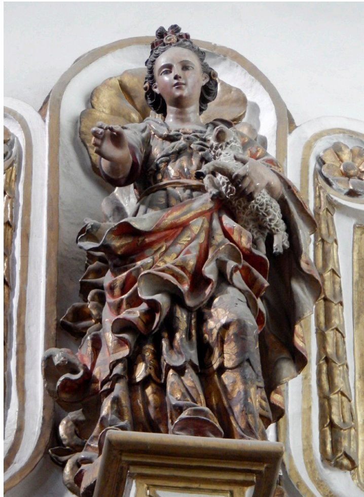
Fig. 4. Autor desconocido, Santa Inés , siglo XVIII. Madera tallada, dorada, policromada y estofada. Iglesia de San Diego de Alcalá, Aguascalientes. (Fotografía de Montserrat A. Báez Hernández).