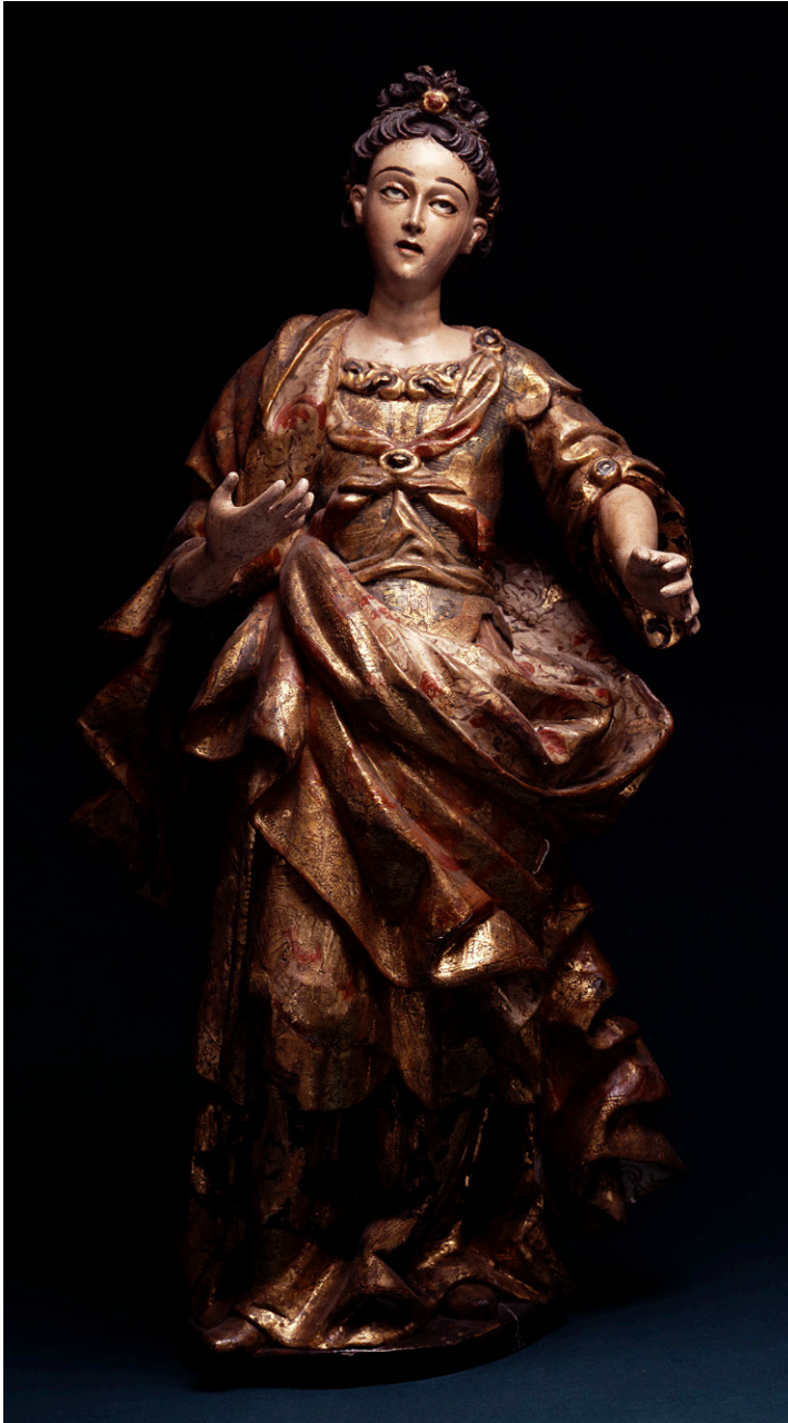
Fig. 2. Autor desconocido, Santa Lucía o santa mártir , siglo XVIII. Madera tallada, dorada, policromada y estofada. Colección Museo Franz Mayer, Ciudad de México.

Al respecto, un cúmulo de artículos y publicaciones recientes que problematizan sobre la necesidad de proponer nuevos marcos de referencia para el estudio de la escultura novohispana, 4 plantean, además de abordarla desde sus procesos constructivos —en los que intervenían escultores, doradores y pintores—, la búsqueda de diseños característicos y señas presentes en las policromías y la representación de textiles, generalmente denominados estofados, que permitieran comenzar a caracterizar centros productores de la Nueva España como la Ciudad de México o Puebla de los Ángeles. Este creciente interés ha contribuido a afianzar la importancia de los estofados no sólo como ejemplos de la maestría y destreza de los artesanos policromadores, sino también como un rasgo de identidad de la imaginería novohispana que permite identificar su presencia inclusive en regiones alejadas de América. 5