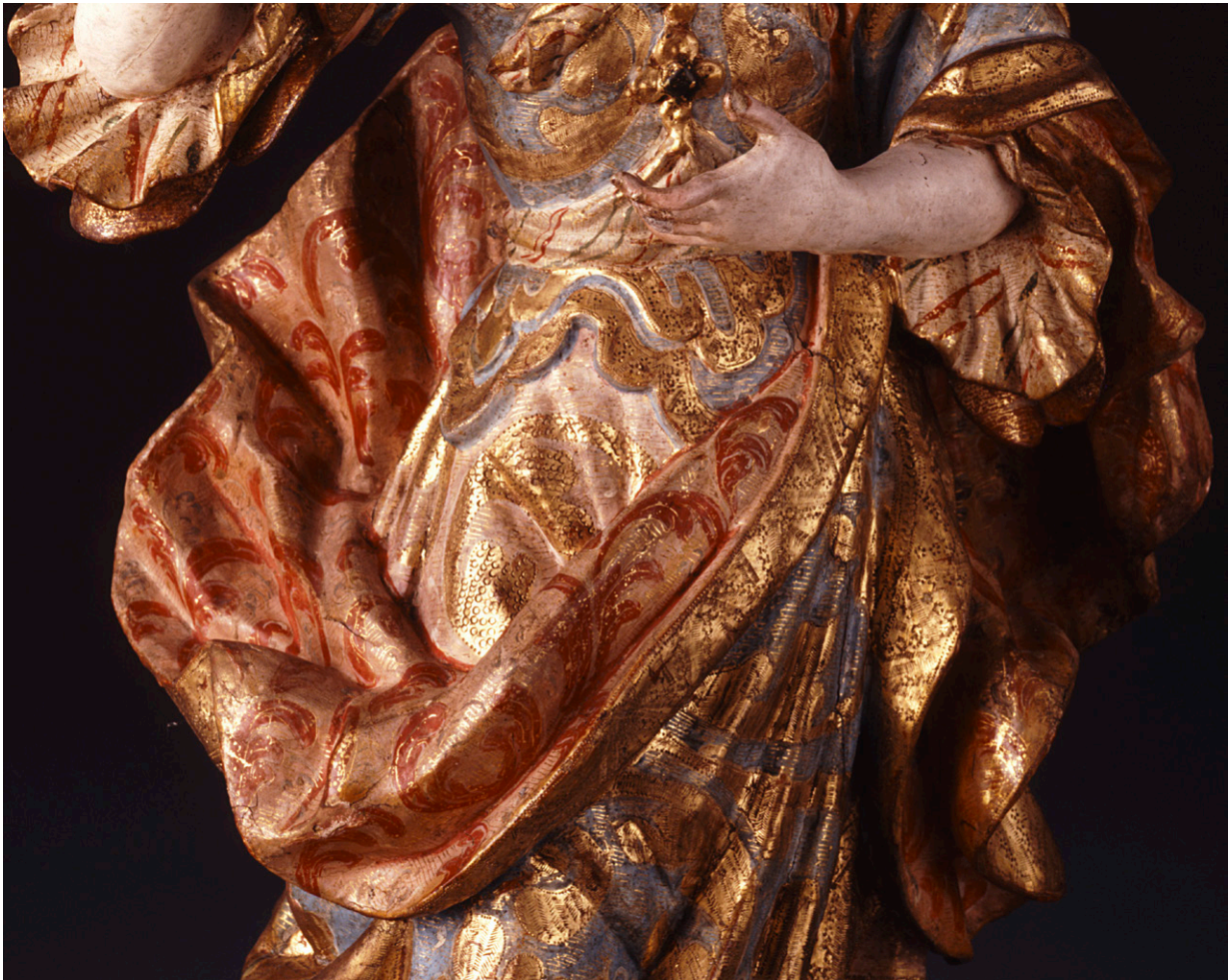
Fig. 5. Autor desconocido, Santa Lucía (detalle de la policromía), siglo XVIII. Madera tallada, dorada, policromada y estofada. Colección Museo Franz Mayer, Ciudad de México. (Fotografía del Museo Franz Mayer).

original en mármol que existe en el Museo provincial de Antigüedades de Tarragona”. 32 ¿Se trata este peinado de un elemento más de la interpretación historicista de los mártires de los primeros siglos?