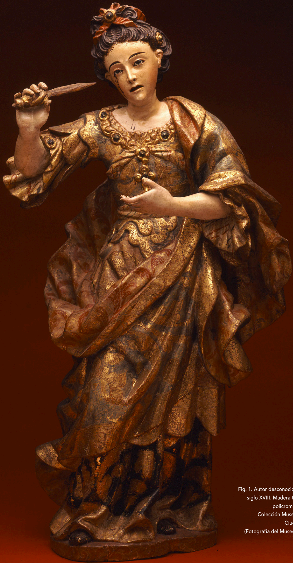
Fig. 1. Autor desconocido, Santa Lucía , siglo XVIII. Madera tallada, dorada, policromada y estofada. Colección Museo Franz Mayer, Ciudad de México.