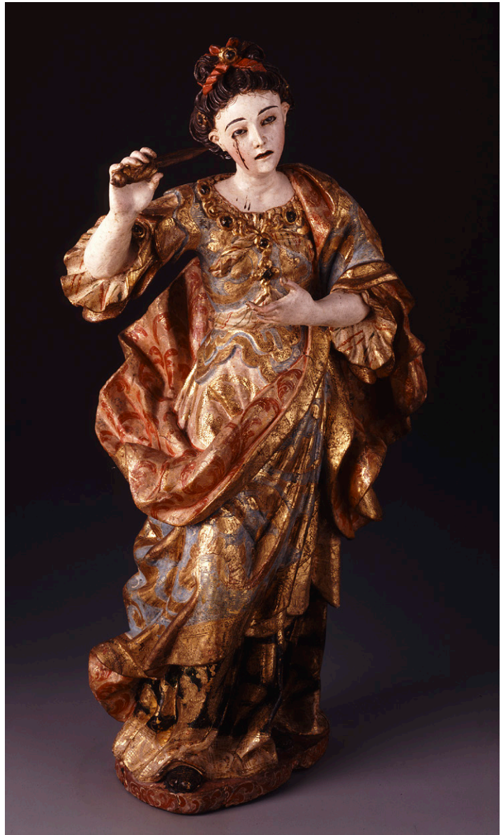
Fig. 7. Autor desconocido, Santa Lucía , siglo XVIII. Madera tallada, dorada, policromada y estofada. Colección Museo Franz Mayer, Ciudad de México.

Uno de los aspectos más interesantes de este par de esculturas nos remite a la iconografía de la santa identificada como Lucía, en la cual se centrará este apartado (Fig. 7). La segunda escultura, por carecer de atributos, podría tratarse de cualquier santa mártir de los primeros siglos: Catalina, Bárbara o Águeda; sin embargo al no poseer ningún elemento que nos proporcione una pista, la atribución queda abierta a futuras reflexiones. En el caso de santa Lucía, Elisa Vargaslugo es la primera autora en registrar la pieza con este nombre por “estar en el momento de sacarse los ojos”. 39 En las subsecuentes publicaciones Consuelo Maquívar también continúa reconociéndola como tal: