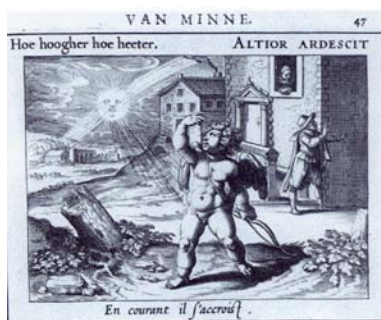
Hooft. Emblemata amatoria (1611).

un artista de discreta calidad que produjo esculturas con técnica correcta pero sin fuerza expresiva ni novedades compositivas, cuya actividad fundamentalmente escultórica coincide y supera en el tiempo a la de Pedro de Mena en Málaga. También ha sido descartada la formación del arquitecto-ensamblador Bernardo Simón de Pineda por los mismos argumentos y por la documentación que hemos aportado en el estudio de su aprendizaje con Alejandro de Saavedra 65 .