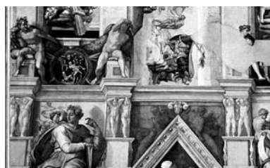
Miguel Angel Bounarroti. Capilla Sixtina, Roma.