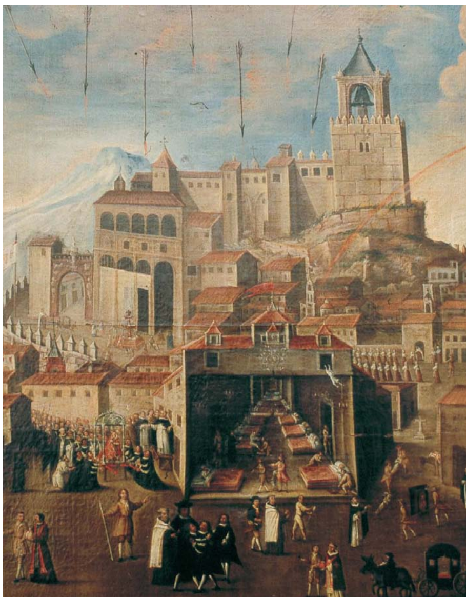
Anónimo, La peste negra en Antequera . Antequera. Iglesia de Santo Domingo