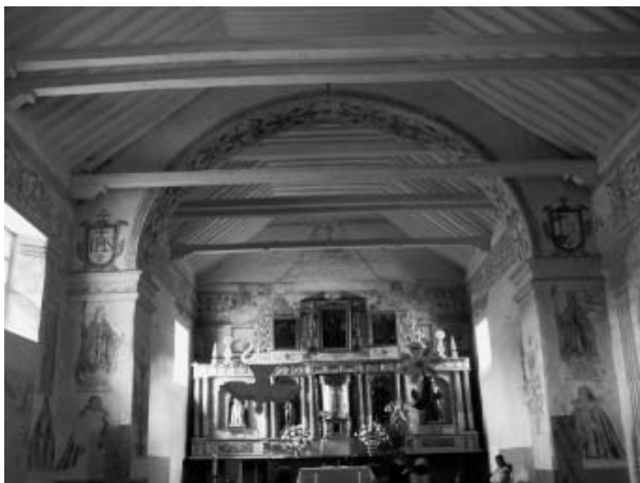
Arco toral del templo.

Pasemos ahora a un análisis más pormenorizado de las pinturas.