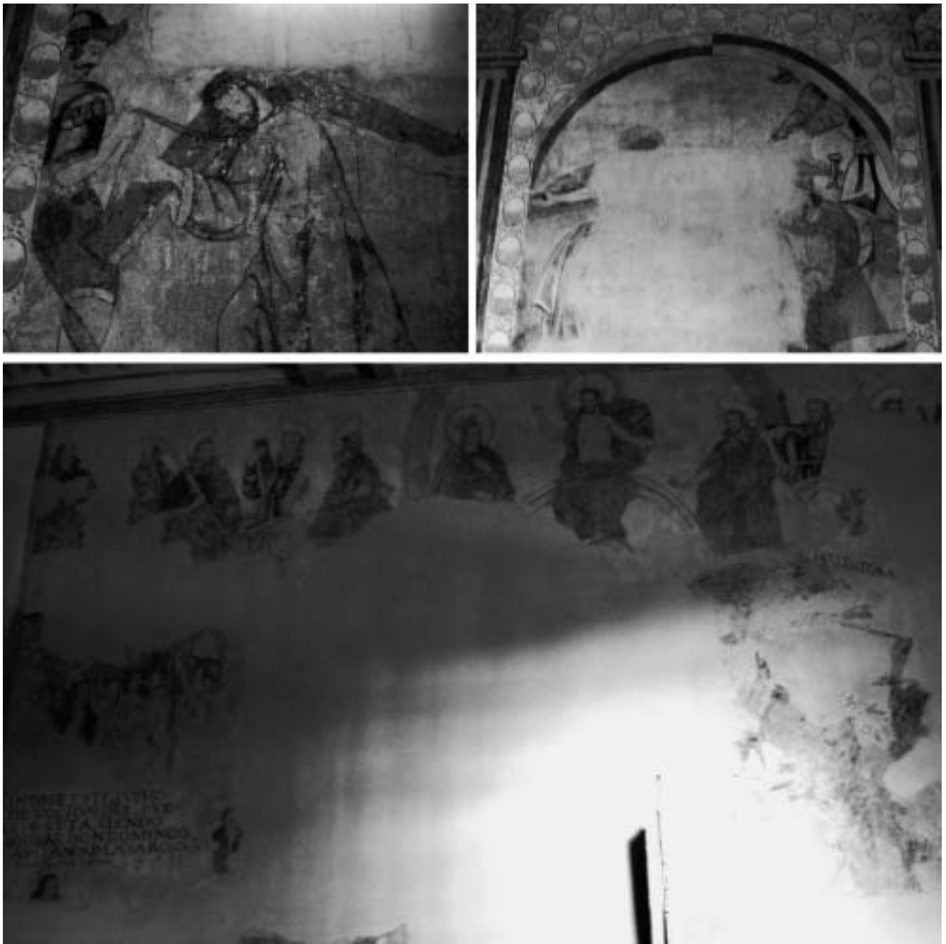
Escenas del lado del Evangelio

son más “históricos” en el sentido de que, como humanista y renacentista, se tomó el trabajo de estudiar y dibujar el traje antiguo de los soldados romanos, en vez de presentarlos en ropajes medievales como los de Durero» 15 .