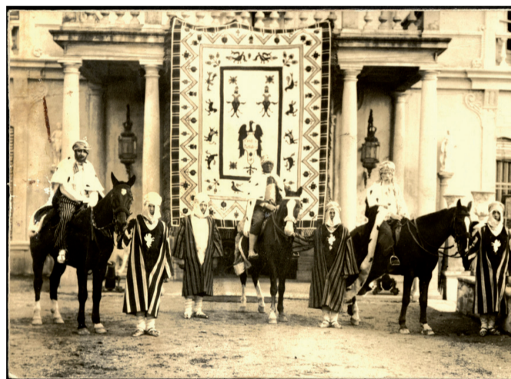
Fig. 4. Reyes en Carmen de los Mártires, 1929.

De acuerdo con las descripciones en prensa y las fotografías conservadas, es posible dar algunas pinceladas sobre el vestuario. Este presentaba influencias orientales con ricos estampados, telas coloridas y variedad de complementos (Figs. 2, 3 y 4). Destaca cierta influencia egipcia en los atuendos y personajes, por lo que habría que entender de una manera amplia el término oriental, más en consonancia con los orientalismos del siglo XIX, que incluían también otras regiones dentro de ese término como podría ser el norte de África. Esa herencia, enriquecida con la literatura de viajes y la abundancia de pinturas, grabados o dibujos sobre este tema, además del pasado nazarí de la ciudad, tendría su influencia en la implantación de los tipos estéticos presentes en estas primeras cabalgatas, sin desviarse del foco de inspiración principal que sería el relato bíblico.