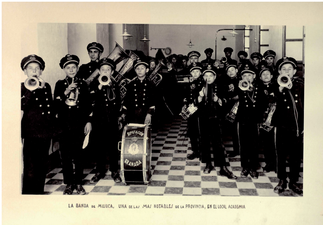
Fig. 9. Banda de Música, Hospicio, 1923-1934.

la penosa situación en la que se encontraban los pequeños, sucedió en 1930, en un periodo de poco menos de un mes murieron 14 niños a consecuencia de una negligencia médica en la aplicación de un tratamiento experimental para la tiña con sales de talio 79 . Se decide convertir en Hospicio Provincial la leprosería regional, el realojo de los niños se produce en 1932 80 , pues para la cabalgata de 1933 y tras el recorrido, los Reyes se desplazaron en un vehículo al nuevo establecimiento "que la Diputación ha construido en Los Ogijares" 81 , ya que la nueva ubicación quedaba lejos del centro 82 . Parece que en esta nueva sede se dejó de levantar el trono habitual, aunque continuaron embelleciendo el lugar, como se indica en 1933: "luciendo el establecimiento artístico alumbrado y otros exornos en la sala donde se verificó la entrega de dones y presentes" 83 .