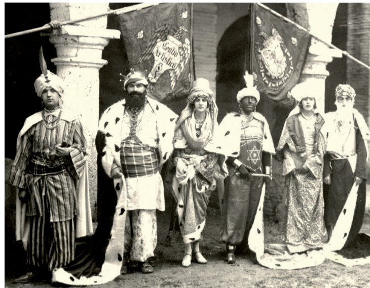
Fig. 3. Reyes, reinas y pajes, 1930.

De acuerdo con las descripciones en prensa y las fotografías conservadas, es posible dar algunas pinceladas sobre el vestuario. Este presentaba influencias orientales con ricos estampados, telas coloridas y variedad de complementos (Figs. 2, 3 y 4). Destaca cierta influencia egipcia en los atuendos y personajes, por lo que habría que entender de una manera amplia el término oriental, más en consonancia con los orientalismos del siglo XIX, que incluían también otras regiones dentro de ese término como podría ser el norte de África. Esa herencia, enriquecida con la literatura de viajes y la abundancia de pinturas, grabados o dibujos sobre este tema, además del pasado nazarí de la ciudad, tendría su influencia en la implantación de los tipos estéticos presentes en estas primeras cabalgatas, sin desviarse del foco de inspiración principal que sería el relato bíblico.