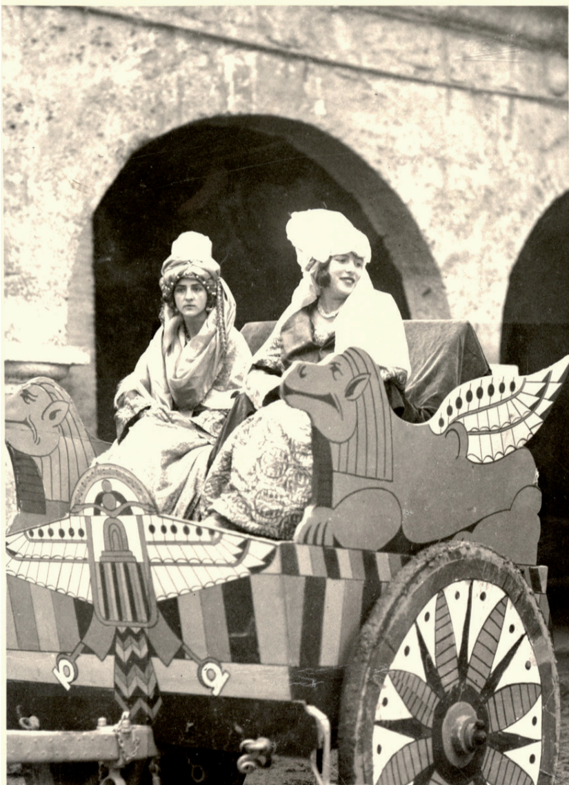
Fig. 1. Carroza en el Pósito de grano, calle Alhóndiga, 1930.

veces las telas eran cedidas por algún comercio 16 , y posteriormente se procedía a la confección o arreglo de los trajes, por lo que normalmente se contrataban los servicios de costureras 17 . Con respecto al diseño de los mismos, solamente ha sido posible constatar la autoría del señor Parrizas en 1934, socio del Centro, quien realizó los dibujos que sirvieron como modelos para los trajes de la cabalgata de ese año 18 .