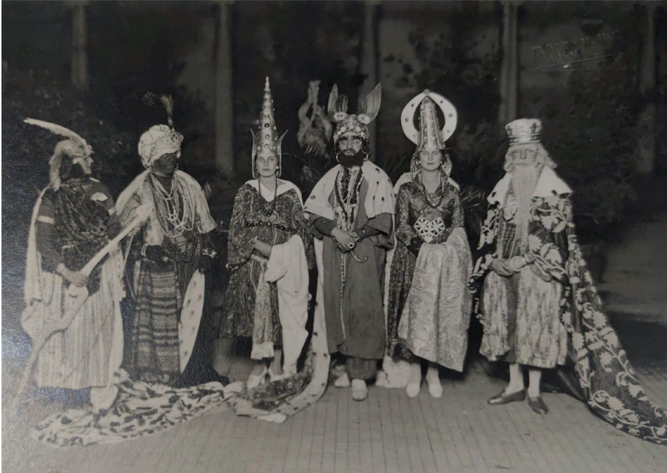
Fig. 8. Trino Guevara y Henares, Reyes Magos y Reinas , 1927.

Pero sin duda, la novedad más original que descubrimos en estas décadas es la incorporación de tres reinas en la comitiva junto a los Reyes Magos (Fig. 8). Así lo señala la prensa en la cabalgata de 1927 53 , en la que aparecieron por primera vez en la parte central del desfile con su corte, seguidas de los Reyes Magos. Ya se venía advirtiendo la importancia que iba adquiriendo la presencia femenina, pues en la cabalgata de 1925 54 se incluyeron odaliscas, y en la de 1926 55 una sultana en palanquín. La cabalgata granadina podría haber sido pionera en incluir tres reinas en sus desfiles, sin embargo la falta de estudios sobre el resto de cabalgatas españolas, con algunas excepciones 56 , impide poder aseverarlo con total rotundidad. Sí es posible constatar la aparición de una reina