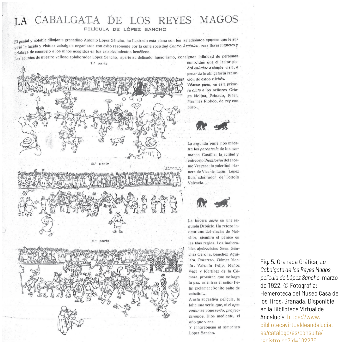
Fig. 5. Granada Gráfica, La Cabalgata de los Reyes Magos , película de López Sancho, marzo de 1922. © Fotografía: Hemeroteca del Museo Casa de los Tiros, Granada. Disponible en la Biblioteca Virtual de Andalucía, https://www.bibliotecavirtualdeandalucia.es/catalogo/es/consulta/registro.do?id=102239 .

intérpretes 46 o reinas llegadas desde lejanos países 47 , sin olvidar identificar con nombres y apellidos a los socios del Centro y otros colaboradores que encarnaban aquellos personajes, sobre todo los que se disfrazaban de Reyes Magos.