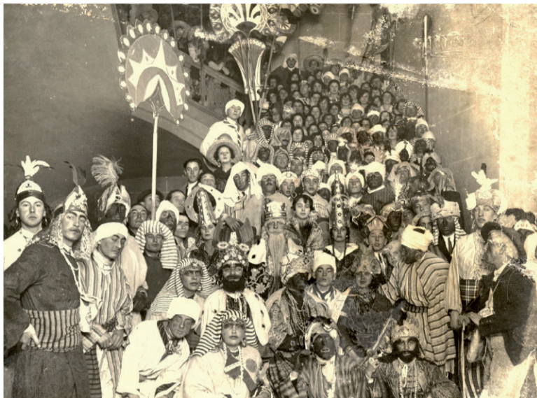
Fig. 2. Reyes, reinas y comitiva, 1927.