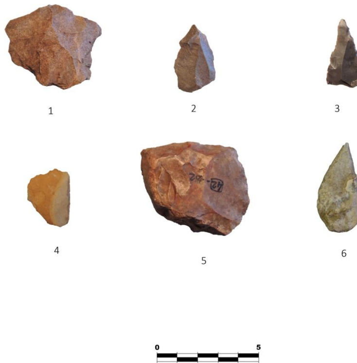
Figura 2. Tecnología lítica. Abrigo de Benzú. (Barrena, 2017): 1: CB-04-CVII-5C-59I-52 (BN1G-CM), 2: CB-04-BVII-5C-60-345 (BP-LE), 3: CB-04-CVII-5C-63-88 (BN2G-R21), 4: CB-07-CV-5ª183-1000 (BN2G-R21), 5: CB-03-BVII-6B-42-182 (BN2G-R23). 6: CB-08-CV-5A-208-1000 (BN2G-P21).

Entre los BN2G-Productos retocados (Tabla 2), Gorham's Cave cuenta con una distribución similar entre raederas y denticulados, donde destacan retoques continuos simples para las primeras y pequeñas sucesiones de muescas en los segundos. No son denticulados especialmente desarrollados 51 .