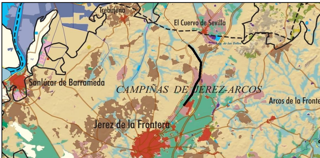
Figura 2. Variedad geográfica del trazado (sobre plano geológico de la Consejería de Medio Ambiente).

El carácter lineal de nuestra intervención hace que se desarrolle sobre un terreno con topografía variada. La zona Norte se caracteriza por un paisaje de suaves lomas miocenas, de arcillas grises- marronáceas con algún nivel arenoso, que sobresalen sobre llanuras aluviales marcadas por el encaje de la red hidrográfica, mientras la parte sur se extiende a una cota más elevada, sobre amplias llanuras pliocuaternarias compuestas por depósitos limoarcillosos rojizos, producto de coluviones, asociados a procesos fluviales y depósitos aluviales.