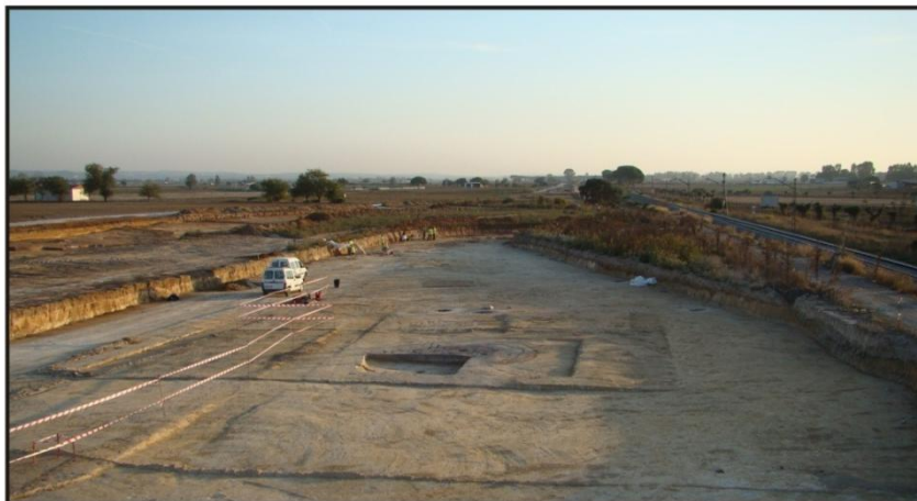
Figura 4. Extensión de sectores 1 y 2 de la zona A en “Canal de Guadalcaén II

Asimismo, la gran superposición de estructuras existente y la secuencia estratigráfica del yacimiento, donde destaca sobre gran parte de la superficie un amplio estrato limo-arcilloso, interpretado como un depósito sedimentario de carácter fluvial, nos lleva a establecer varias fases de ocupación en el mismo terreno, aunque para ellas tan sólo podamos ofrecer en este momento una cronología relativa.