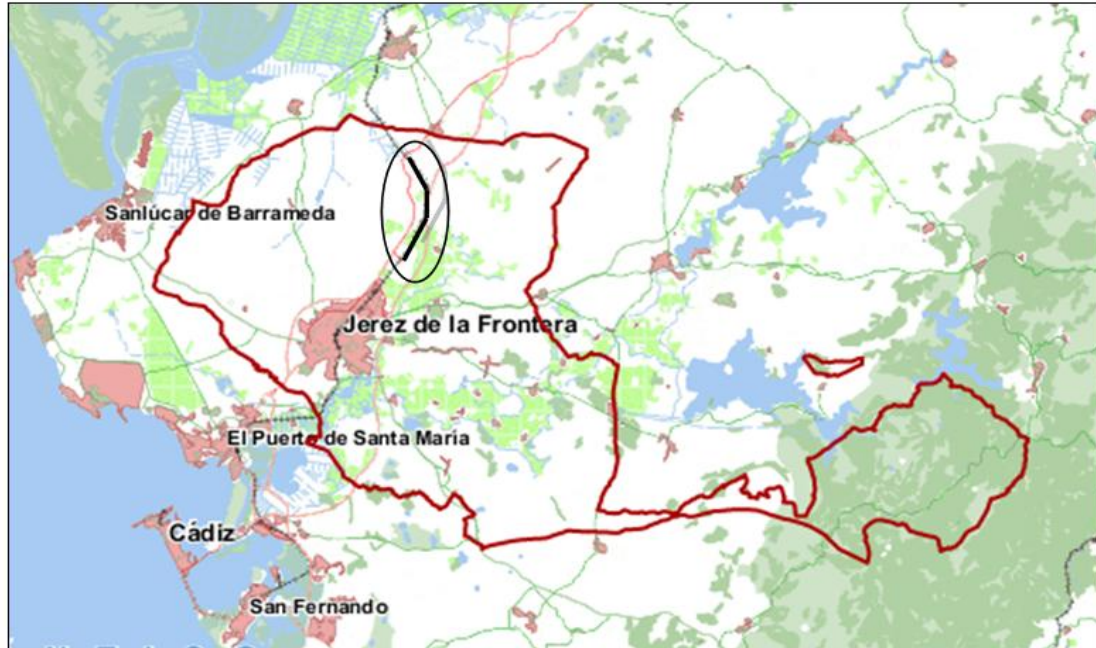
Figura 1. Localización de la intervención, en la zona Norte de la campiña gaditana.

sobre el territorio que nos ocupa, que fueron excavados únicamente en la zona de afección de la obra en cuestión.