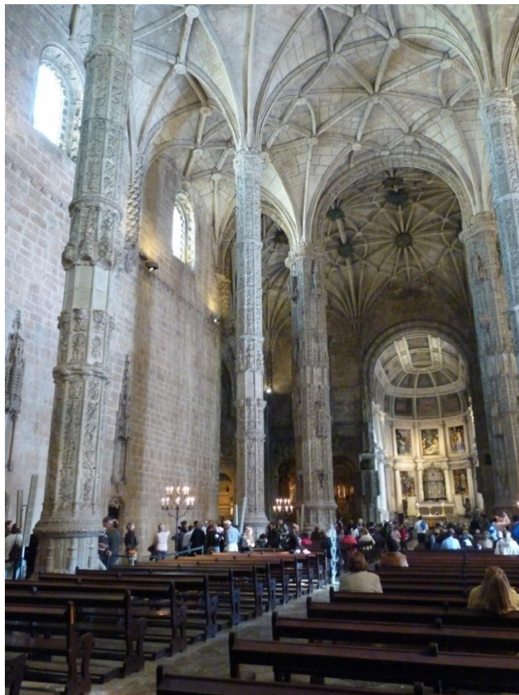
Figura 10. Lisboa. Monasterio de Jerónimos de Belem. Interior de la iglesia.