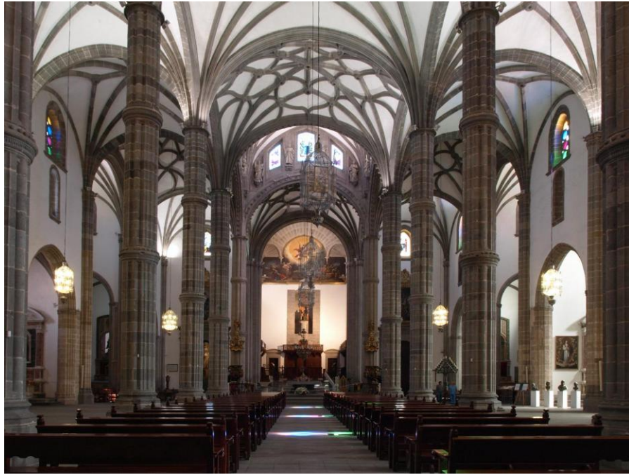
Figura 9. Las Palmas de Gran Canaria. Catedral. Interior.