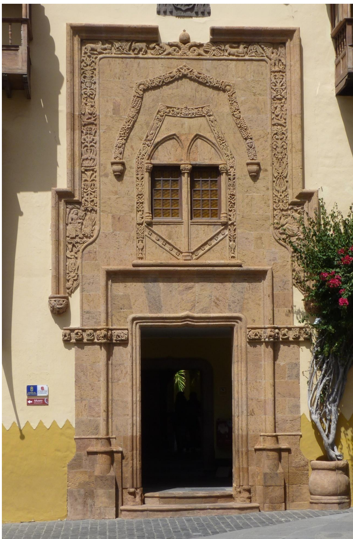
Figura 16. Las Palmas de Gran Canaria. Casa de Colón. Portada.