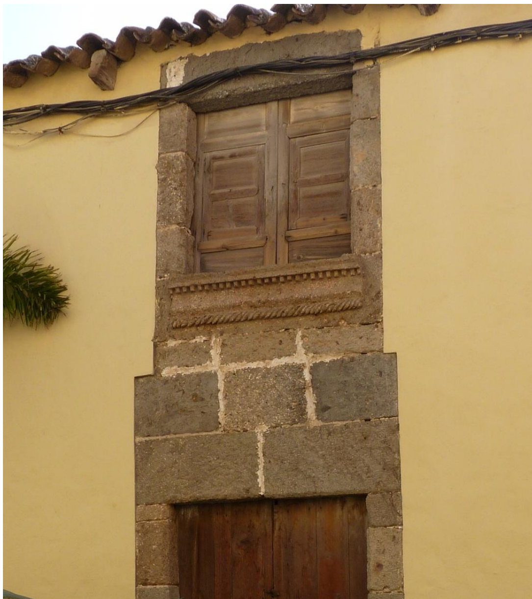
Figura 14. Agüimes. Casa de la calle Santo Domingo. Ventana.