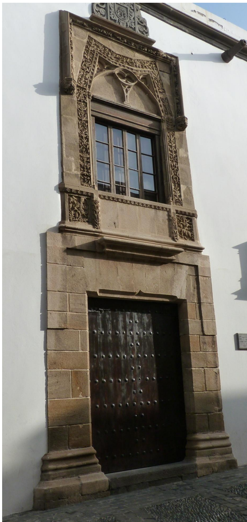
Figura 15. Las Palmas de Gran Canaria. Casa Moxica. Portada.