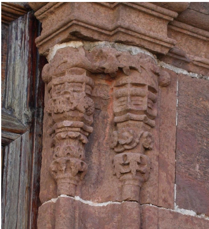
Figura 7. San Cristóbal de La Laguna. Convento de Santo Domingo. Detalle de la portada de la iglesia.