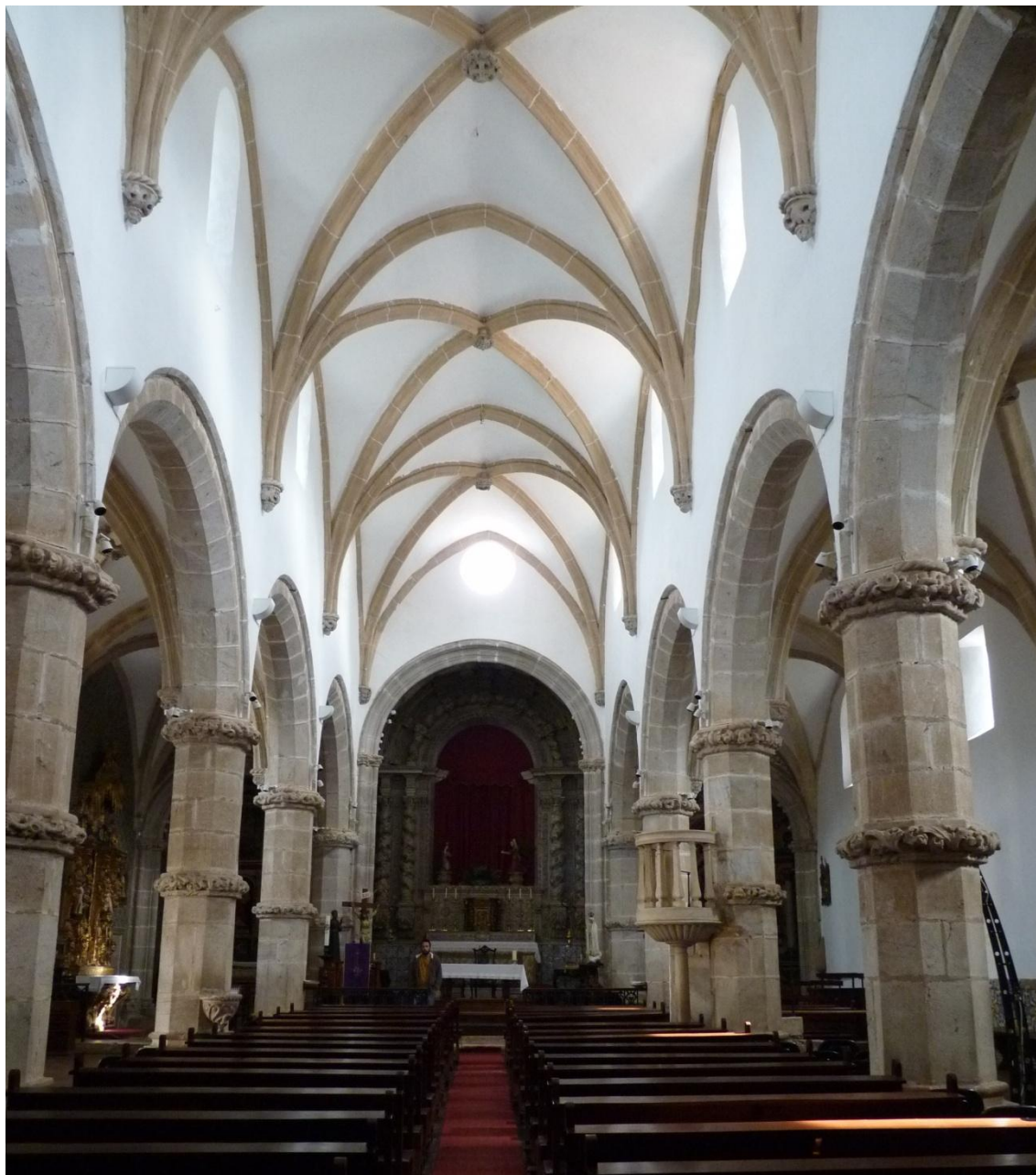
Figura 11. Viana do Alentejo. Iglesia Matriz. Interior.