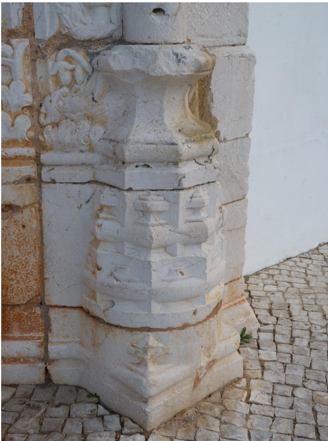
Figura 6. Estombar, Iglesia Matriz. Detalle de la portada.