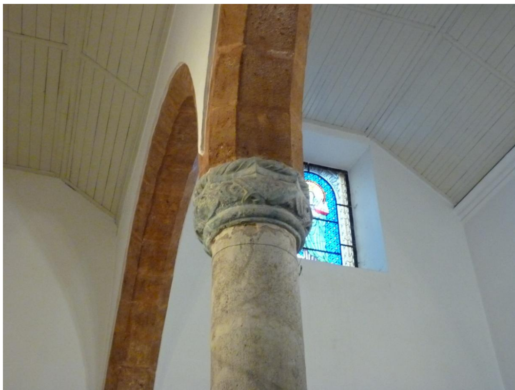
Figura 4. Alvor. Iglesia Matriz. Detalle de la portada.