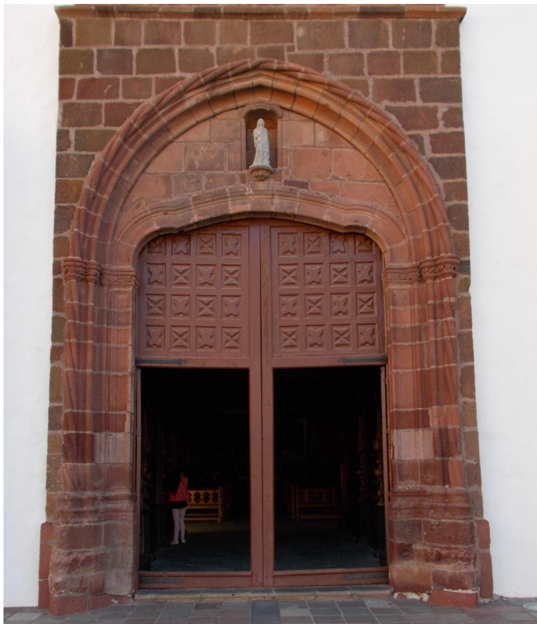
Figura 1. San Sebastián de la Gomera. Parroquia de Nuestra de la Asunción. Portada principal.

la anterior o algunos de los vanos del claustro del convento de Santo Domingo en San Cristóbal de La Laguna ( FIG. 17 ). En estos edificios hallamos una decoración vegetal y figurativa muy plana y tosca, una suerte de versión torpe de los motivos ornamentales del repertorio tardogótico que de haberse realizado en México a buen seguro se hubiese relacionado con la mano de obra indígena. Quizás la respuesta a muchos de los enigmas de la primera arquitectura de la Nueva España no esté en los aztecas, sino en esta orilla del Atlántico.