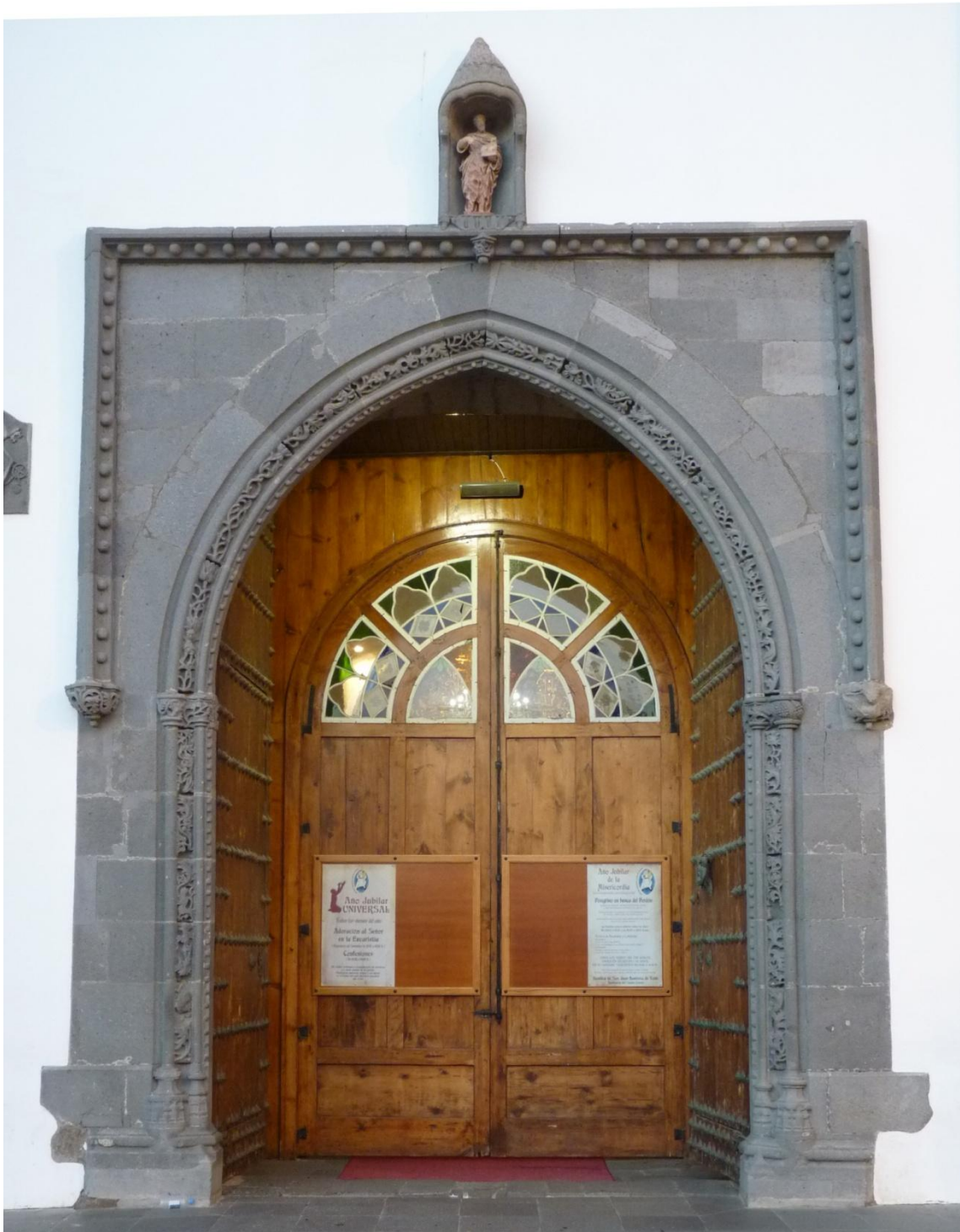
Figura 12. Telde. Basílica de San Juan Bautista.