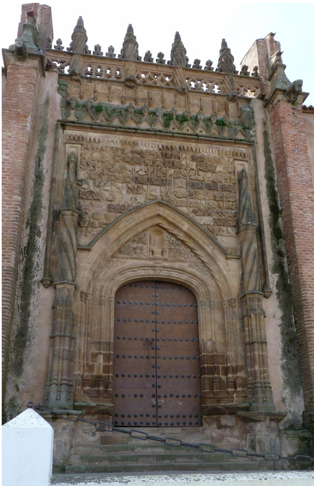
Figura 2. Azuaga. Parroquia de Nuestra Señora de Consolación. Portada lateral.