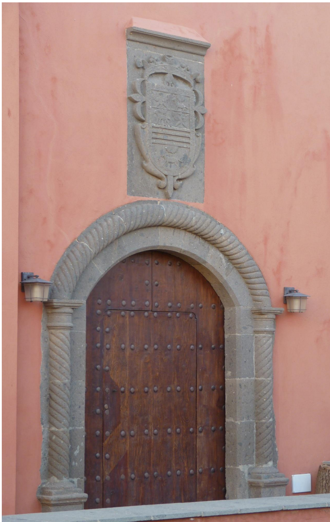
Figura 13. Telde. Casa Condal. Portada.