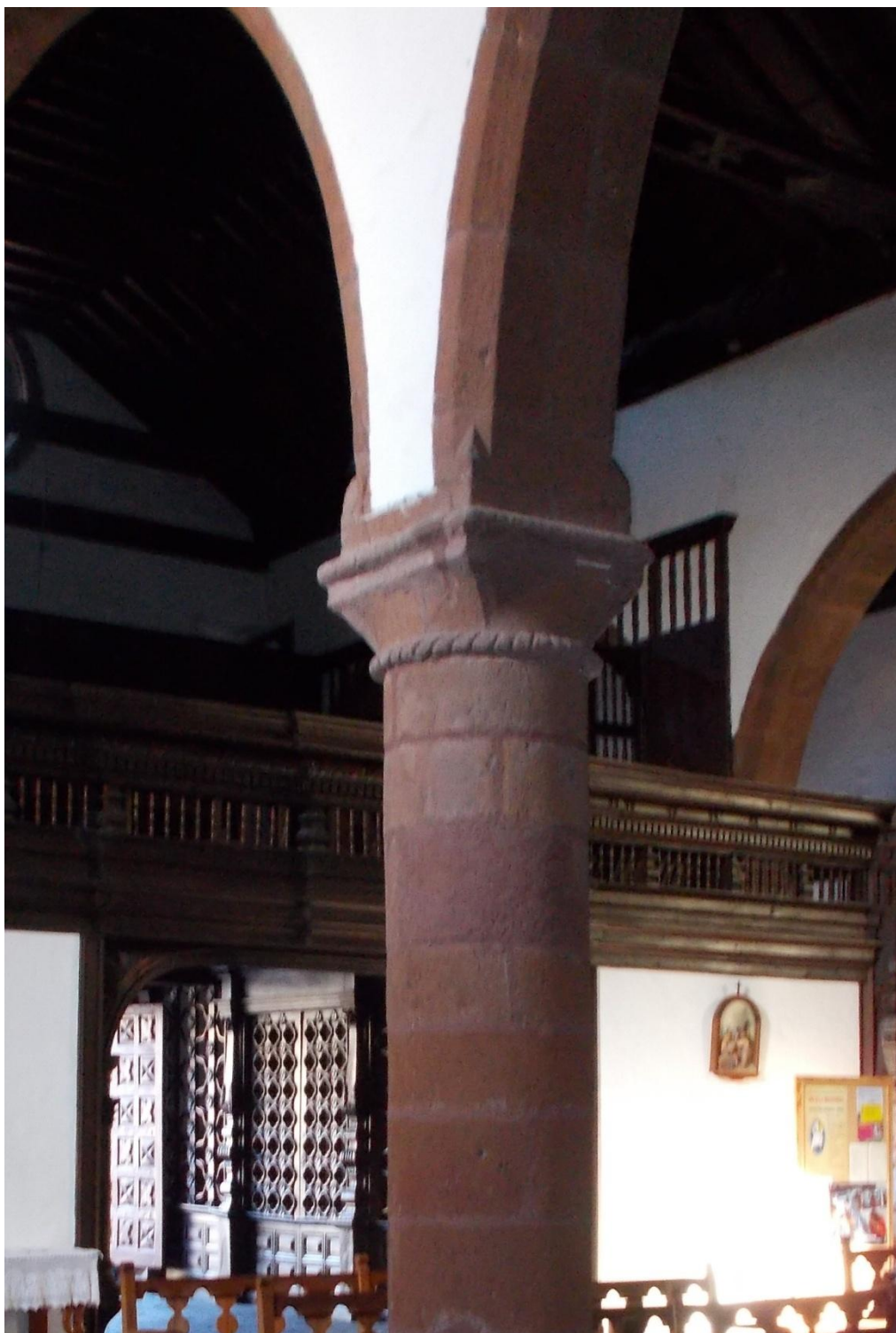
Figura 3. San Sebastián de la Gomera. Parroquia de Nuestra de la Asunción. Capitel