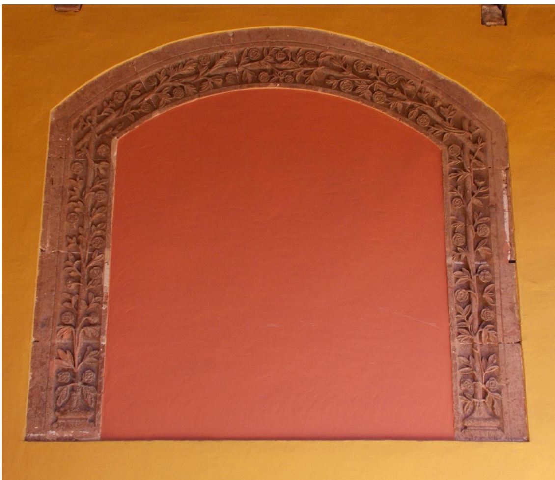
Figura 17. San Cristóbal de La Laguna. Convento de Santo Domingo. Detalle del claustro.