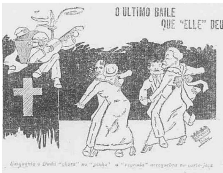
Fig. 2: Ilustração publicada no Jornal A Rua , em 11 de novembro de 1914, fazendo referência ao Baile Presidencial.

Para compreender a dinâmica da relação conflituosa e, por vezes, harmoniosa da elite branca com os produtos culturais produzidos por negros libertos ou escravizados no meio urbano carioca de meados do século XIX, é necessário retroagir há anos antes do episódio do Catete e analisar como a estratificação social, a política e, principalmente, as recorrentes mudanças de cunho estrutural da cidade foram de essencial influência para moldar o gosto e influenciar o consumo da sociedade, culminando em uma miscelânea de ritmos que se entremeavam nas ruas entre assobios e batuques, pianos e violões.