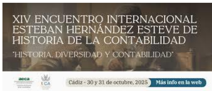
Cartel de la edición XIV celebrada en Cádiz (30-31 de octubre de 2025)