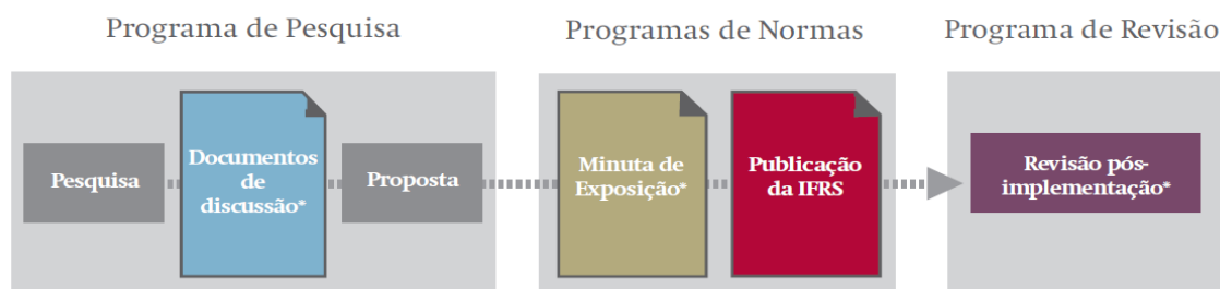
Figura 1 – processo de emissão e revisão de normas – fundação IFRS

O processo atual de elaboração e de revisão das normas encontra-se ilustrado na figura 1.