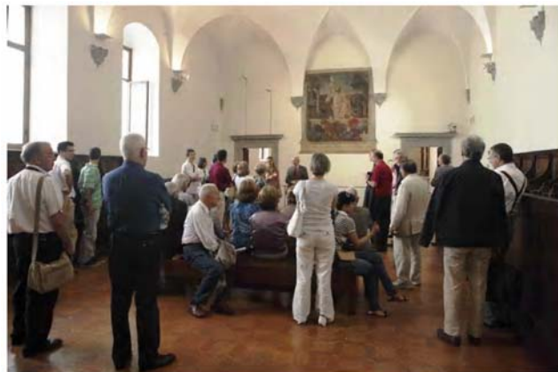
Museo Cívico. Salón de los Conservadores

Universidad, y de toda la comunidad académica presente en el Encuentro. El profesor