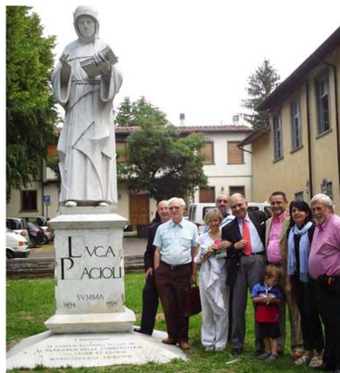
Antiguo convento franciscano