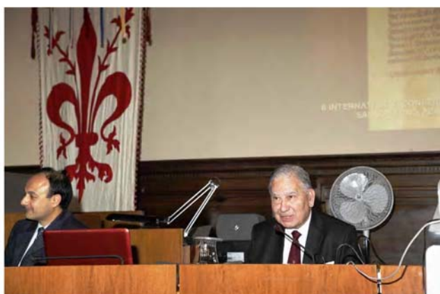
Conferencia de Clausura