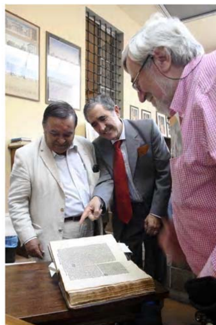
Museo Cívico: La Summa!

Con las dos sesiones paralelas de presentación de comunicaciones finalizó la etapa académica del Encuentro en Sansepolcro. Al día siguiente, 18 de junio, por la mañana, tuvo lugar una interesante y esperada visita a los lugares paciolianos de la ciudad. En primer lugar, se visitó por el exterior el convento donde Luca Pacioli fue Prior, edificio que ya no cumple tal función. En todo caso, nos satisfizo poder contemplar desde fuera la ventana de lo que había sido su celda prioral. A continuación, pasamos a visitar la Catedral, donde se nos explicó el origen de la ciudad de Sansepolcro, fundada por los peregrinos Arcano y su criado Egidio, este último español, según la tradición, que volvían de Jerusalén con una reliquia del Santo Sepulcro. Pararon a pernoctar en este lugar y al levantarse por la mañana, siguiendo un signo divino, decidieron quedarse y levantar una ermita allí para custodiar la santa reliquia. En este mismo lugar, se levanta ahora la Catedral. Ésta fue fruto de los trabajos de restauración y reforma efectuados entre 1300 y 1350 en la anterior abadía camaldulense. Su estructura es románica y sus proporciones góticas. En su interior se custodian importantes pinturas, entre otras, del Perugino, maestro de Rafael, así como un notable crucifijo de madera del siglo X, llamado del Sagrado Rostro, porque está inspirado en la Sábana Santa de Turín.