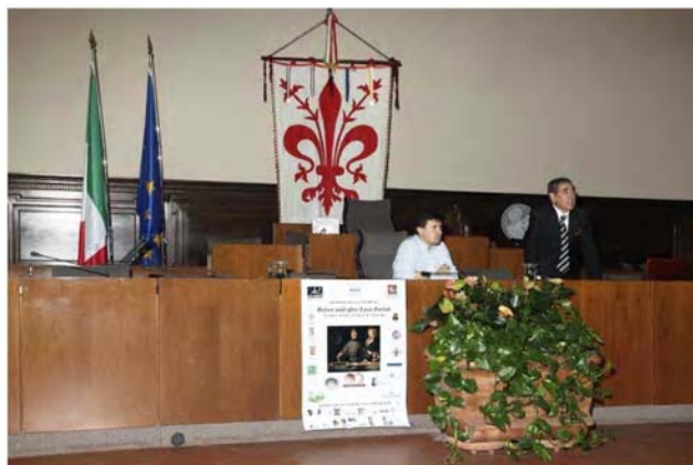
Presentación del Vicecalde Dario Nardella