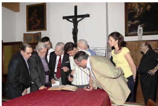
Examinando el Necrologium