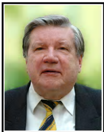
Yaroslav V. Sokolov. Un gigante de la historia de la contabilidad

Las comunicaciones libremente enviadas y aceptadas fueron distribuidas en dos sesiones paralelas. La primera agrupó las comunicaciones en inglés y la segunda las