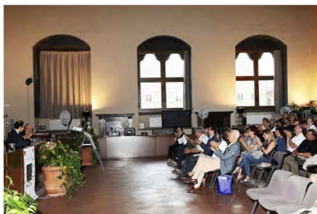
Salone dei Duecento: Final del Congreso

Por el contenido de las páginas precedentes se habrá podido apreciar la categoría y variedad de las personalidades científicas, procedentes de los campos de la historia de la matemática, de la contabilidad, de la filosofía, del Renacimiento y de la vida y obra pacioliiana, que intervinieron en el Congreso. El Encuentro reunió a un destacado colectivo de científicos e intelectuales realmente difícil de poder ser juntados otra vez. En efecto, en el curso del mismo intervinieron conocidos especialistas de China, España, Estados Unidos, Italia, México, Portugal, Reino Unido de Gran Bretaña, Rusia y Turquía, representando respectivamente a universidades tan importantes como la Zhongnan University of Economics and Law, de Wuhan, China; la Universidad Autónoma de Madrid, la Universidad de Burgos, la Universidad Complutense de Madrid, la Universidad