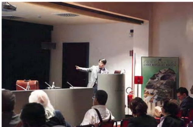
Intervención Song Limeng

admirar un magnífico vitral representando la Ultima Cena de Leonardo da Vinci, obra de