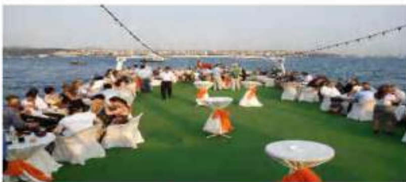
BOAT TOUR AT BOSPORUS ( SEPTEMBER 17, 2010 )