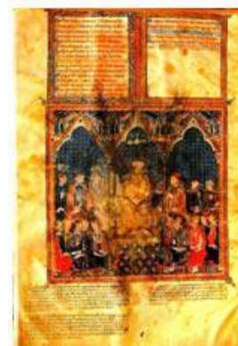
Manuscrito de la Primera Crónica General de España , de Alfonso X (1260)

la “Casa de la Espiritualidad”. Para los que deseen hospedarse en el casco antiguo se gestionarán plazas de hotel. Los actos académicos del Encuentro constarán de siete conferencias plenarias y de las sesiones paralelas necesarias para que sean expuestas las comunicaciones que sean enviadas y aceptadas para su presentación. La conferencia inaugural se celebrará en la Sala del Milagroso Pendón de Baeza. La historia del Milagroso Pendón de Baeza se remonta al verano del año de 1147. En plena reconquista el emperador Alfonso VII se vio detenido en los escarpes de Baeza, cuando avanzaba con sus tropas hacia Almería. Según la Primera Crónica General de España ,