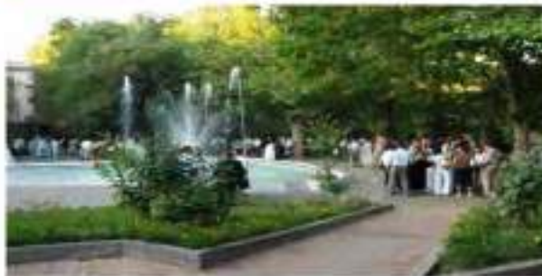
WELCOME COCKTAIL HARBIYE MILITARY MUSEUM AND CULTUREL CENTER - SEPTEMBER 14, 2010