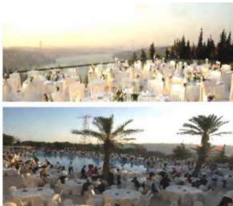
GALA DINNER ( KANDILLI, ISTANBUL - SEPTEMBER 15, 2010 )