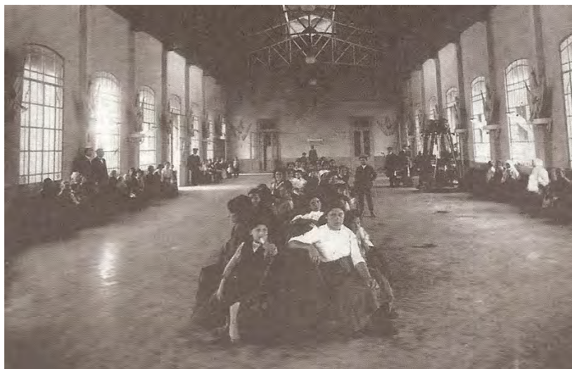
Fig. 1: Sala central del Hotel de Inmigrantes (Feierstein, 2007: 60).

El Hotel de Inmigrantes estaba administrado por el Departamento de Inmigración. Era un edificio muy grande, construido en madera con techo de chapa. Aunque las condiciones sanitarias eran precarias, ofrecía un techo y comida a los recién llegados. El dormitorio era una gran sala con literas.