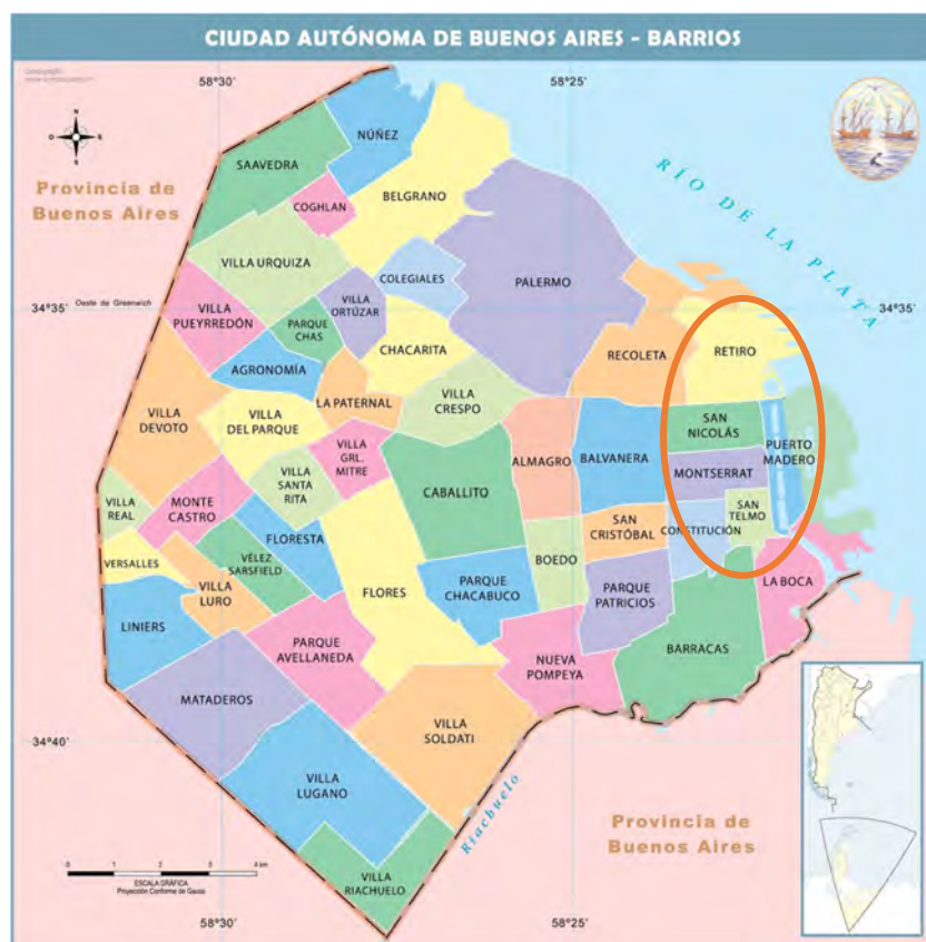
Fig. 5: El centro de la ciudad de Buenos Aires.

De manera general, la elección del lugar de residencia estaba influenciada principalmente por las oportunidades laborales, pero también por la presencia de familiares, amigos o incluso personas del mismo origen geográfico. Cada grupo se instalaba en una zona diferente de la ciudad, fundaba sus propias instituciones comunitarias para ayudar a sus miembros, rezar con ellos y ser enterrados entre los suyos. Así, el modelo de instalación en Buenos Aires se asemejaba al de su tierra de origen (Rein, 2012: 41-42).