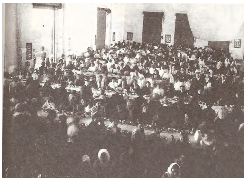
Fig. 3: Comedor (Feierstein, 2007: 61).

El período comprendido entre 1880 y 1930 se caracterizó por un flujo sólido y constante de inmigrantes hacia Argentina. Las cifras muestran un total de tres millones de inmigrantes durante esas cinco décadas (Mirelman, 1988: 4).