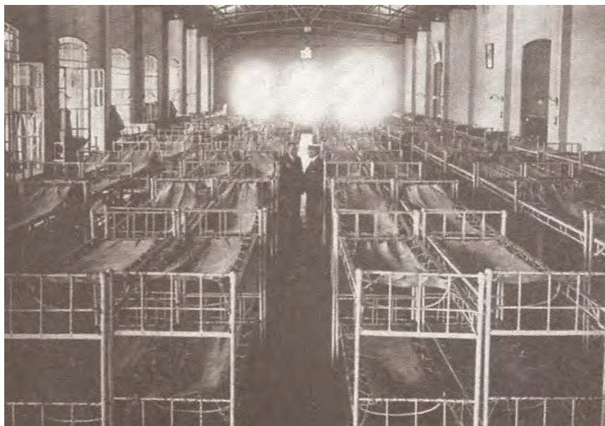
Fig. 2: Dormitorios (Feierstein, 2007: 60).