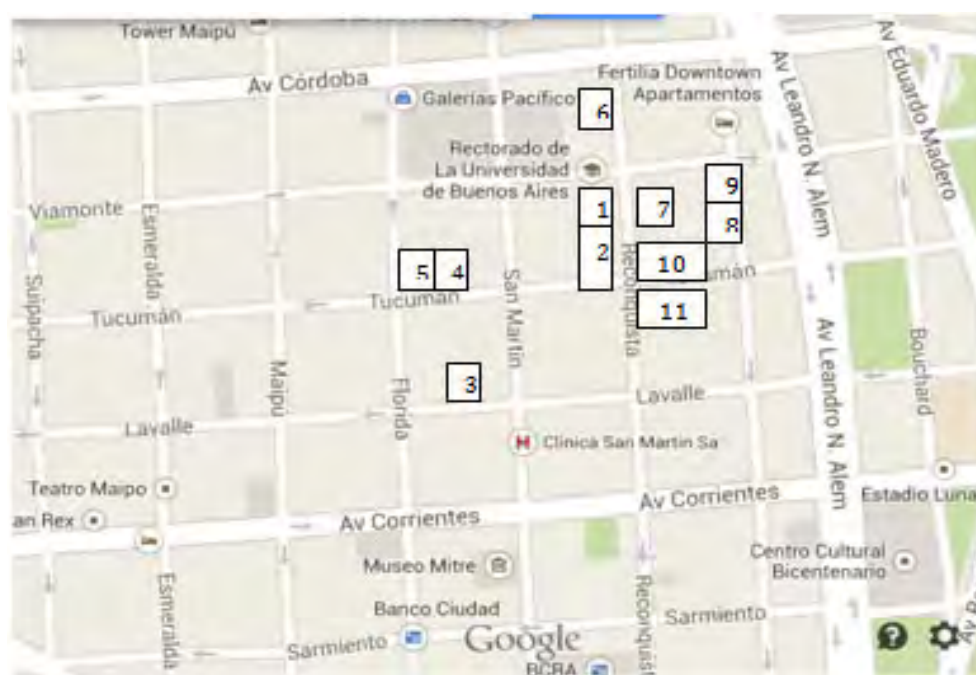
Fig. 6: Plano del centro de Buenos Aires con la ubicación de los comercios judeoespañoles 4 .

La mayoría de los judeoespañoles establecidos en este barrio eran vendedores ambulantes. Con el tiempo, algunos lograron abrir un negocio donde principalmente vendían telas, algunas de fabricación argentina y otras importadas de Europa.