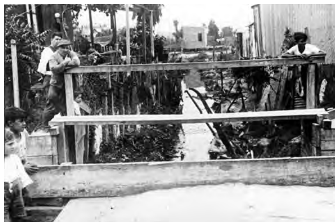
Fig. 7: El arroyo Maldonado a principios del siglo XX 6 .

Hacia 1885, este emplazamiento comenzó a ser codiciado por las industrias del cuero y del calzado, ya que la ciudad de Buenos Aires carecía de terrenos y Argentina estaba en pleno desarrollo industrial. La cercanía con el arroyo Maldonado también era «positiva», pues servía para evacuar los desechos.